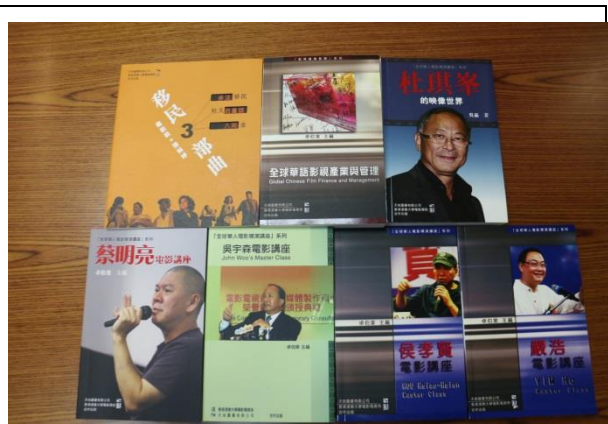
浸會大學電影學院出版專書