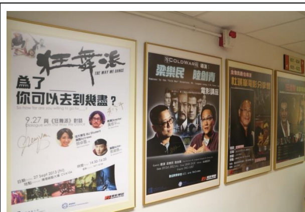
浸會大學電影學院講座海報