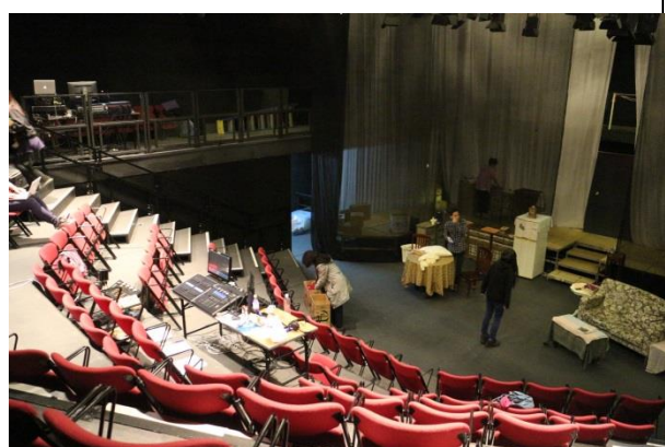
香港演藝學院小型演出場所