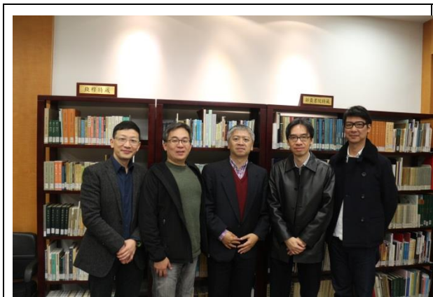
與香港中文大學藝術系合影