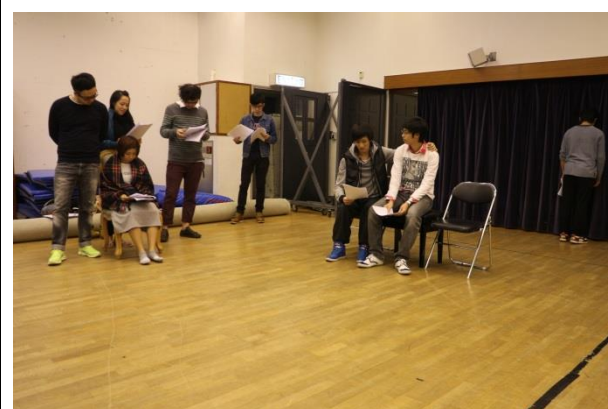
觀摩香港演藝學院劇本創作課程