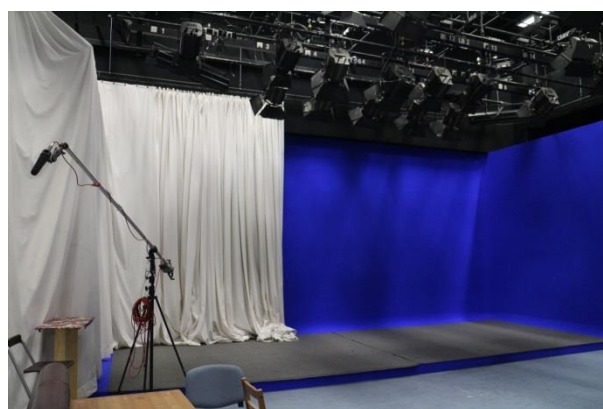
浸會大學電影學院攝影棚