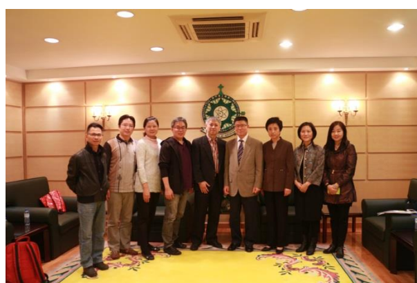
與澳門理工學院藝術高等教育學校拜會對象合影