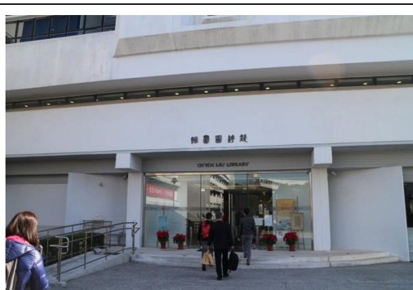
隸屬於新亞書院之錢穆圖書館