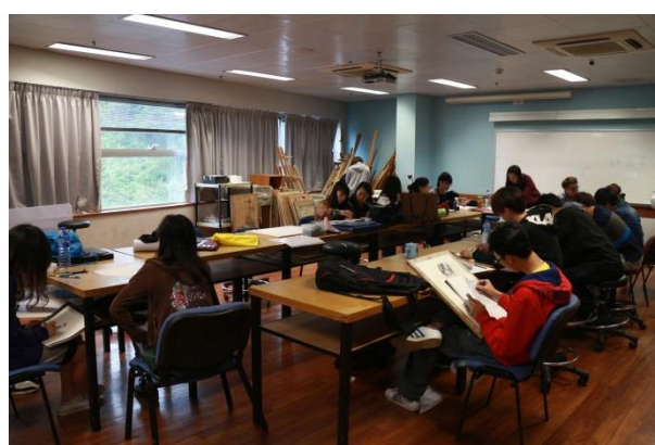
澳門理工學院藝術高等教育學校學生上課情況