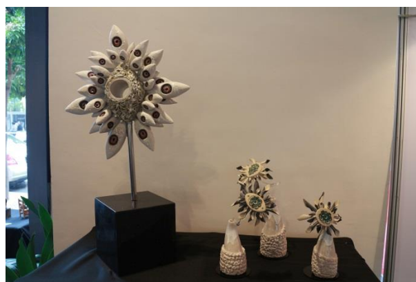
澳門理工學院藝術高等教育學校視覺藝術課程學生作品