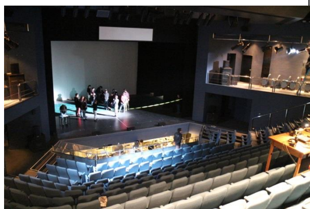
香港演藝學院學生戲劇排演