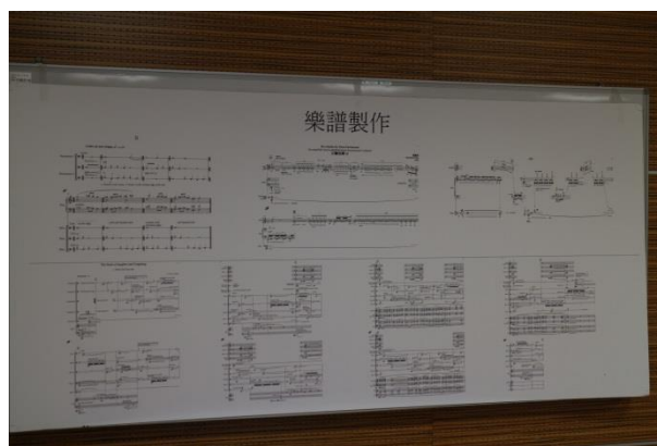
澳門理工學院藝術高等教育學校視覺音樂課程學生作品