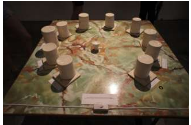
展覽 Etiquette III - Truth or Dare | FILM 展場一隅