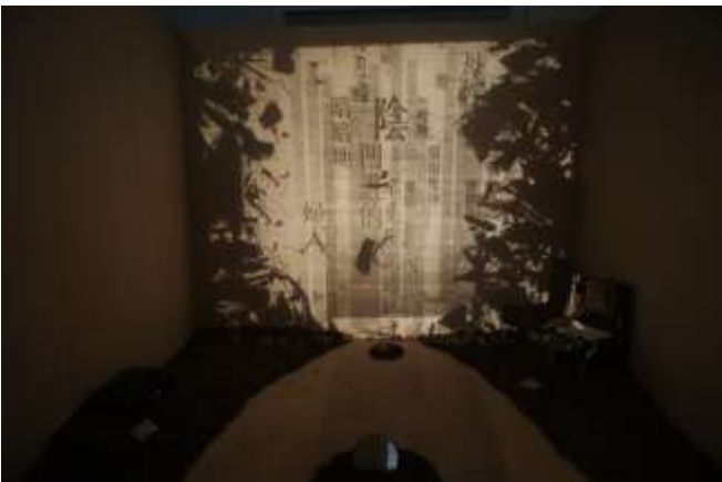
展覽 Ghost: The Body at the Turn of the Century 展出現場