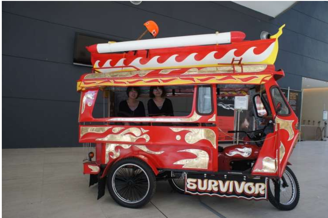
菲律賓藝術家 Siete Pesos, 2243: Moving Forward , 2013