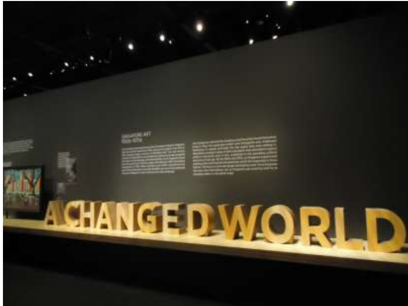
結合典藏品、研究史料及訪談文獻的主題策畫展「世界已改變」 (A Changed World)。