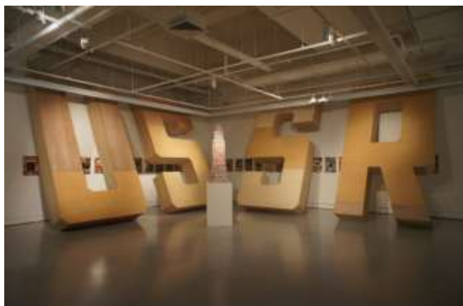
Lost to the Future 展覽現場一隅