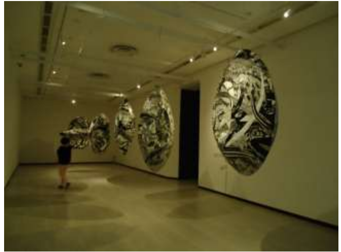
Zulkifli Yusoff, Rukunegara 1: Belief in God