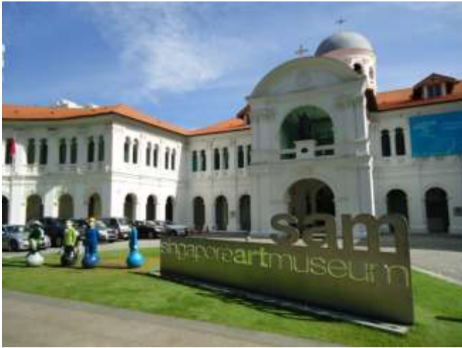
新加坡美術館外觀