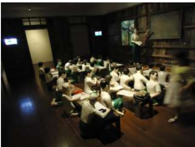
Nge Lay, The Sick Classroom 2013