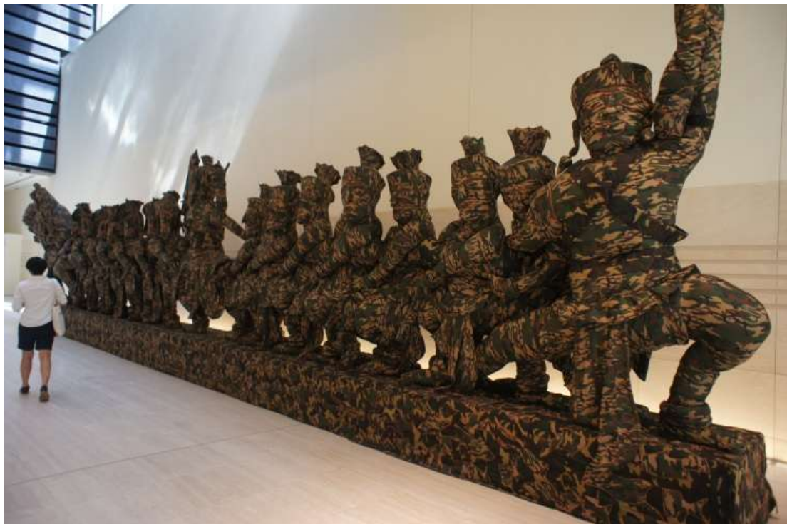
柬埔寨藝術家 Svay Sareth, Toy (Churning of the Sea of Milk) 2013