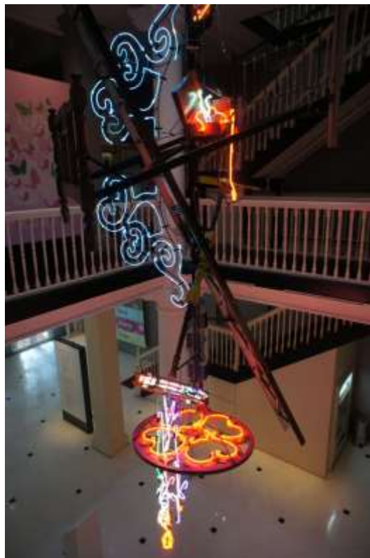
泰國藝術家 Nopchai Ungkavatanapong 展示作品「I have seen A Sweeter Sky」