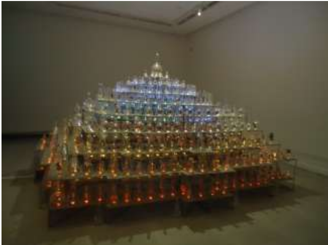
Nasirun, Between Worlds 2013