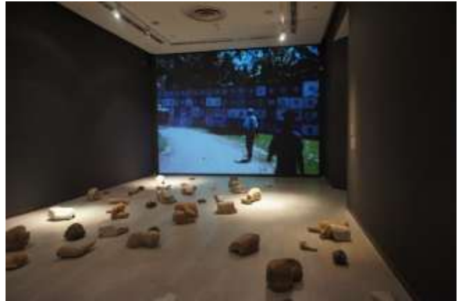
Kiri Dalena Monuments for a Present Future 2013