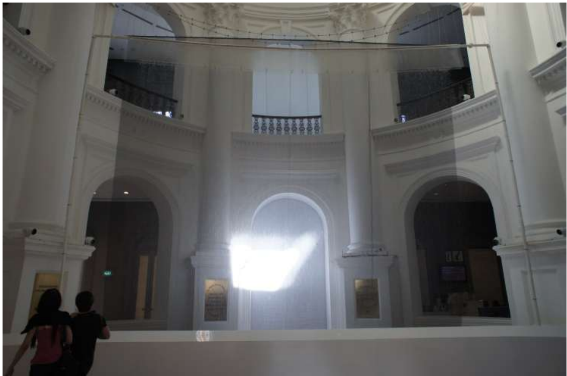
Suzann Victor, Rainbow Circle: Capturing a Natural Phenomenon 2013