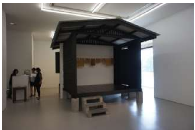
參訪 Gillman Barracks 藝術區畫廊