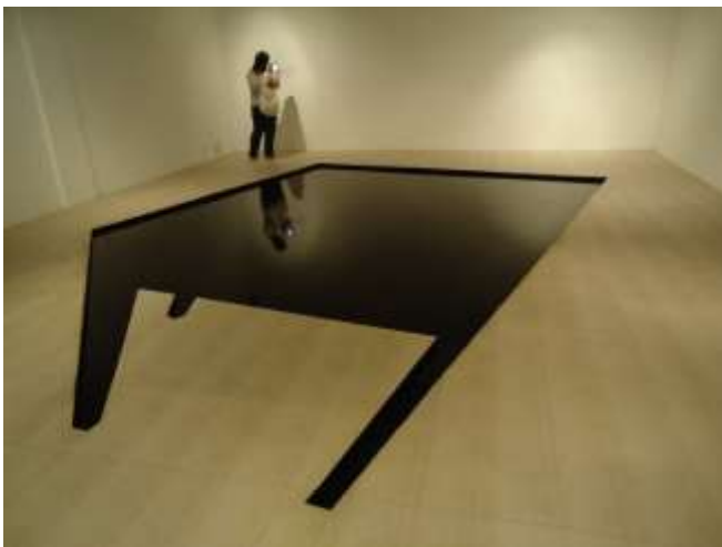
Nguyen Huy An, The Great Puddle , 2009