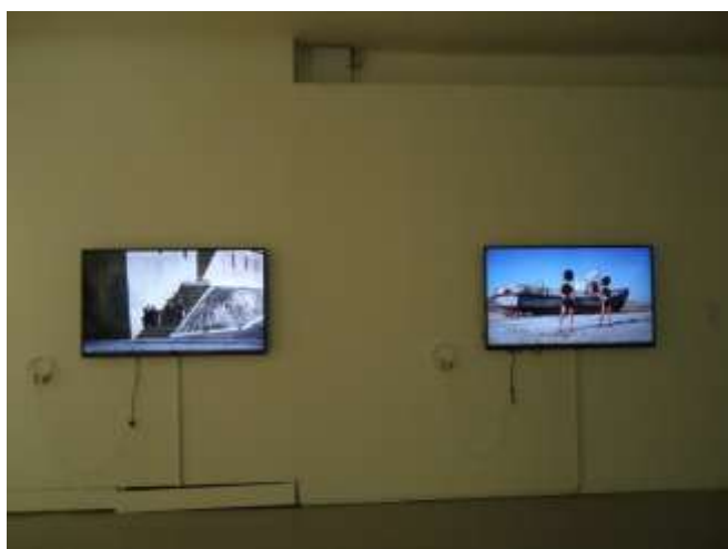
Lost to the Future 展覽現場一隅