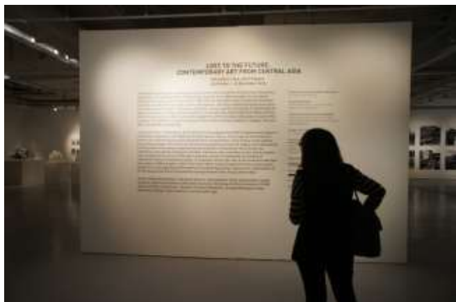
展覽 Lost to the Future 入口