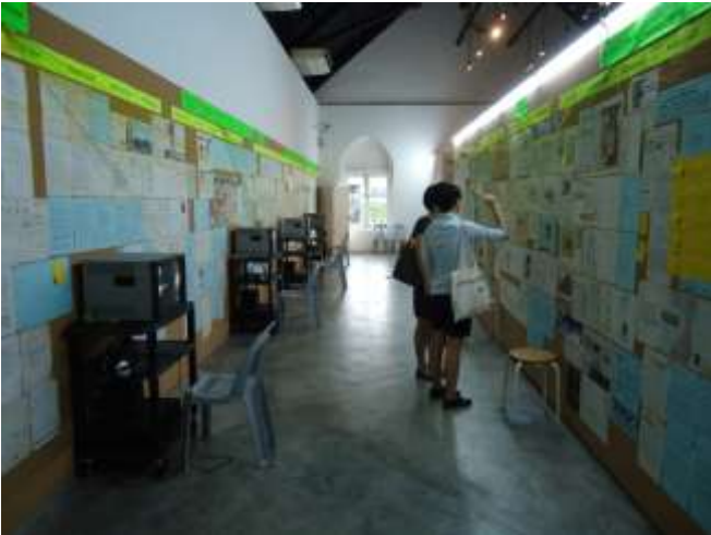
展覽 Ghost: The Body at the Turn of the Century 展出現場