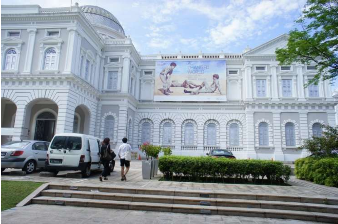
國立新加坡博物館外觀