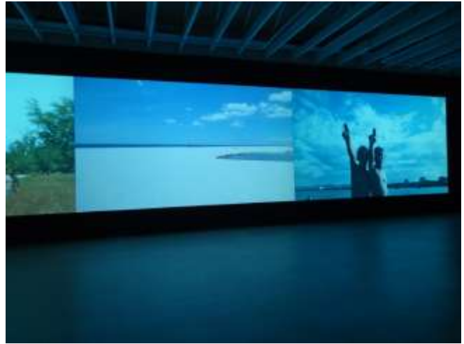
Le Brothers Into the Sea 2011