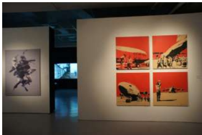
Lost to the Future 展覽現場一隅