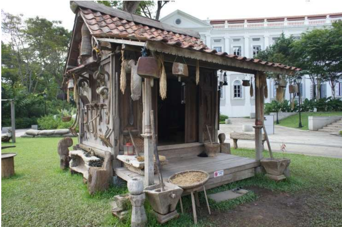
新加坡國立美術館外的戶外作品，來自印尼藝術家 ROSID 的大型裝置作品。