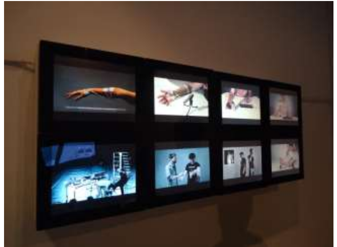
展覽 Ghost: The Body at the Turn of the Century 展出現場