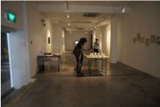
展覽 Etiquette III - Truth or Dare | FILM 展場一隅