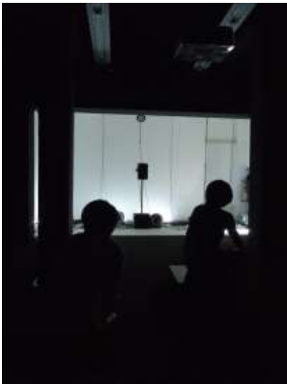
何子彥作品現場裝置