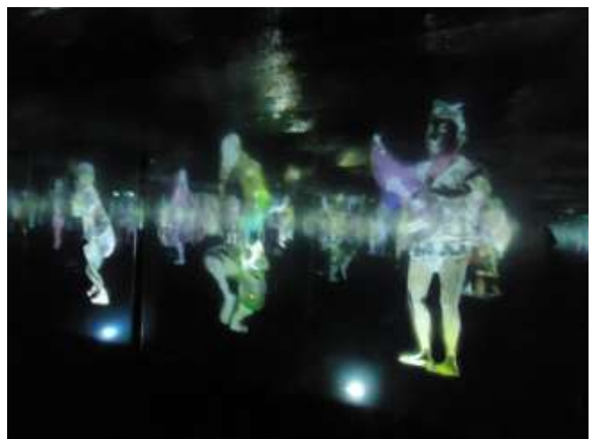
TeamLab, Peace Can Be Realised Without Order