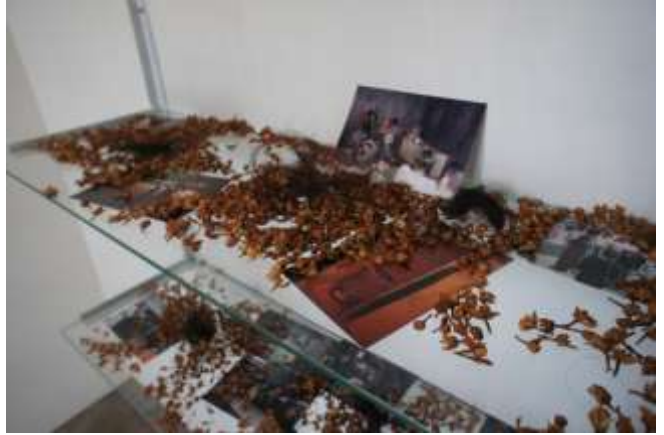
展覽 Ghost: The Body at the Turn of the Century 展出現場 (藝術家 Lee Wen 作品)