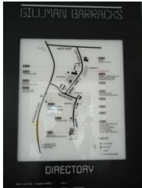
Gillman Barracks 藝術區路線圖