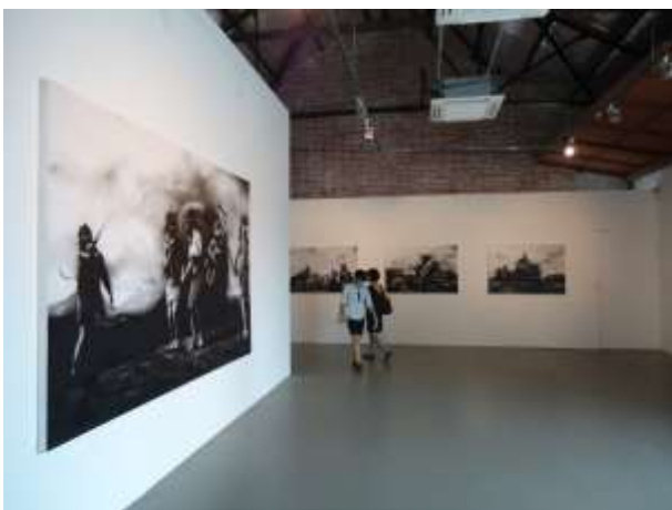
參訪 Gillman Barracks 藝術區畫廊