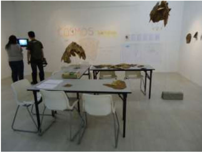
Lee Wen COSMOS, Currencies Offerings Move Over Sky 2013