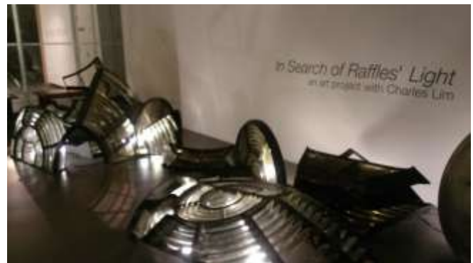
In Search of Raffles' Light :An Art Project with Charles Lim 展覽現場