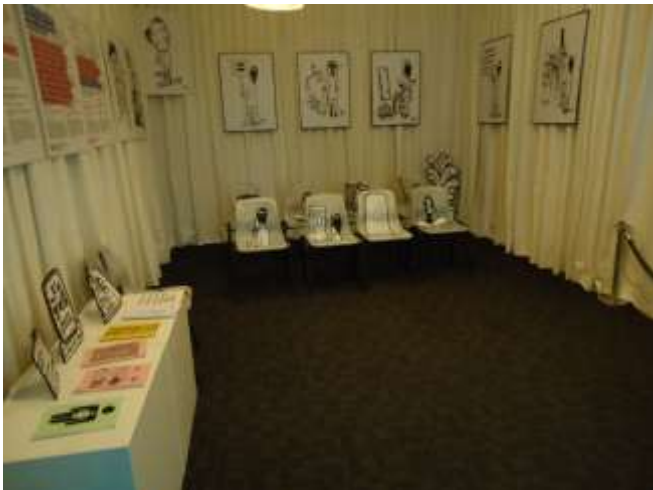
Shieko Reto Waiting Room 2013