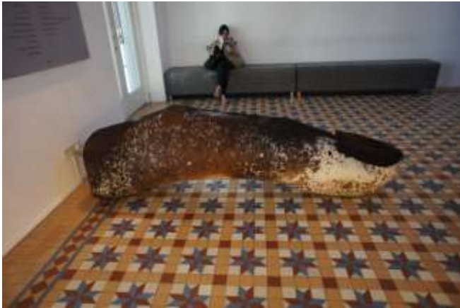
Tran Tuan Forefinger 2013