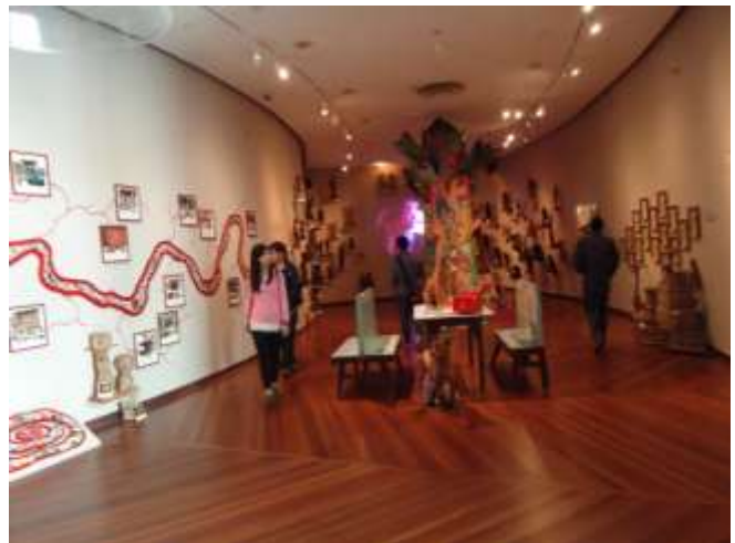
Ax(is) Art Project Tiw-tiwong: The Odds to Unends 2013