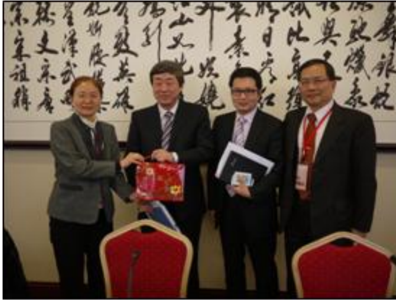
七、參訪中關村創新示範區（12月13日）