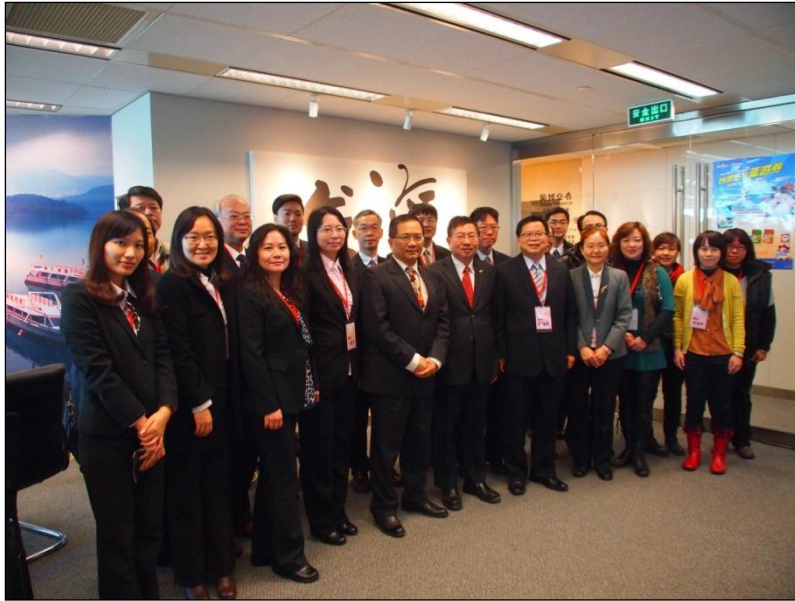
三、參訪大陸「國家行政學院」(12月11日)