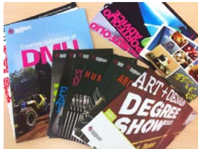
圖 13 DMU 設計學院各科系的簡介