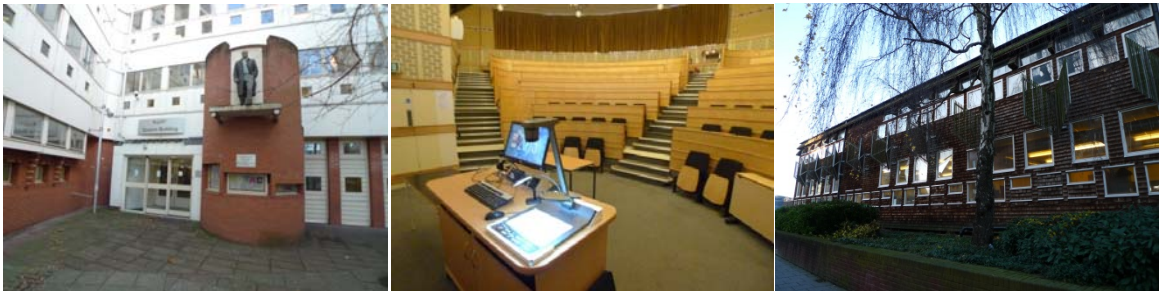
圖 8 設計學院現今院館

DMU 設計學院及科技學院，在硬體備及空間上，其多以 studio 的方式，有小至大型的電腦教室，作為一般上課及學生自由上機使用。目前 DMU 正在興建一獨立完整的藝術設人文學院館，因此目前院館為暫時性的，預計於三至六年會完成。