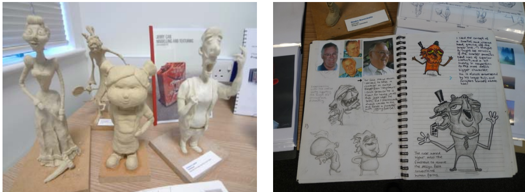
圖 10 動畫模組課程學生作品

習，每位學生則可創作出一部短動畫。而我們所採用的美式學分學制，提供了較多元的課程學習，則須注重加強課程的連接性。