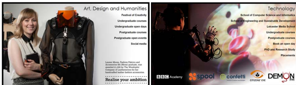
圖 2 DMU 藝術設計與人文學院(左)，科技學院(右)的形象圖

De Montfort Univ.專業學術組織自校以下，分三級單位組織 Faculty-School-Dept.(Course)，此次主要訪問 De Montfort Univ.的兩個學院 Faculty of Art, Design and Humanities 及 Faculty of Technology，以下就此二系簡介及適合本院學生就讀課程進行介紹：藝術人文及設計學院(Faculty of Art, Design and Humanities)，學院下有建築學院、藝術學院、設計學院、人文學院及時尚與紡織學院，其中設計學院主要有產品設計系、室內設計系及與工藝設計系，與本院學系相當，適合本院相關學系學生就讀。科技學院(Faculty of Technology)，此學院下除了工程相關學系外，成立了社會媒體學院(school of Social Media)，其中動畫系、遊戲藝術系及平面設計與多媒體系皆屬社會媒體學院，與本院學系相當，適合本院相關學系學生就讀(圖 2)。