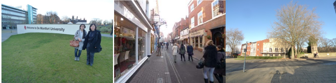
圖 12 訪問 DMU 交換學生及校園環境

De Montfort Univ.位於英國 Leicester 市，無台灣直飛班機，轉機班次也較少，因此大多由台灣直飛或轉機英國倫敦，距離國都倫敦約 160 公里，可以巴士、快速火車或計程車的方式到達 Leicester，以快速火車僅須 1 小時 20 分的車程，相當便利，且生活費需求約倫敦一半，學生較可負擔，交換或就讀學生學生也可便於至大都市倫敦博物館等地參觀學習。(圖 12)