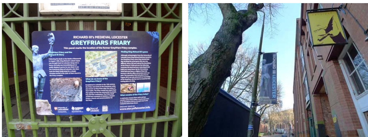
圖 1 Leicester 市以理查三世事件的城市行銷廣告

英格蘭國王理查三世（Richard III，1452-1485），1485 年御駕親征，討伐叛軍，結果被叛軍所殺，草草埋葬在英格蘭中部的 Leicester。一直到 2012 年被英國的「理查三世粉絲會」成員自稱夢到埋骨處試掘，果然挖到六百年前人類骨骸，2013 年經 DNA 鑑定確定是理查三世。本次到訪期間，正值 Leicester 挖到六百年前英格蘭國王骨骸之新聞潮，是這座小城近兩年最重大的事件，全城到處都有理查三世的廣告布條，準備以他做小城的觀光訴求，增加國際知名度(圖 1)。