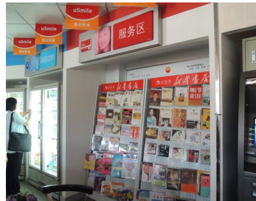
(與新華書店配合銷售)