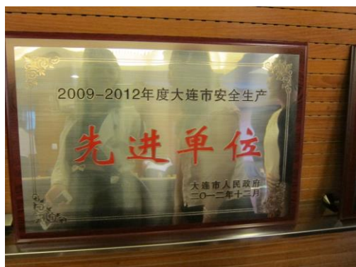
(大連安全生產先進單位)