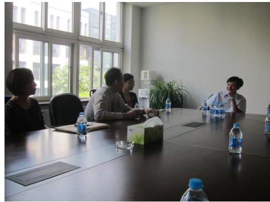
(薛主任說明參訪目的及進行本校簡介)