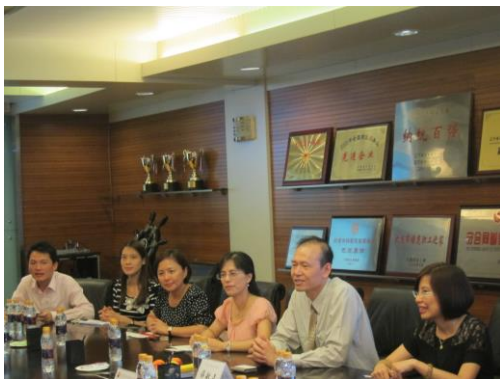
(我校參訪師生陣容)