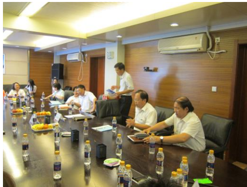
(準備帶領參觀 uSmile 昆崙好客便利商店)

中國石油非油品業務在 2012 年繼續保持良好發展態勢，業務規模增長明顯，盈利能力進一步增強。全年收入和利潤同比分別增長 25% 和 30%， “uSmile 昆侖好客” 便利店總數達到 1.3 萬個。