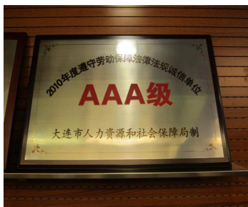
(勞動法規誠信單位 AAA 級)