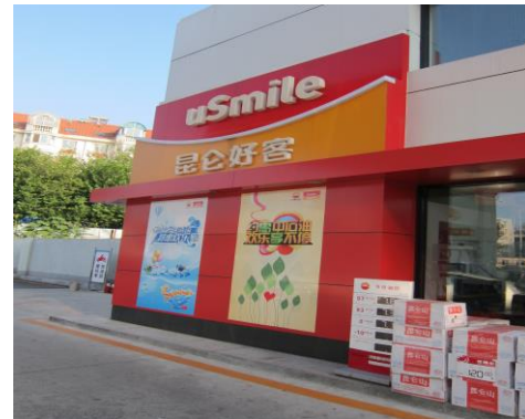
(uSmile 昆崙好客便利商店)