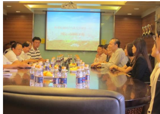
(薛主任向中石油表達給予參訪致謝之意)