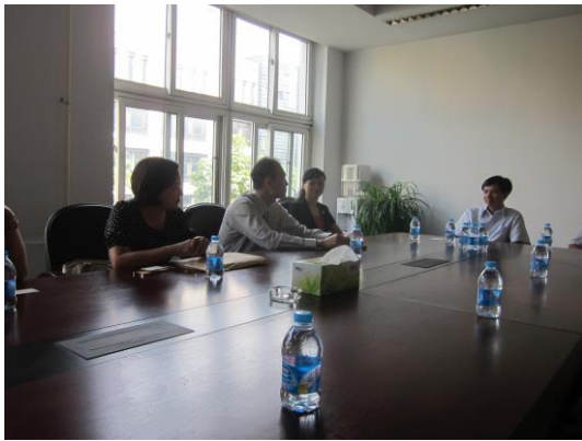
(聆聽方紅星院長致歡迎詞及進行學校及學院簡介)