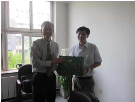
(致贈臺灣紀念品-茶葉)