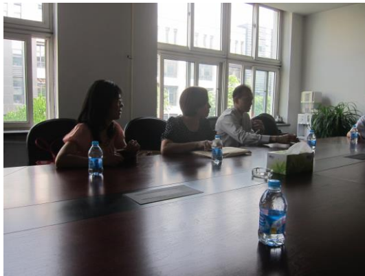
(臺北大學-會計系) (薛教授、王教授及朱教授) (右起)