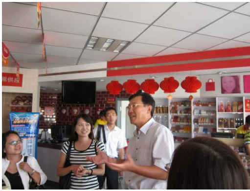
(劉副總介紹導覽複合式商店)