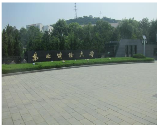
(東北財經大學校門口)

會計學院目前是東北財經大學最大的教學單位，招生規模在中國同類學科名列前茅。該校會計學院畢業生品質高，深受企業、四大會計師事務所及地方各級政府部門等用人單位的喜愛，並在企業、會計師事務所及政府部門擔任重要職務佔有多數。