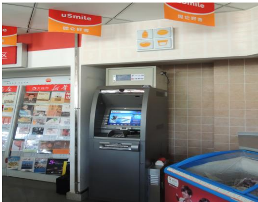
(結合交通銀行 ATM 提款機)