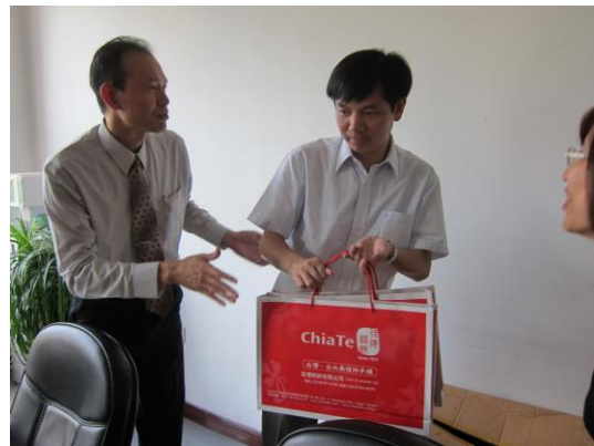
(致贈臺灣紀念品-鳳梨酥)