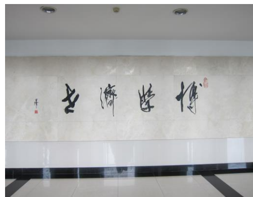
(東北財經大學校訓)