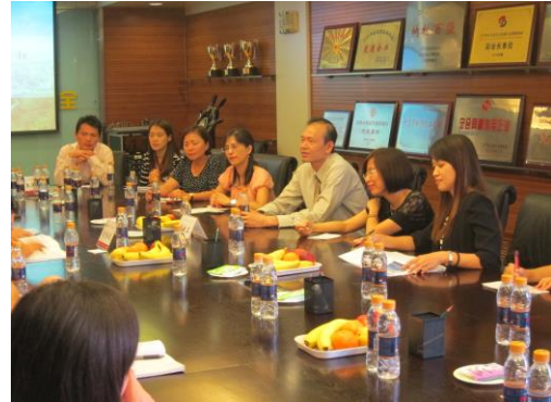
(我校參訪師生陣容)