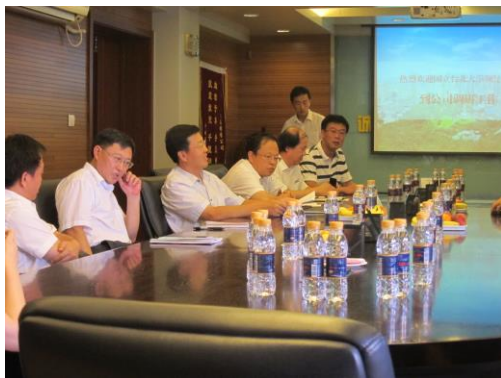
(準備大型會議室招待)