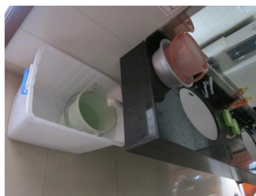
(洗手水回收再利用)