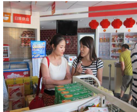
(uSmile 昆崙好客便利商店)