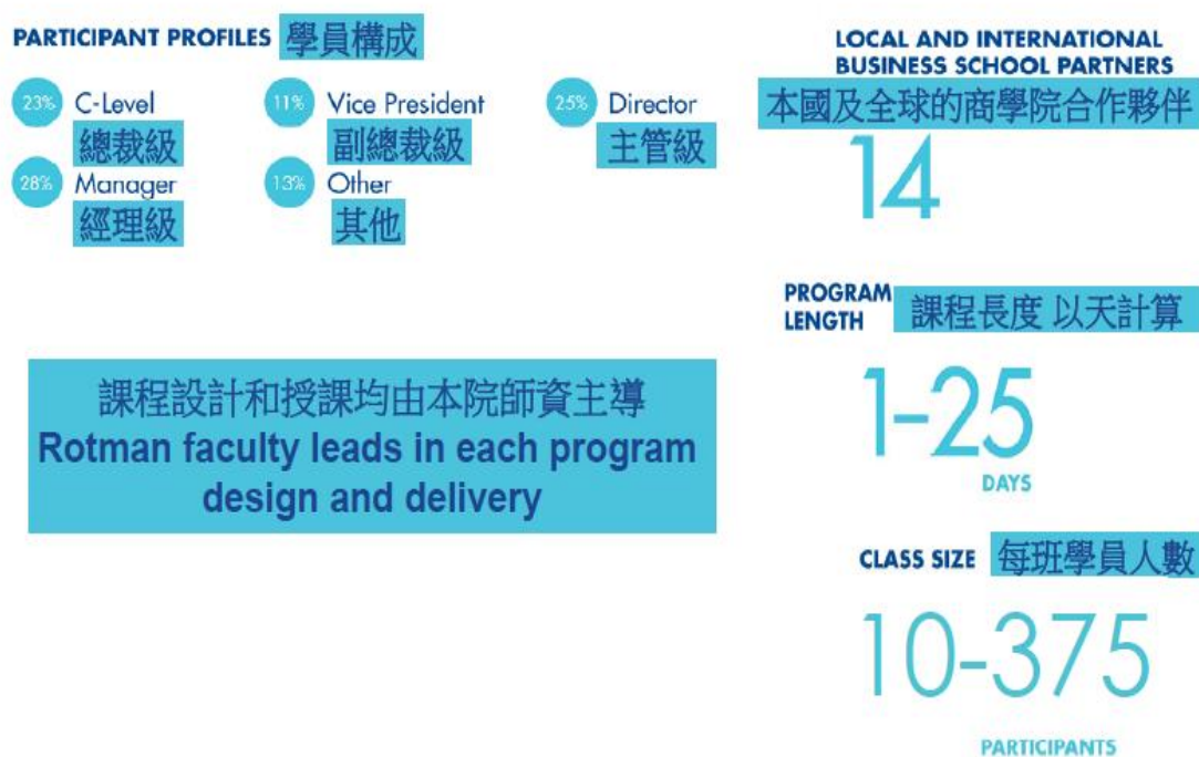
圖 2-1 羅特曼管理學院與全球合作圖示

應承擔的風險，爰有效運用成熟的企業治理做法，提高組織應變能力。領導力課程部分，該學院為高階管理人員提供知識框架和實用性解決問題之工具，要超越自己，並提高應變能力和影響力在策略性人力資源管理課程部分，該學院著重於對人力資源部門的價值賦予新的定義，認為該部門是降低與重要人力資本和組織流程相關風險的重要內部職能的部門並將人力資源部門定位成一個說明組織實現策略目標的重要組成。該學院表示，於 2012 至 2013 年已訓練 3 千 660 名來自全球高階管理人員。