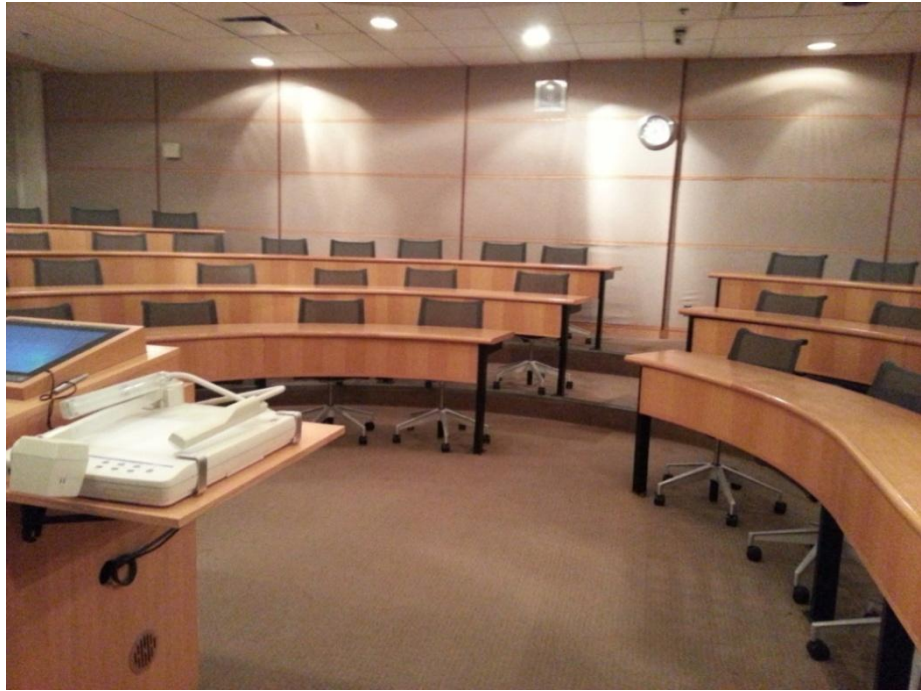
羅特曼管理學院訓練教室一角