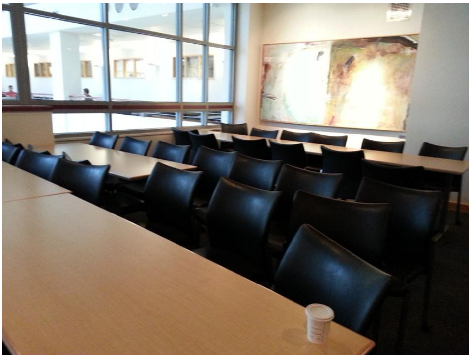
羅特曼管理學院訓練教室一角