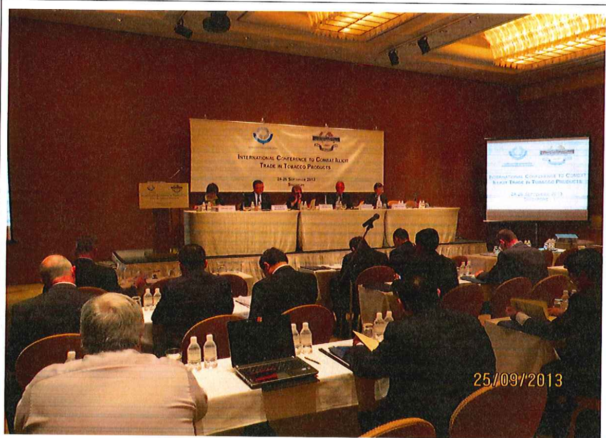
會議進行時，會場一角視景（一）。