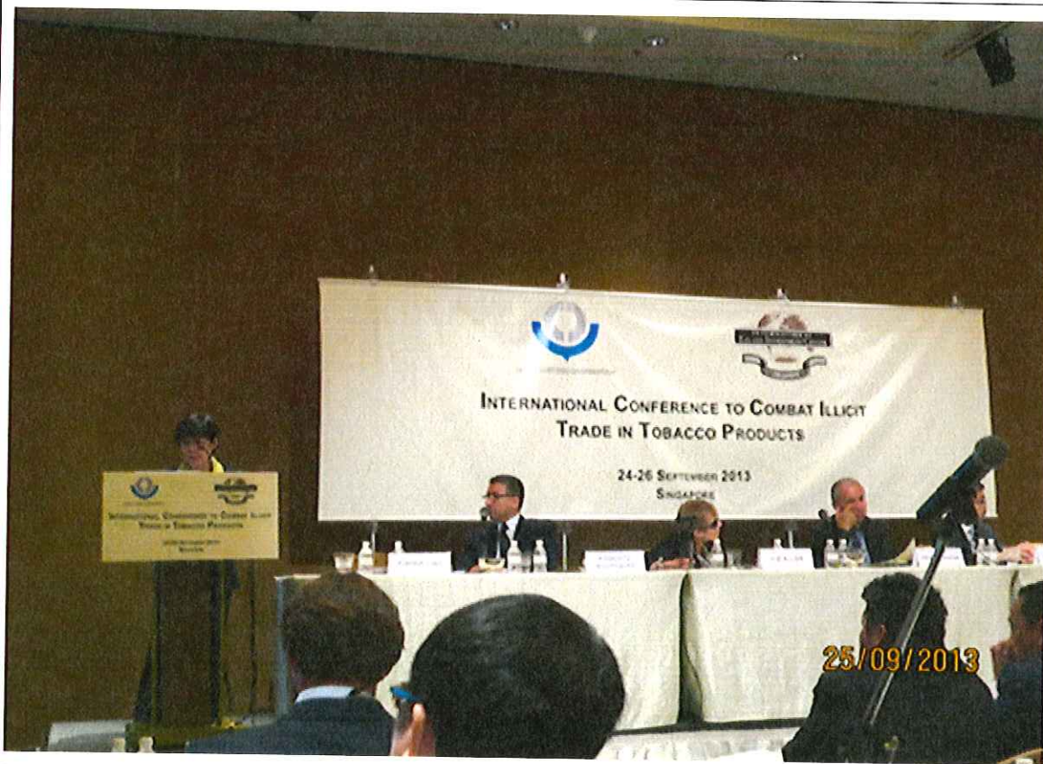
本署凌署長簡報我國打擊非法菸品之情形。