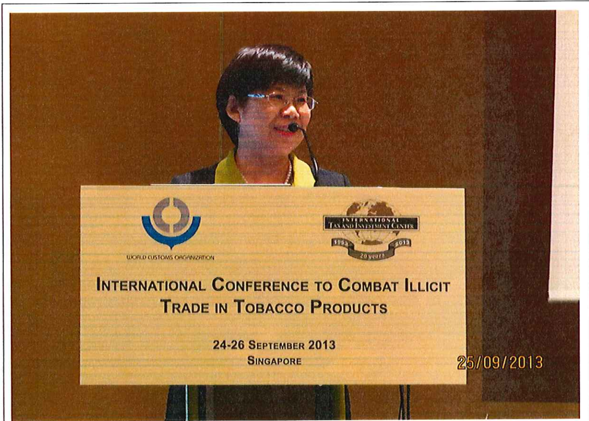
本署凌署長進行簡報。