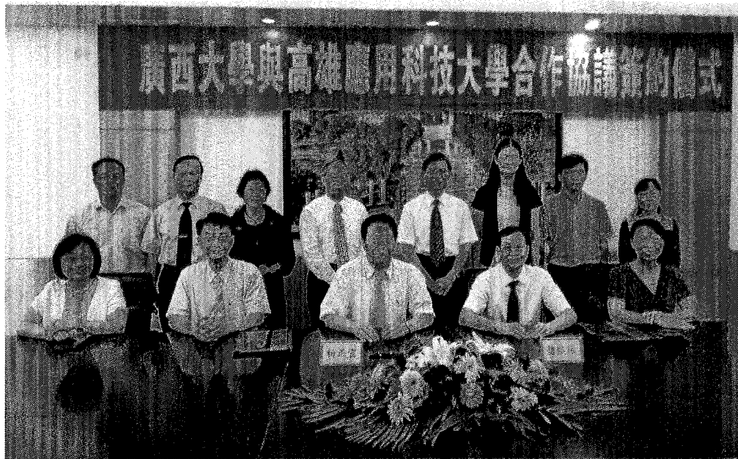
照片 4-國立高雄應用科技大學楊正宏校長與廣西大學趙豔林校長簽署合作備忘錄(MOU)(前排右二廣西大學趙豔林校長、右三楊正宏校長、左一戴貞德主任、左二洪冠明院長，後排右三處長、右四王正和主任)