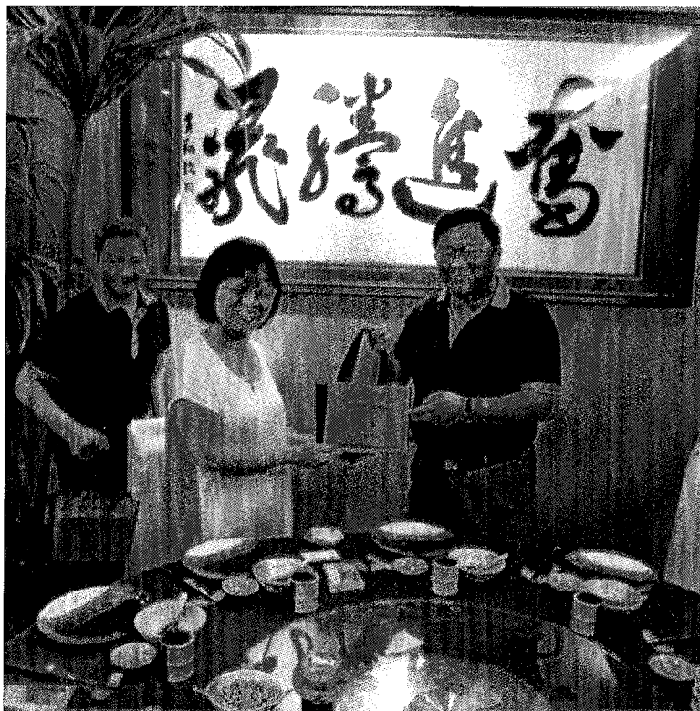
照片 2-參訪廣西大學藝術學院(左一處長、左二戴貞德主任、左三校長)