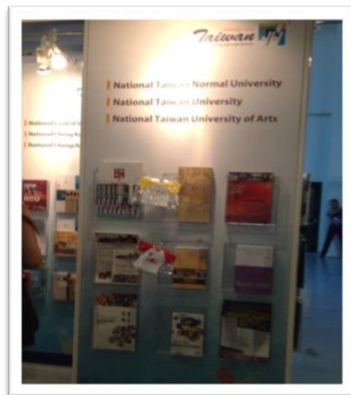
圖五【臺灣攤位文宣擺設樣式】