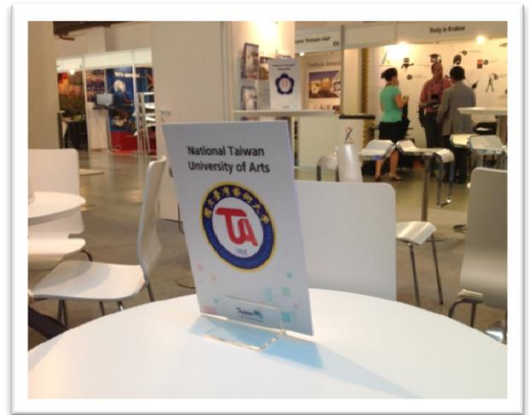
圖十【本校值班桌牌】