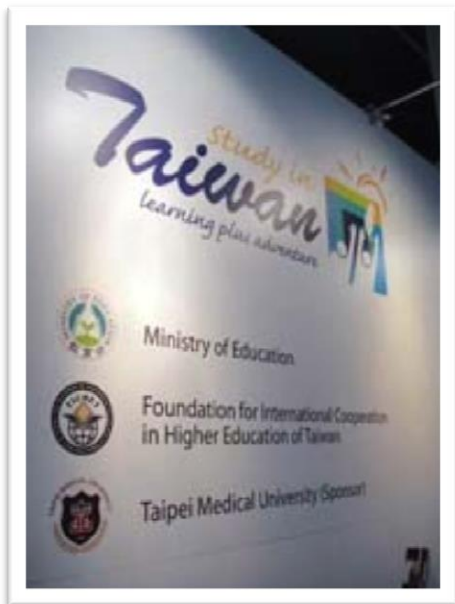
圖四【Study in Taiwan 展版】