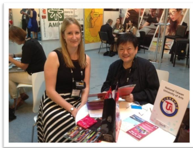
圖十二 【與英國北安普頓大代表合影】

The University of Northampton (北安普頓大學) 是英國的一所公立大學，位於英格蘭的中南部，是一個有著二十多萬人口的繁榮且寧靜的小城市，以友善和安全著稱。同時，北安普頓是英國的歷史名城，文化底蘊深厚，譽有玫瑰之郡之稱。該校現有 Park 和 Avenue 兩個校區，學校提供將近一百種大學部及研究所學位，包含藝術、人文科學、工程、科技、建築、管理、商業、應用科學和保健等科目。該校國際事物相關單位人員曾於參展前蒞臨本校參訪，並有意進一步與本校商討未來建立合作關係之可能性；因此，於本次會談中，本校特別強調有關我方交換生計畫所提供的課程及服務，如：基礎中文以及全英語授課課程、接機服務、臺灣文化體驗活動、住宿安排等等。該校代表亦對此表示肯定，雙方會談順利，希冀未來可順利開啟雙方交流合作，為本校欲申請至英國交流之師生增添多一項選擇。