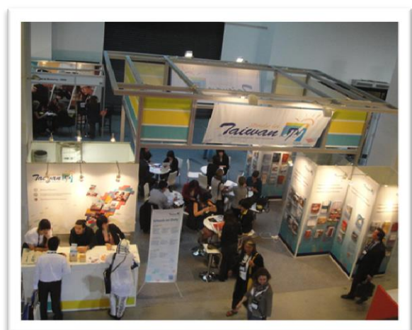
圖七【臺灣攤位整體外觀】