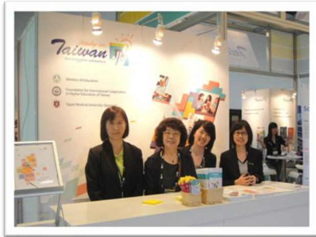
圖三為【Study in Taiwan 展場接待處】