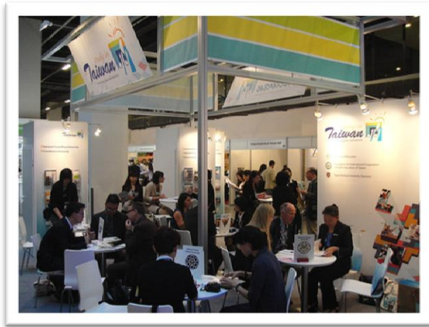
圖九【臺灣攤位會談區】