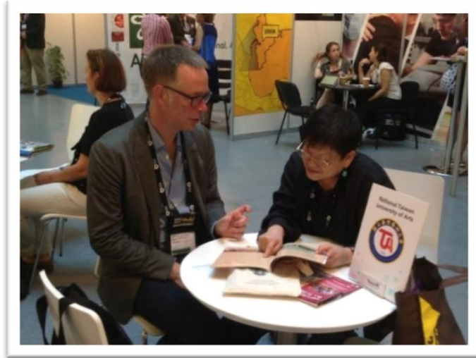
圖十三【與荷蘭烏特勒支應用大學代表合影】

Utrecht (烏特勒支應用大學) 成立於 1867 年，是荷蘭第三大應用類公立大學，學校位於荷蘭的第三大城市烏特勒支市，具有悠久的歷史和深厚的文化內涵。校內專業課程如：國際商業與經濟、商業管理、企業發展規規劃、國際媒體與交流、產品發展、軟體工程等。會談代表為該校傳播與多媒體設計教授，對於本校傳播與設計學院提供之專業課程深感興趣，本校表示將於活動結束後，持續積極與該校國際事務相關單位人員接洽，進行討論並交換意見，期盼未來能有雙向合作機會。雙方相談甚歡，並交換文宣相關資料供雙方參考及推廣，針對未來可合作努力的事項進行佈局。