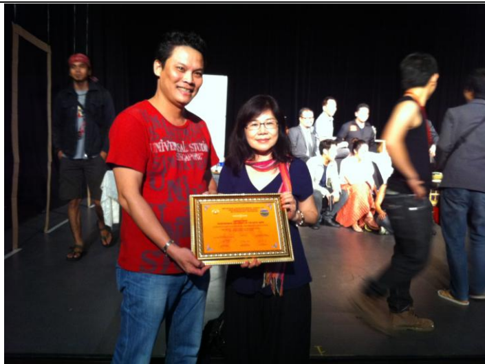
主辦單位頒贈證書