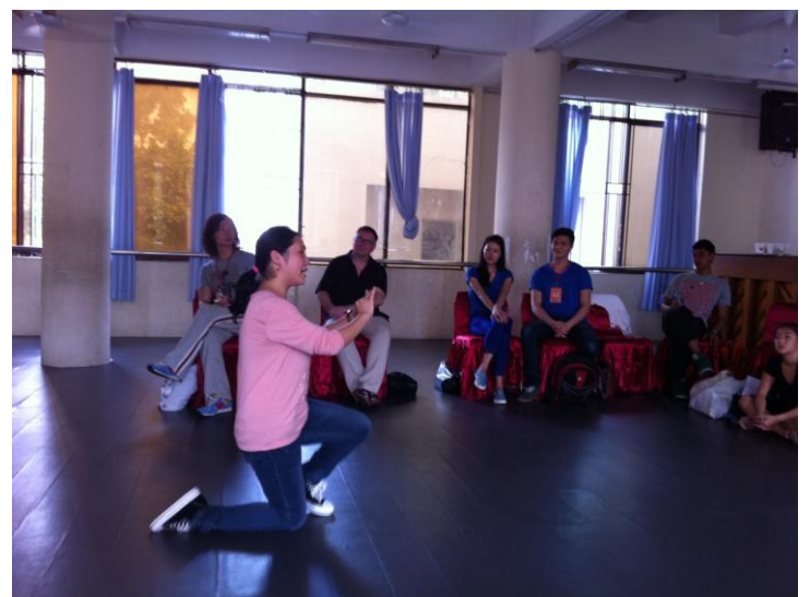
京劇工作坊 (special skill) -2