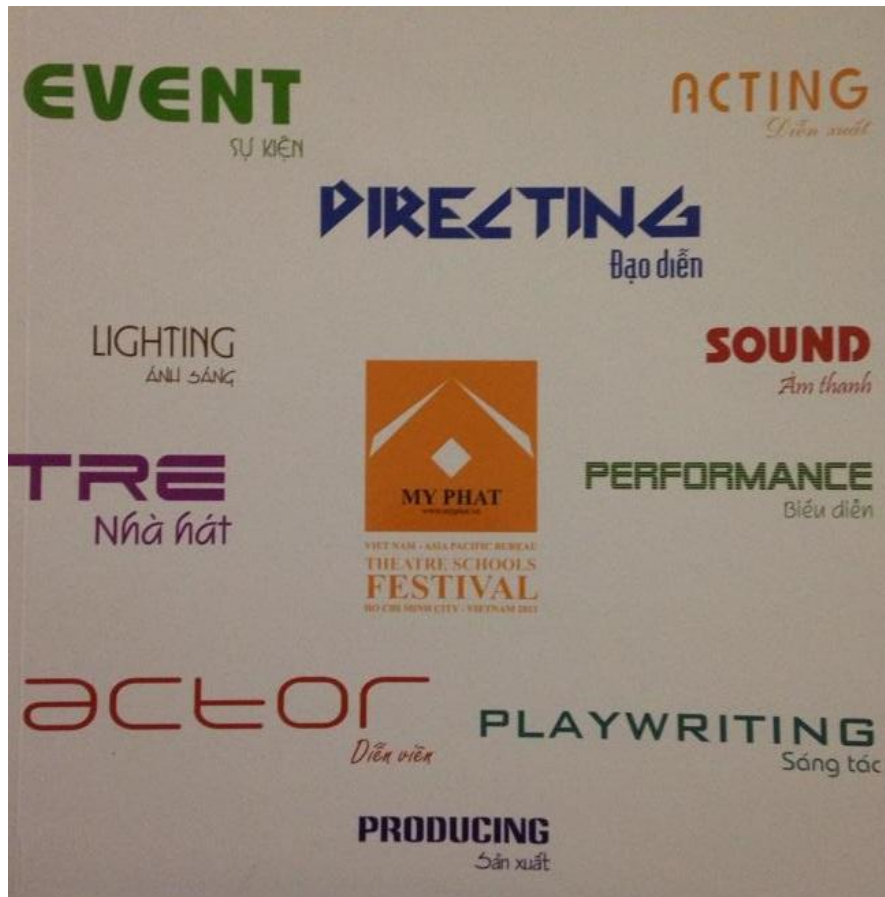
2013 亞太局各院校戲劇／劇場／舞蹈藝術節-節目冊