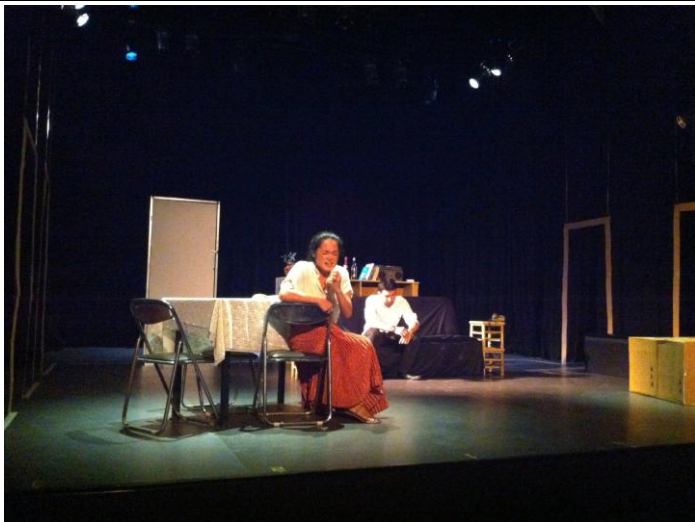
Anteneo Fine Arts 演出