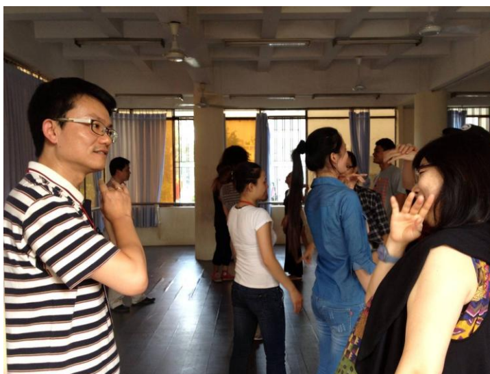
京劇工作坊 (special skill) -1