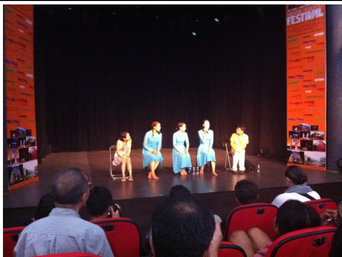
k-Arts Q & A