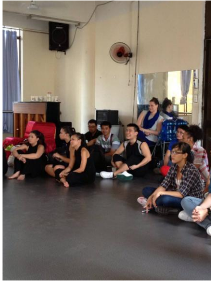
京劇工作坊 (special skill) -3