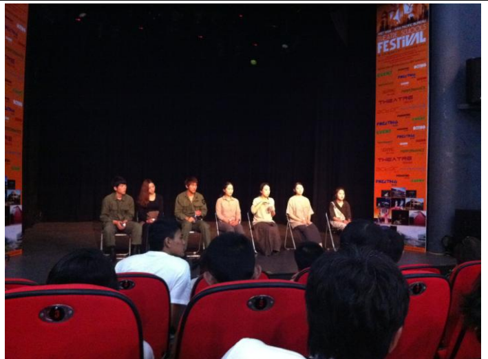
Hoseo University Q & A