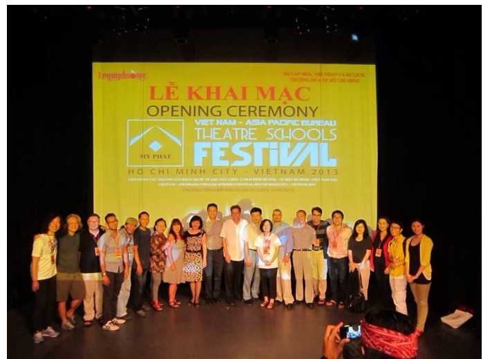
Opening Ceremony 與會國上台合影