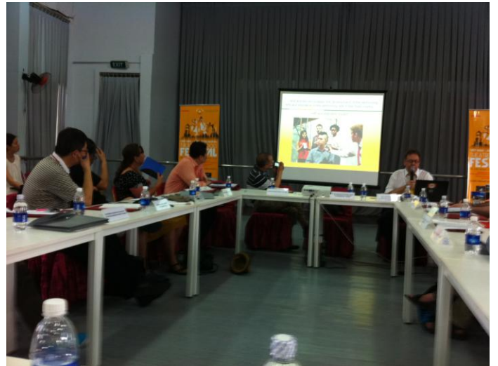
APB Directors Meeting-2