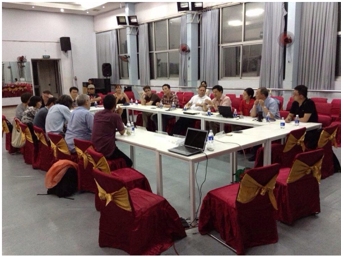
APB Directors Meeting-1