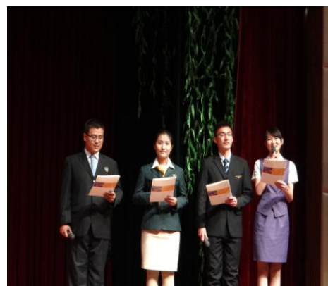
校慶活動-學生感恩之詞