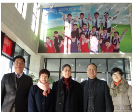
參觀航空專業相關設備