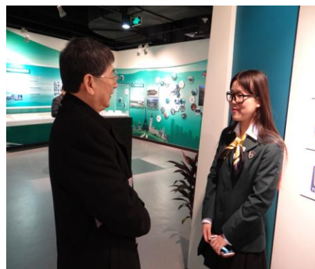
容校長與浙江旅院學生交談