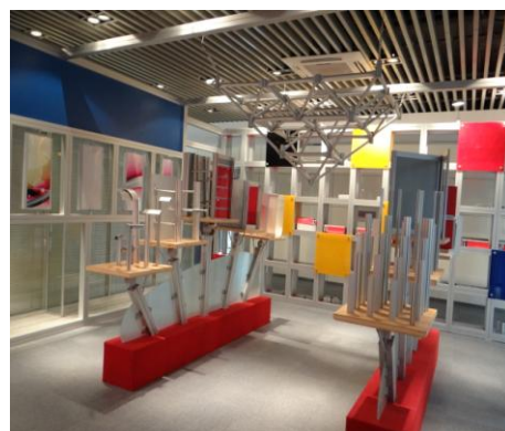
參觀會展行銷專業相關設備