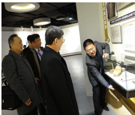
參觀學校設置之旅遊博物館