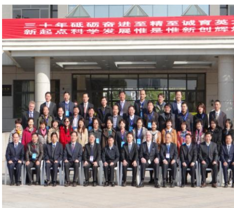
校慶活動-全部與會貴賓大合影