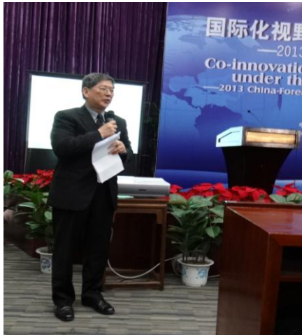
容校長進行專題演講