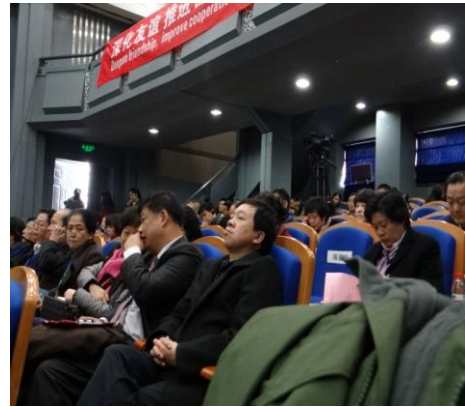
校慶演講活動會場