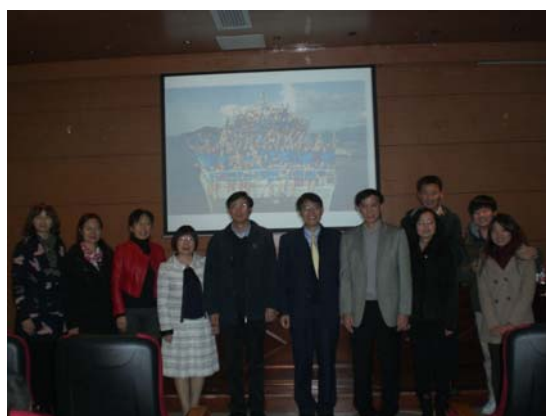
高校長會後和廣州體院師長合照