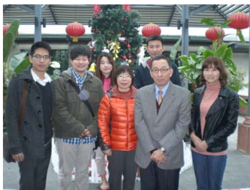
與本校交換生合影