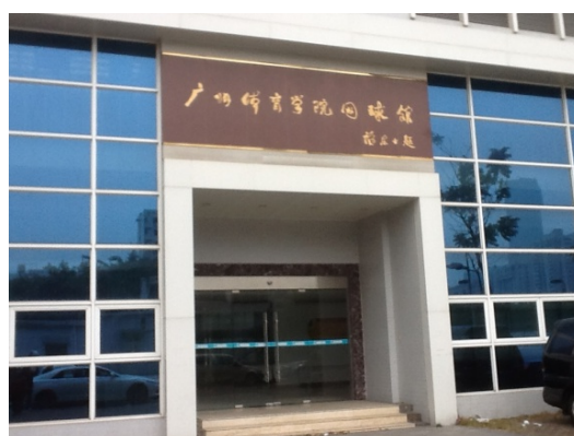
廣州體院室內網球館