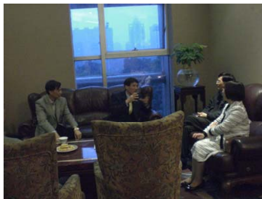
高校長和廣州體院師長交換意見