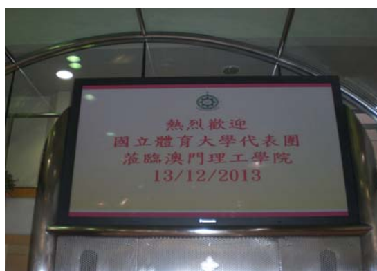
澳門理工學院校門