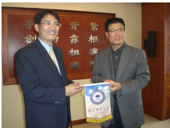
高校長贈送本校校旗給李校長