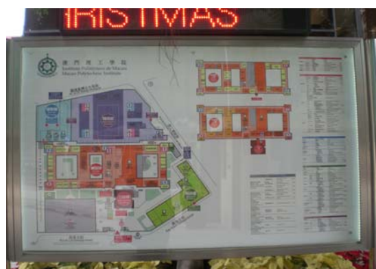
澳門理工學院校園平面圖