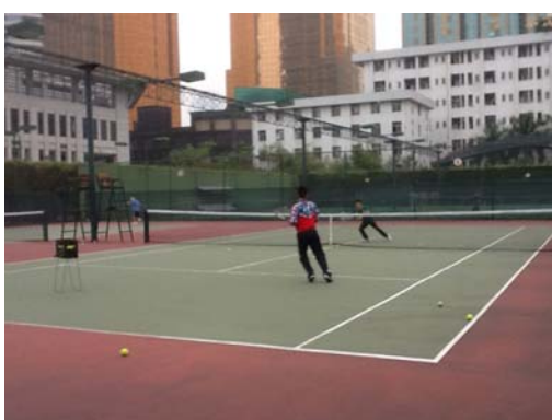
廣州體院室外網球場