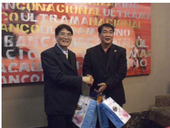
高校長致贈紀念品給陳校長