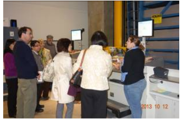
參觀舊金山州立大學 ASRS 圖書自動存取系統