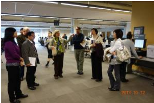
舊金山州立大學圖書館館長親自導覽該館