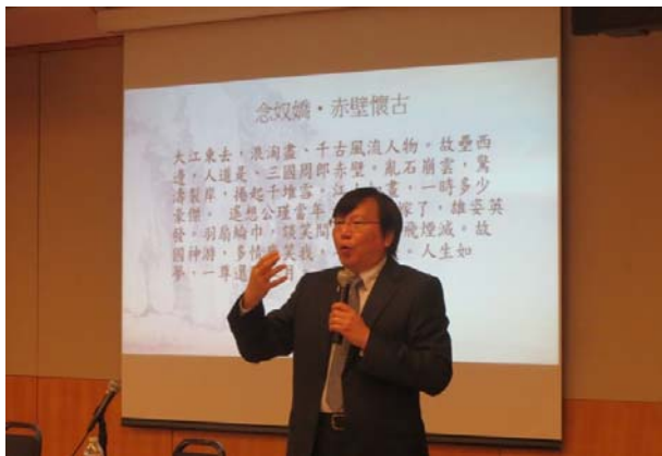
「臺灣漢學講座」邀請劉少雄教授在舊金山公共圖書館演講