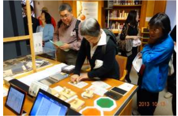
舊金山民眾踴躍參觀「千古風流人物：蘇東坡」古籍文獻展，於展場使用「東坡笠屐圖」紀念章