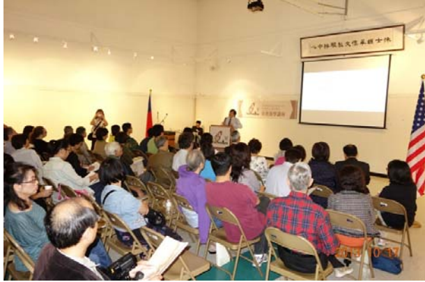
「臺灣漢學講座」在休士頓僑教中心吸引大批民眾參加