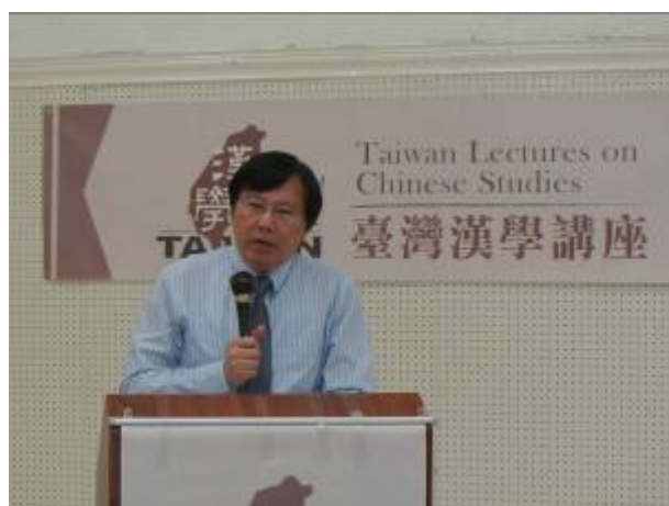
劉少雄教授於休士頓僑教中心演講蘇東坡