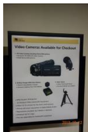
舊金山州立大學圖書館借用錄影機的規定公告