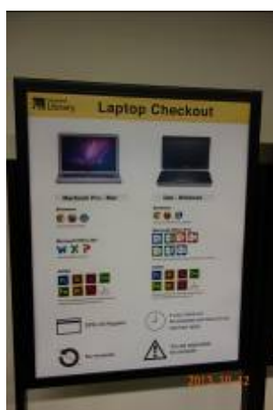
舊金山州立大學圖書館借用個人電腦的規定公告