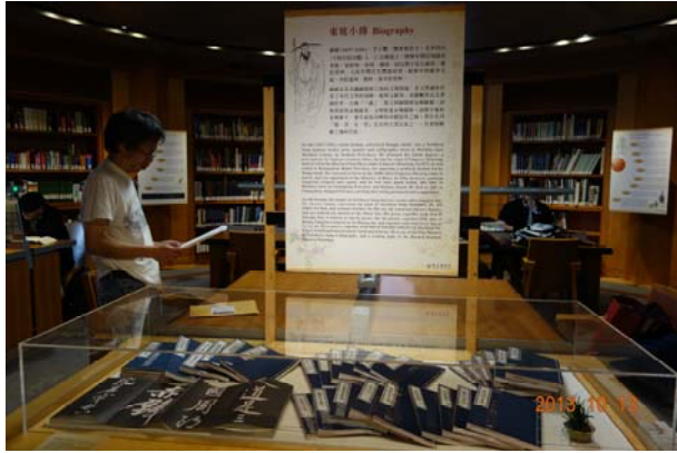
蘇東坡展覽舊金山公共圖書館展場一隅