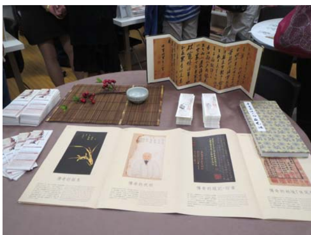
蘇東坡展覽休士頓僑教中心展場一隅