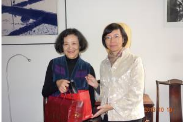
拜訪江青女士（左）洽談手稿捐贈本館事宜