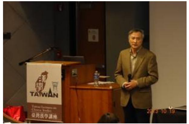
「臺灣漢學講座」邀請黃啓江教授於羅格斯大學演講