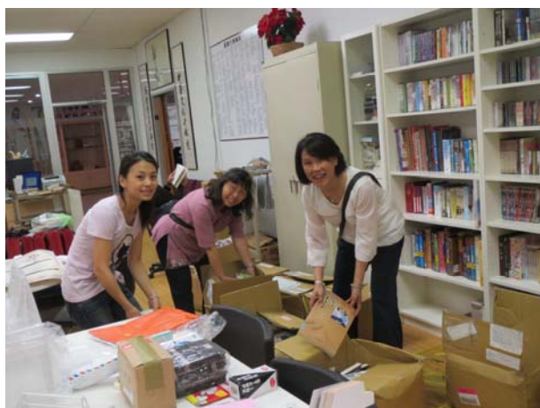
休士頓僑教中心布置「千古風流人物：蘇東坡」古籍文獻展展場