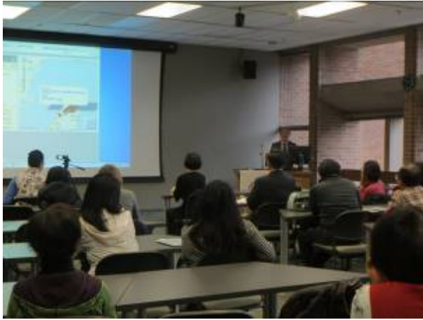
「臺灣漢學講座」邀請廖炳惠教授在西雅圖華盛頓大學演講