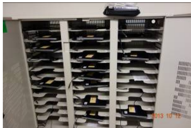
舊金山州立大學圖書館可以借出 WIN 版及 APPLE 版的個人電腦