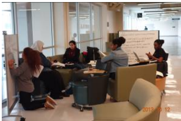
舊金山州立大學圖書館以讀者為尊的開放討論空間