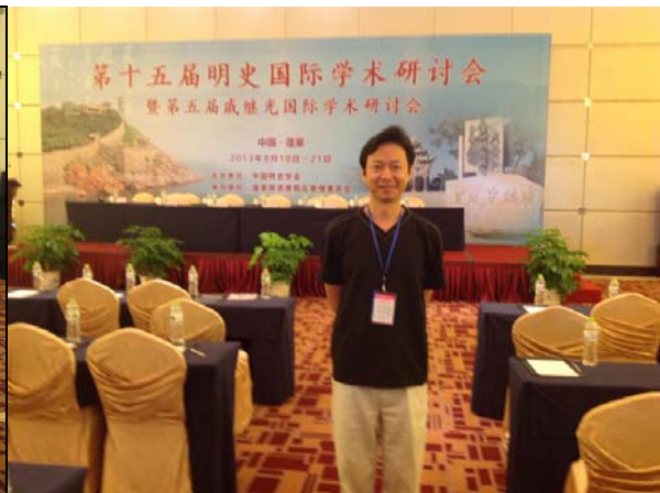
圖四 閉幕會後留影