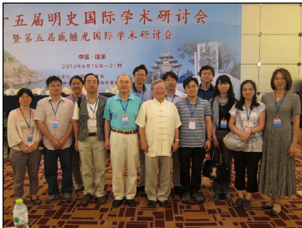
圖三 閉幕會後臺灣與韓國學人合影