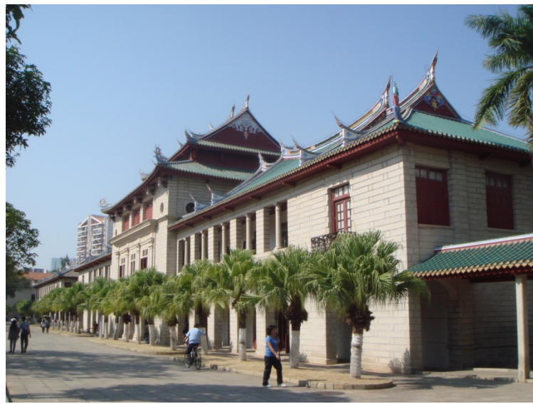
廈門大學科學藝術中心