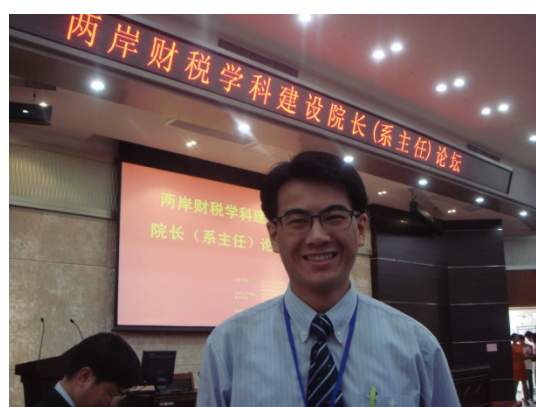
兩岸財稅學科建設院長暨系主任論壇