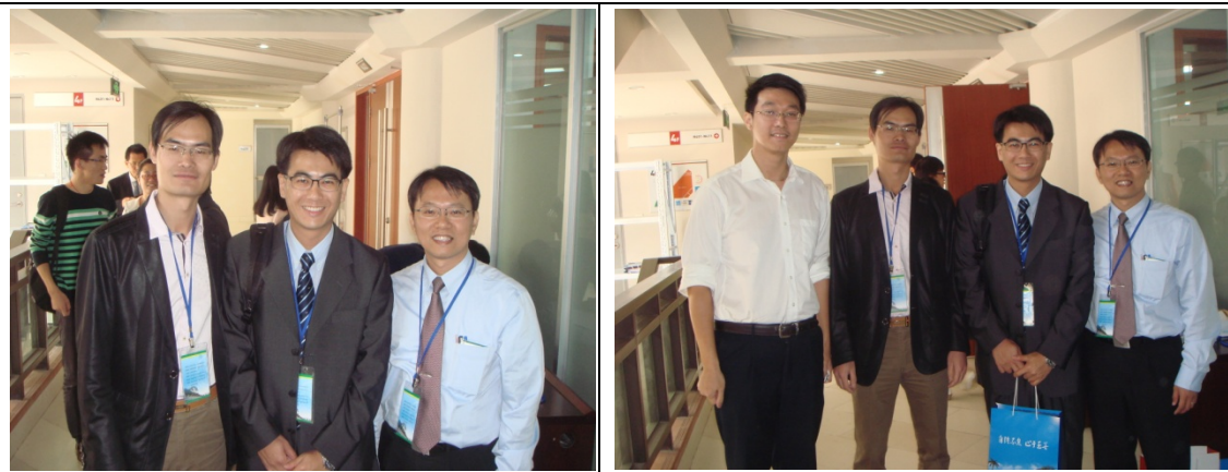
與廈門大學師生合影（左圖左為財政系教師；右圖左為財政系博士生）

下午則與廈門大學財政系教師及博士生進行雙邊會談，分享海峽兩岸財稅系的教學與授課經驗。