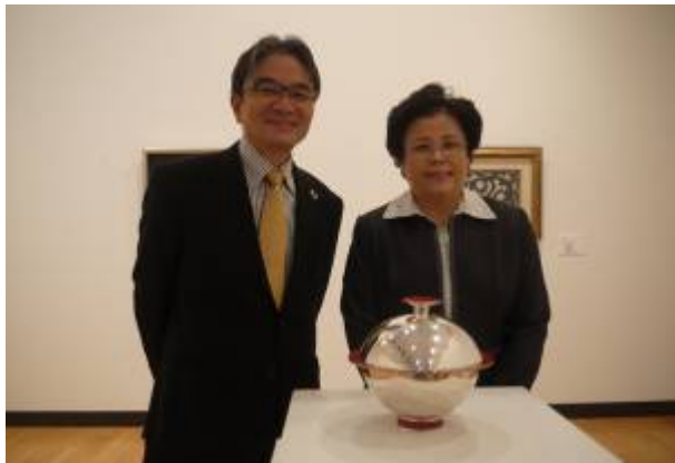
王老師與東藝大宮田校長於作品前合影