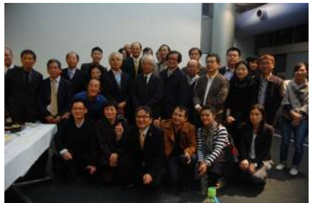
開幕式現場臺日參展藝術家合影