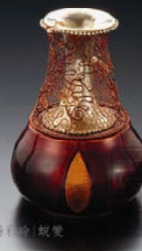
楊彩玲 蝶雙 Studio