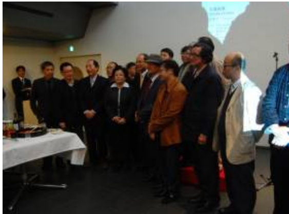
臺灣參展者開幕式合影