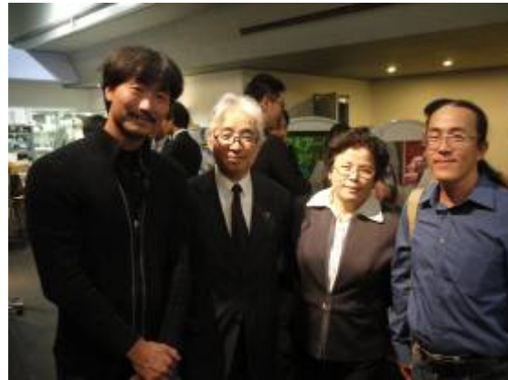
與漆藝科教授三田村有純合影