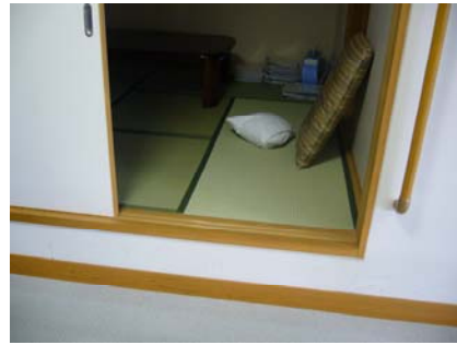
日托中心裡的和室，訓練老人上下