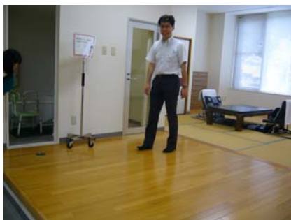
在宅看護實驗室(和室設計)