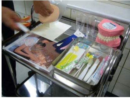
口腔清潔之模型及用品