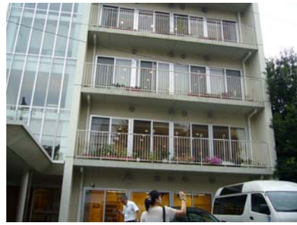
外觀類似住家公寓