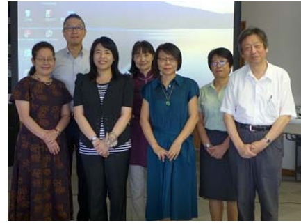
與濱本學部長等人合影