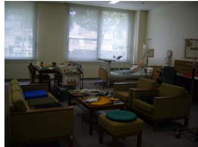
仿居家陳設的在宅看護實驗室