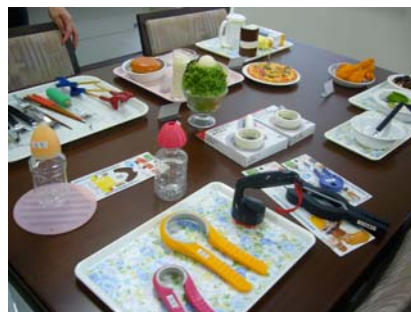
進食用輔具直接擺設於餐桌上