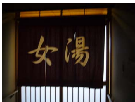
機構重視泡澡，設有男湯及女湯