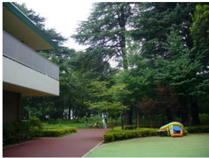
緊鄰社區公園，旁為員工托兒所