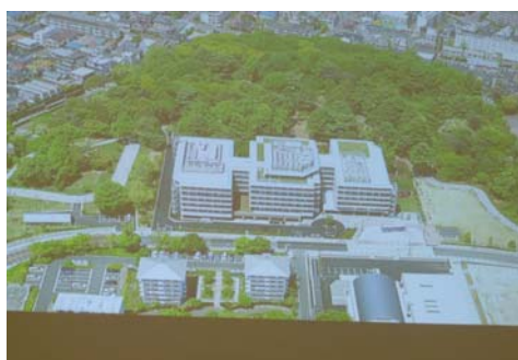
位於山坡上、視野良好

江古田之森並附設有許多支持高齡者在宅生活的單位：(1)居宅介護支援事務所：協助介護保險的認定及申請；(2)介護服務：與台灣長期照護體系中的居家服務類似，由介護士提供居家家事、沐浴、食事等生活協助的服務；及(3)日間照護。