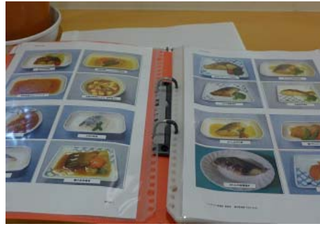
餐點以照片呈現，方便老人點餐