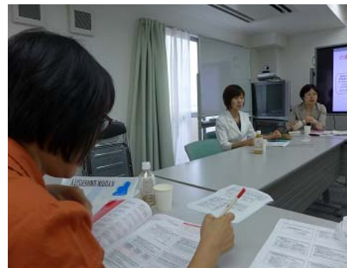
大今教授說明介護支援專門員的養成教育