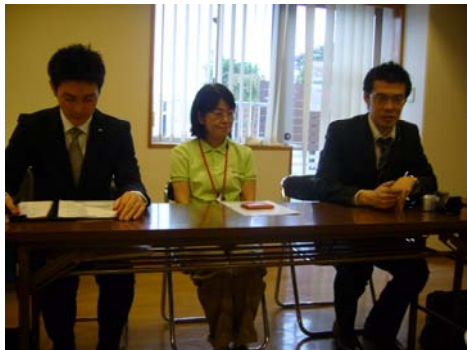
投身老人照護行列的年輕人