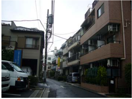
隱身於巷道裡的 Nichii Care Center