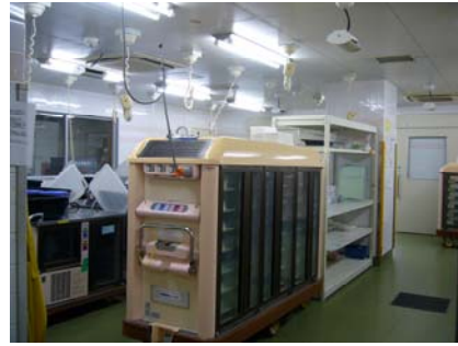
可插電保溫之餐車