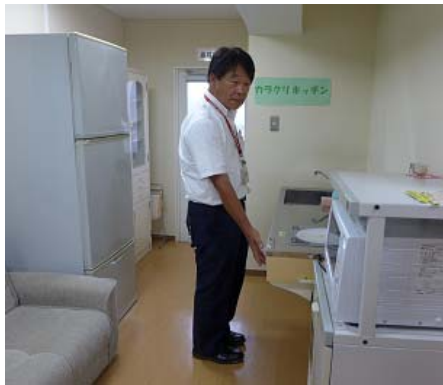
居家護理實驗室廚房設備