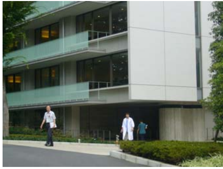
杏林大學附設醫院