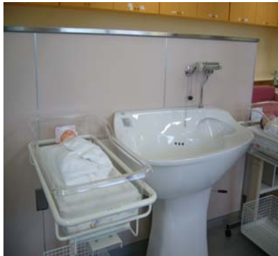
嬰兒洗澡盆(不是不鏽鋼)