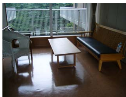
交誼廳(同一樓層有多個小型交誼廳)