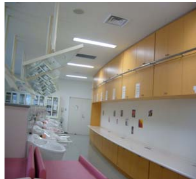
上方有鏡子方便洗澡時檢查嬰兒