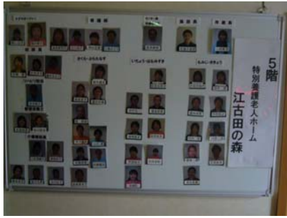
張貼每樓層工作人員照片姓名