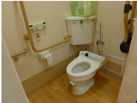
馬桶前方的開口方便取出阻塞物