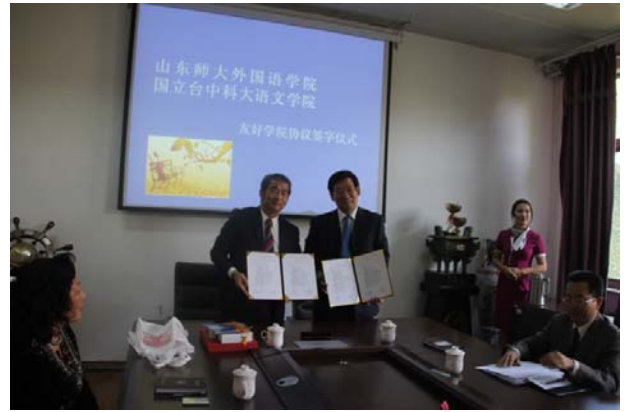
本院院長與山東師大外國語學院院長簽約後 持協議書合影