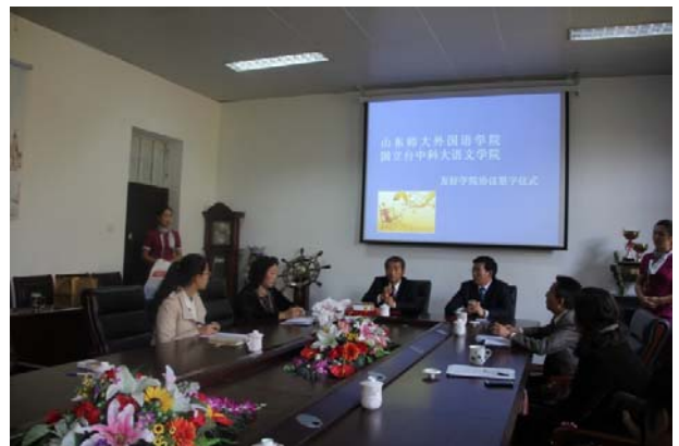
本院院長與山東師大外國語學院院長簽約後 與書記、副院長、教授與學生代表座談