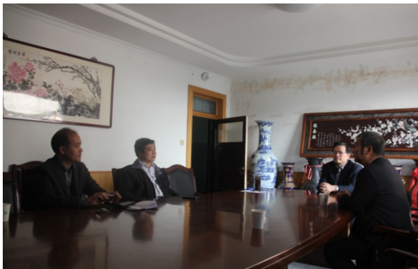
與山東師大文學院院長、書記、副院長座談