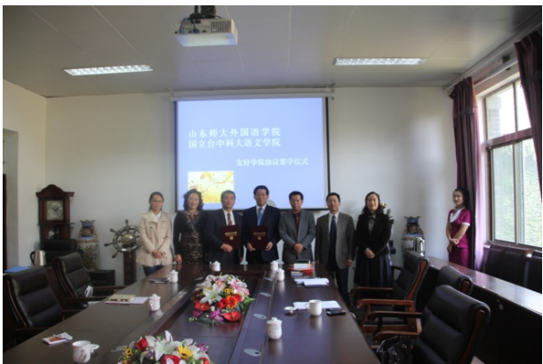
本院院長與山東師大外國語學院院長簽約後 與書記、副院長、教授與學生代表、本院同 仁合影