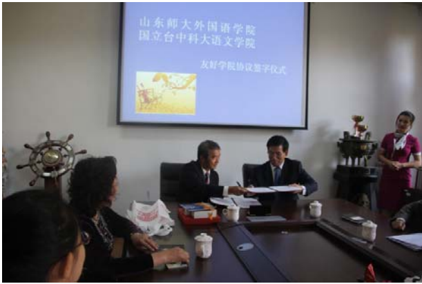
本院院長與山東師大外國語學院院長簽約後 交換協議書