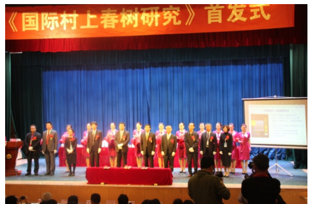
出席《國際村上春樹研究》首發式剪綵