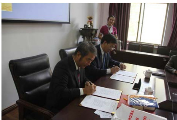
本院院長與山東師大外國語學院院長簽約