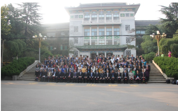
出席「第一屆日本學高端論壇國際學術研 討會」與會學者團體照