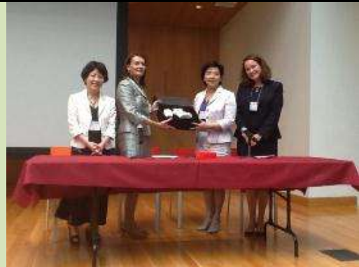
圖 16. 臺灣與美國馬里蘭州簽訂合作備忘錄互贈禮物