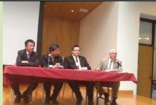
圖 18. 臺灣-馬里蘭高等教育會議會場合影