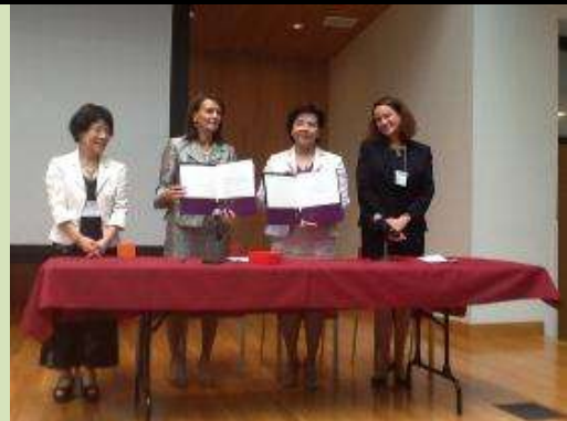
圖 14. 臺灣與美國馬里蘭州簽訂合作備忘錄