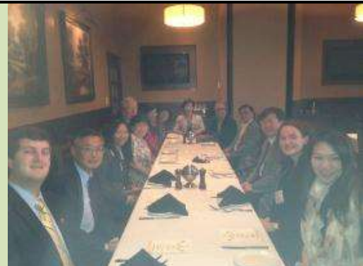
圖 24. 團隊成員於臺灣-馬里蘭高等教育會議晚宴合影