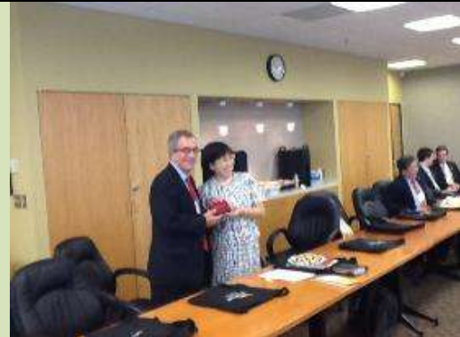
圖 22. 南大校長(右)致贈馬里蘭高等教育委員會南大紀念品