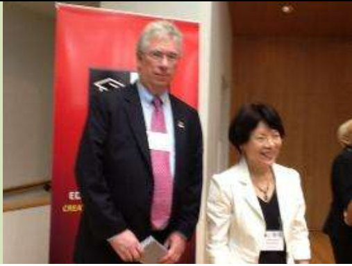
圖 11. 教育部次長(右)與馬里蘭高等教育委員會委員合影