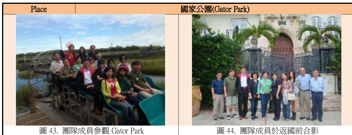
表 11. 2013 年 8 月 27 日相關照片

後前往邁阿密機場，經紐約轉機回桃園機場，結束此次參訪行程。表11為活動相關照片。