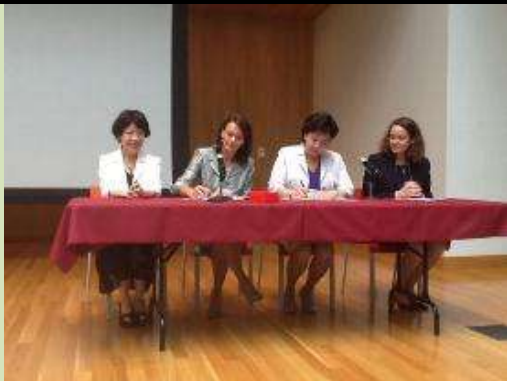
圖 13. 臺灣與美國馬里蘭州簽訂合作備忘錄