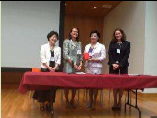
圖 15. 臺灣與美國馬里蘭州簽訂合作備忘錄互贈禮物