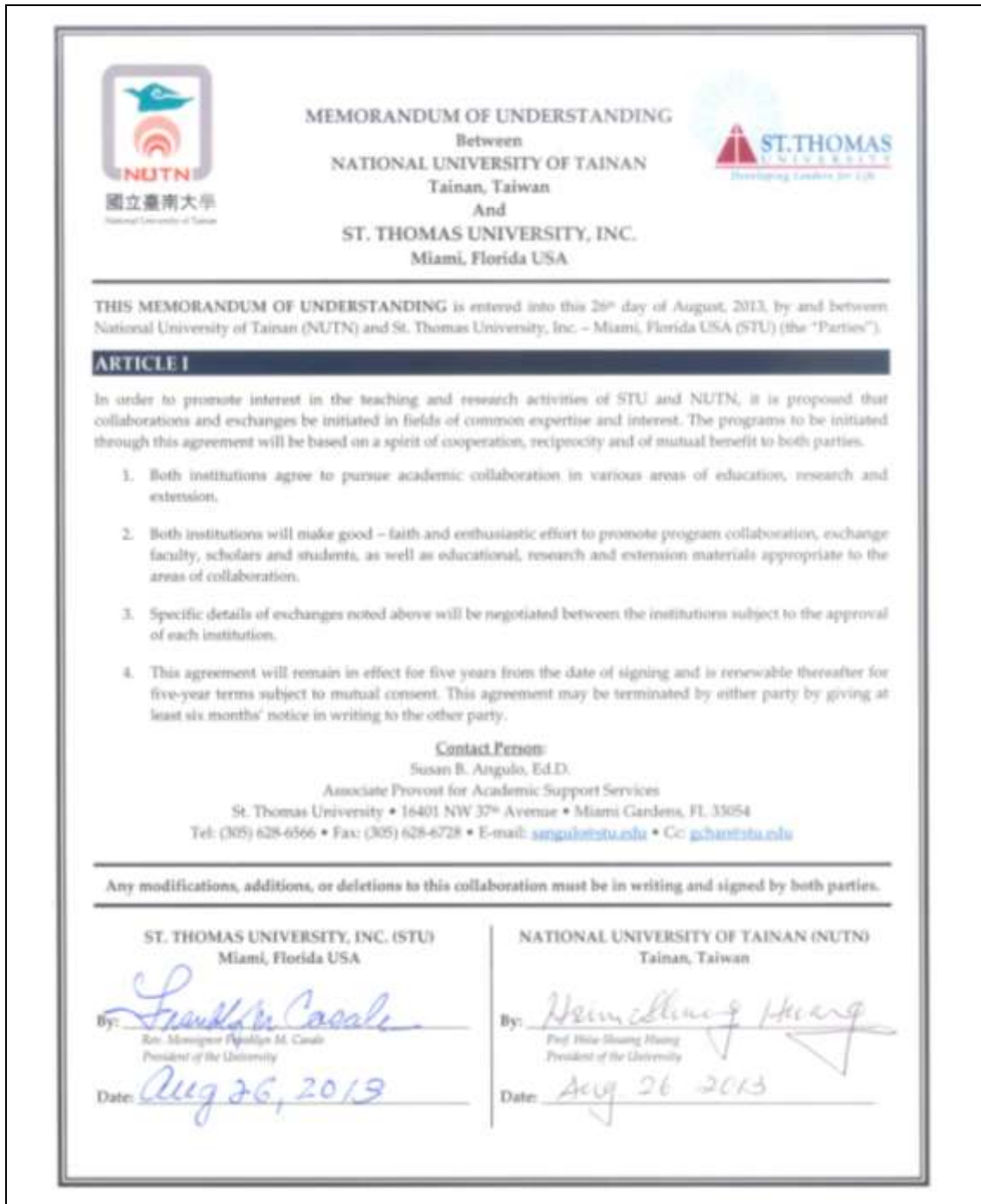
表 9. 合作備忘錄(國立臺南大學 vs. 美國聖湯瑪士大學)