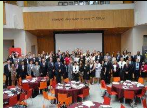
圖 26. 團隊成員於臺灣-馬里蘭高等教育會議會場大合影