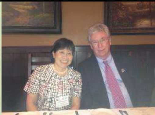
圖 23. 南大校長(左)與馬里蘭高等教育委員會成員合影