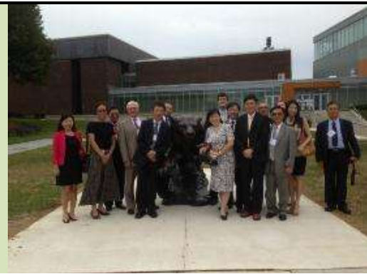
圖 20. 團隊成員參訪陶森大學