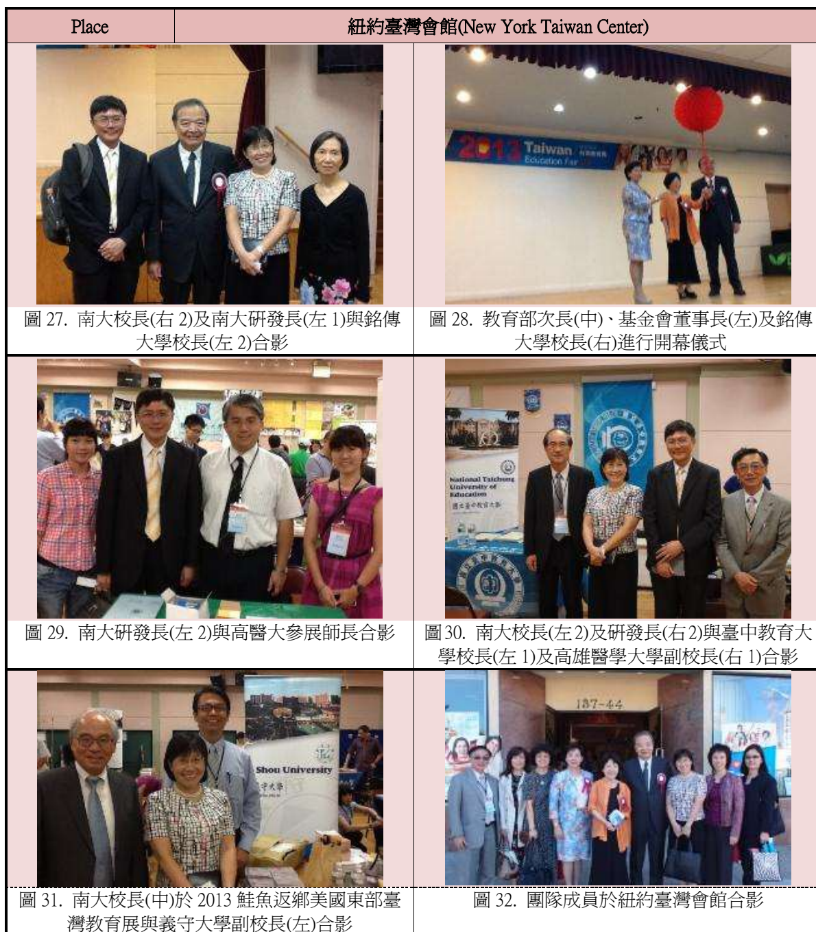
表 6. 2013 年 8 月 24 日相關照片

所舉辦的鮭魚返鄉活動，參與人數與去年相較，有明顯落差，此一現象可做為明年南大參與相關國際教育展之評估指標之一。表6為2013年8月24日相關活動照片。