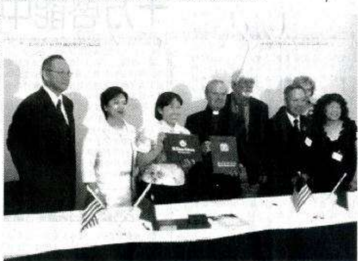
台南大學與美國聖湯瑪士大學簽訂國際交流協定。

換學生機會；羅恩羅賓遜副校長表示，將特別提供交換名額給南大校長赴美國聖湯瑪士大學擔任研究教學工作，期望能夠深化兩校實質師生國際學術交流。