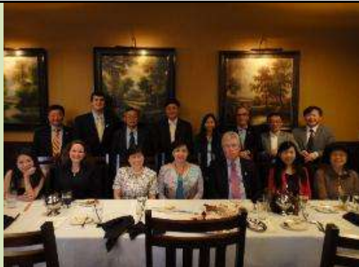
圖 25. 團隊成員於臺灣-馬里蘭高等教育會議晚宴合影