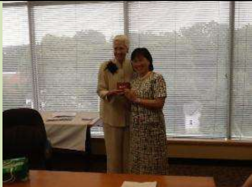
圖 21. 南大校長(右)致贈陶森大學校長(左)南大紀念品