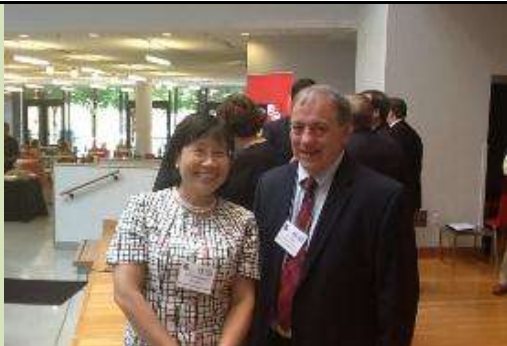
圖 17. 南大校長(右)於臺灣-馬里蘭高等教育會議會場合影