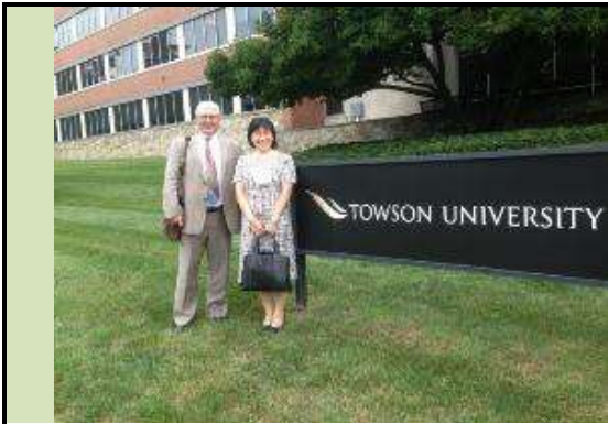
圖 19. 南大校長(右)與陶森大學教授合影