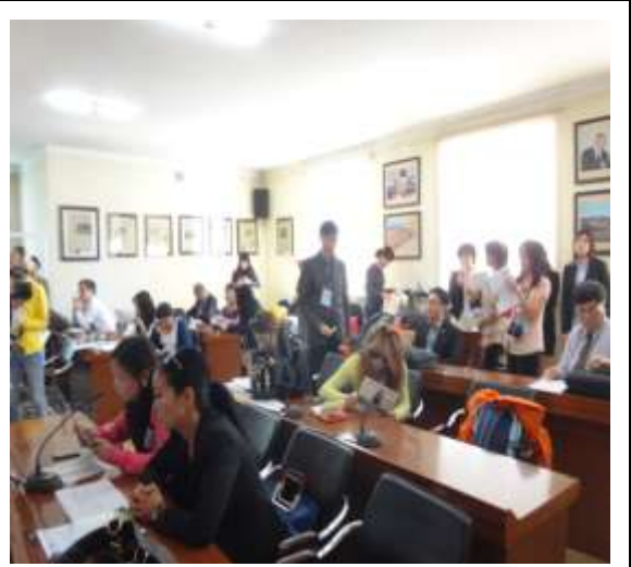
圖 4. 蒞臨教育展採訪之記者群