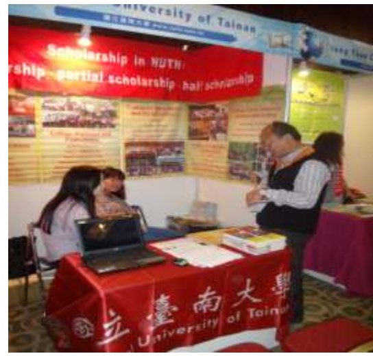
圖 14.本校展場之樣貌