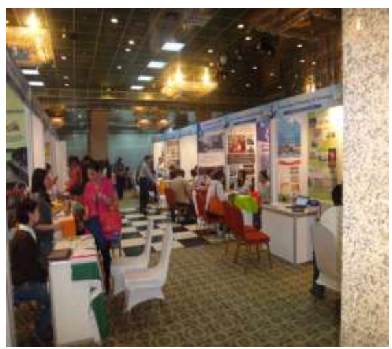
圖 10.教育展會場各校攤位擺設