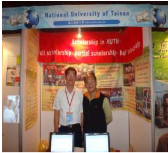
圖 13.本校展場之樣貌