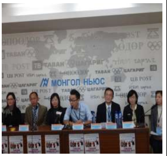
圖 2. 臺灣教育展記者會情況