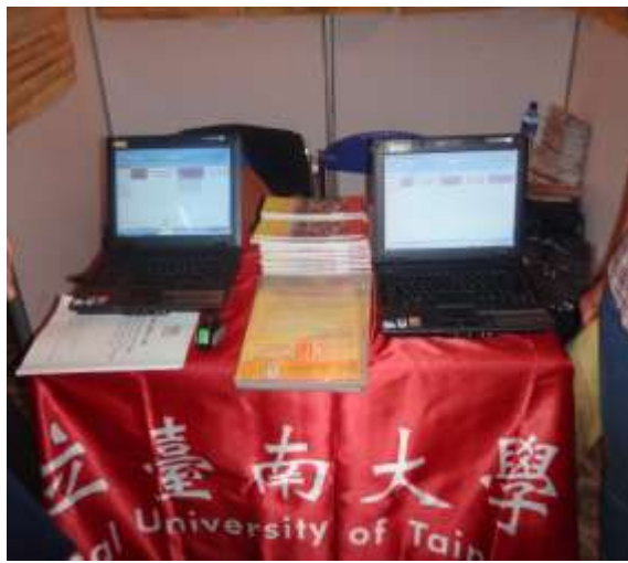
圖 19.準備 2 台筆電供學生輸入資料