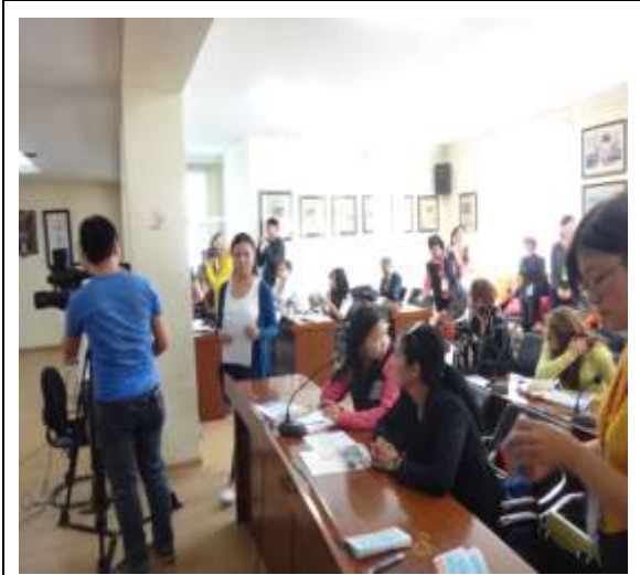
圖 3. 蒞臨教育展採訪之記者群