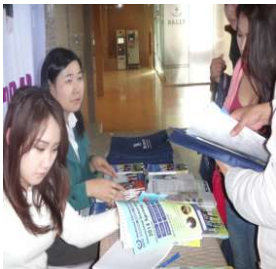
圖 21.展場入口放置本校環保袋