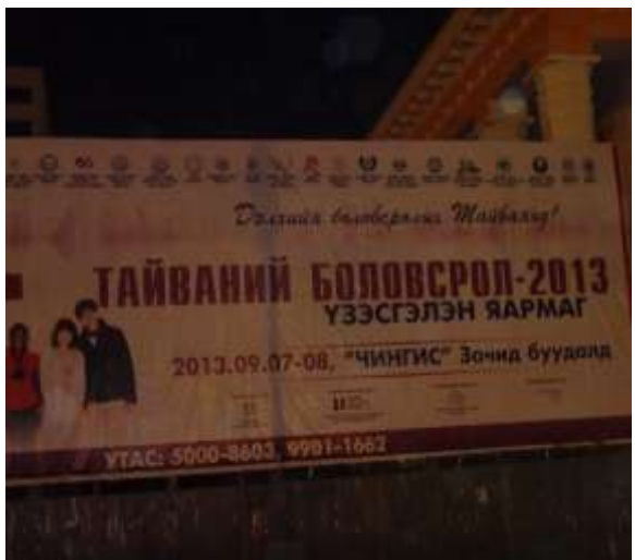
圖 11.設在國會廣場邊之宣傳大海報