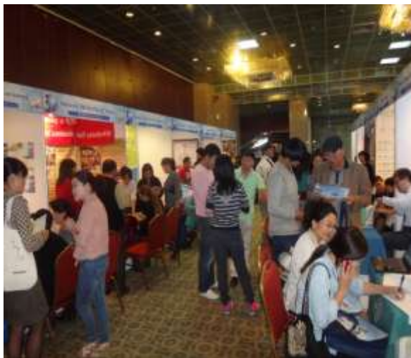
圖 9.教育展會場各校攤位狀況