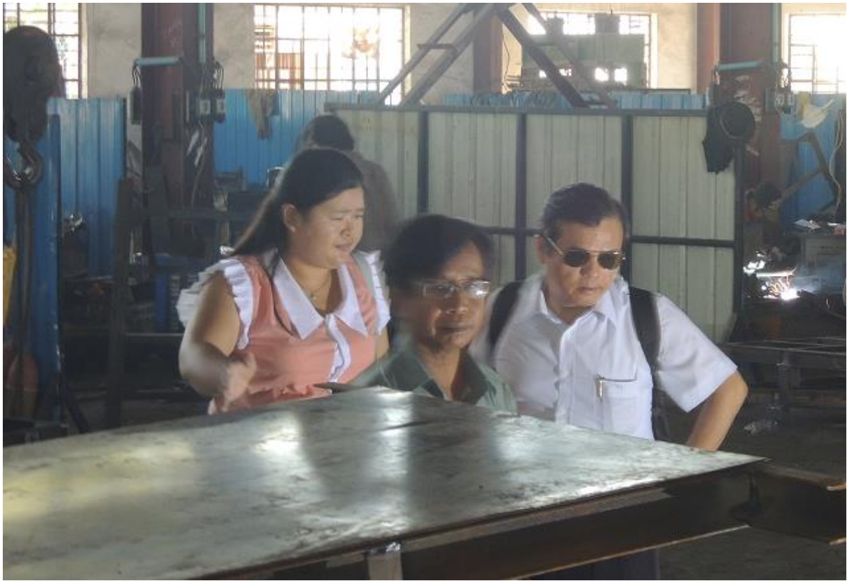
11月6日 參訪曼德勒第三工業區