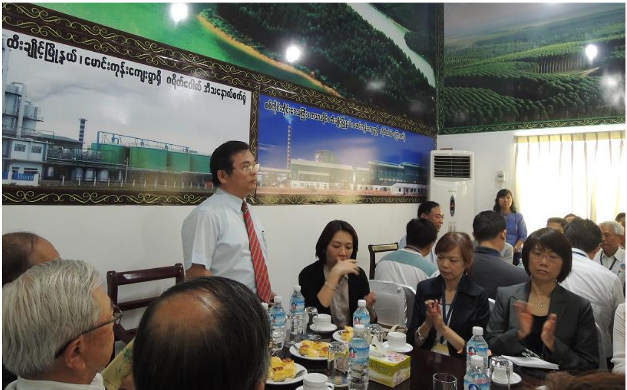
11月7日 參訪「長城集團」