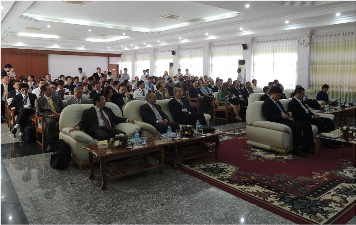
11月4日 參訪亞洲世界集團 聽取簡報