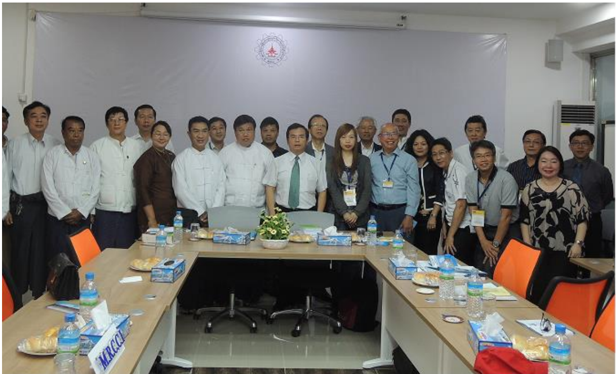
11月6日 拜會曼德勒商工會