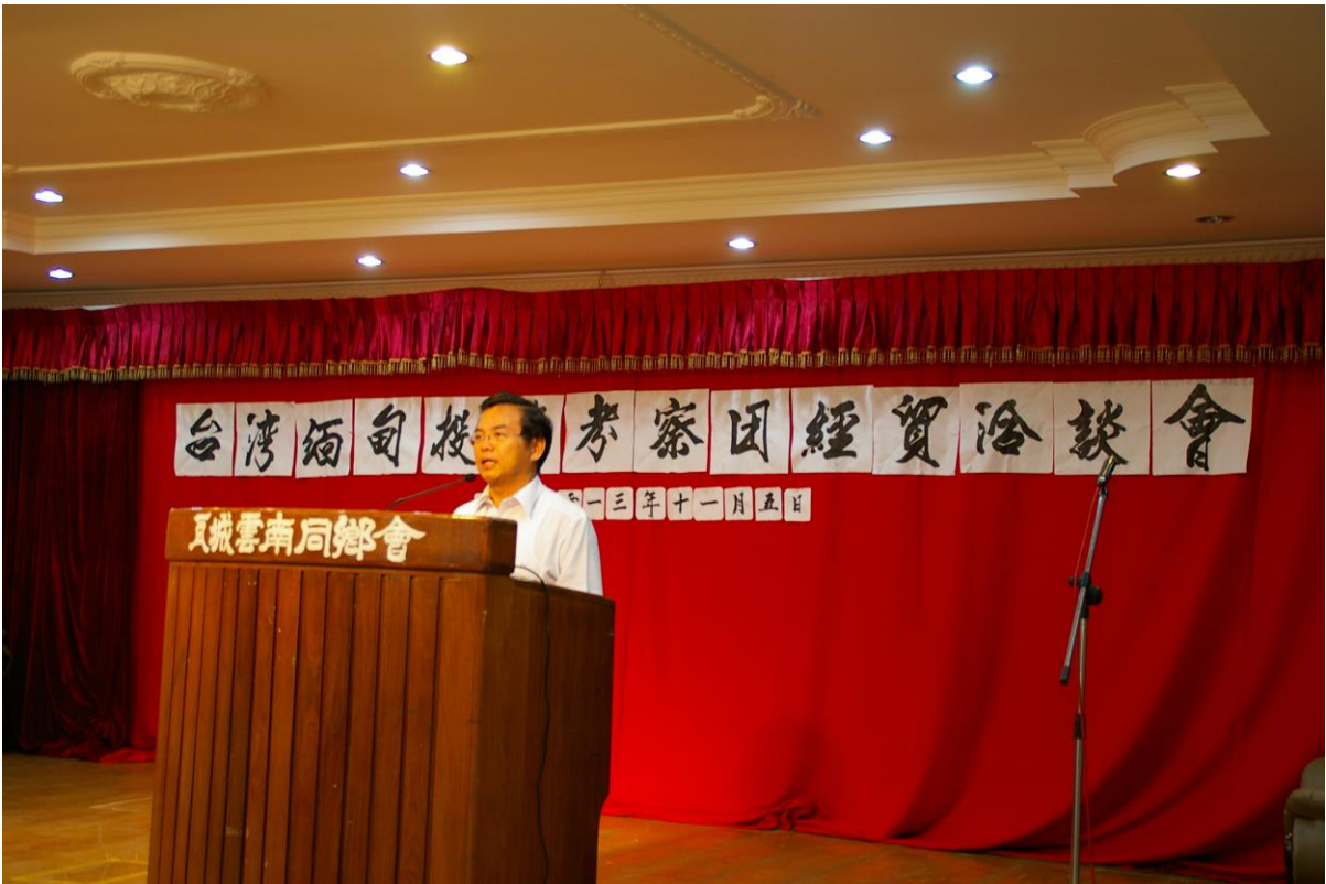
11月5日「台緬企業合作座談會」（曼德勒雲南同鄉會）