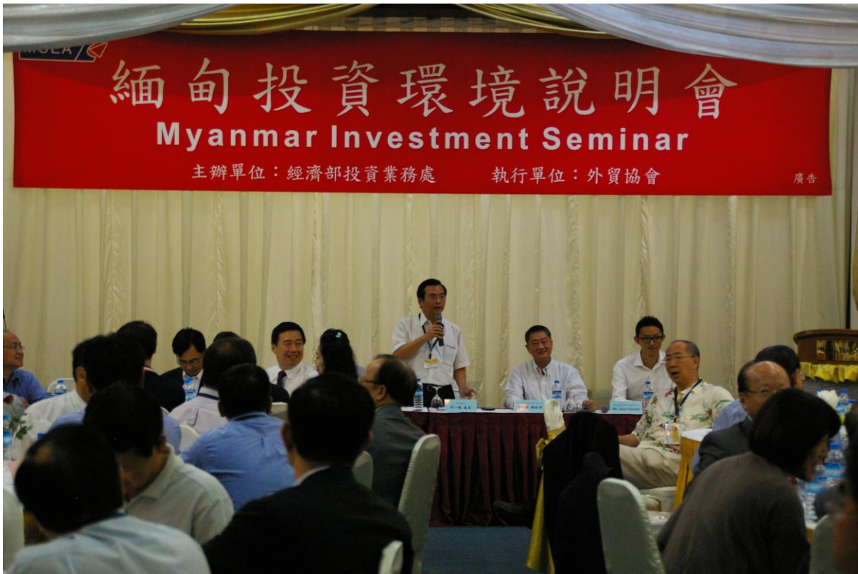
11月3日 緬甸投資環境說明會