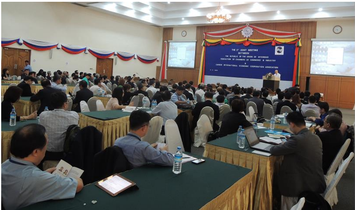
11月4日 參加第一屆台緬經濟聯席會議