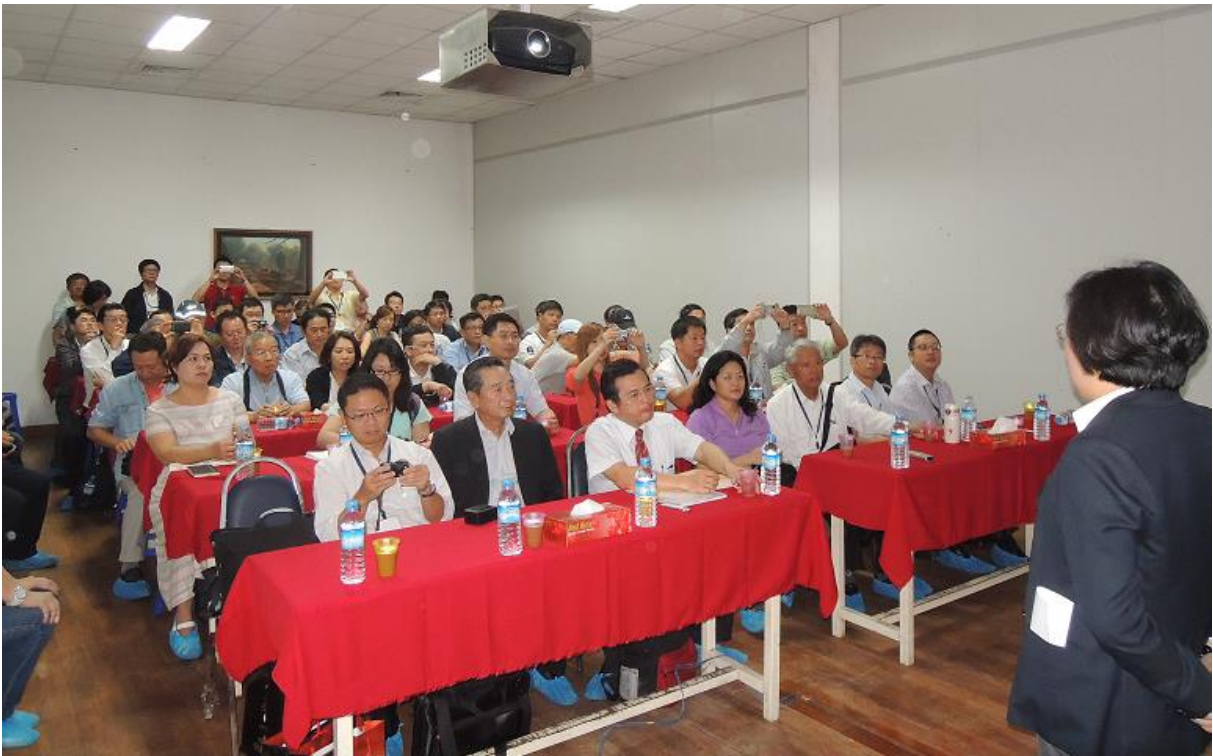
11月5日 參訪緬甸亞太光電公司（亞洲光學集團）聽取簡報