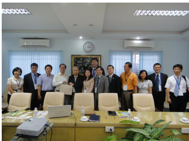
拜會胡志明市醫療廳

胡志明市醫療廳並表示，目前針對人力資源管理、醫療機構建置、醫療器材供應專案發展、健康照護報告及資訊系統等項目，都相當有興趣與國際業者交流合作，特別在醫管方面有相當高的需求。如醫療廳有任何相關發展計畫，會提案給上層機關，若是技術方面議題，同意權將由醫療廳及市政府決定，或是投資議題，則視投資金額由不同層級的政府單位來決定。而目前越南政府鼓勵興建私人醫院，也有提供土地、補助租金、前幾年建置期免稅及協助貸款等獎勵措施，越南醫療服務市場仍具相當的開發潛力。目前越南醫師及醫療資源仍集中於胡志明市，政府已開始將資金集中於發展郡與縣的醫療機構，建構更完整的照護系統。為因應持續增加的照護需求，目前胡志明市每年培養300位醫師，預計在2020年將增加至每年1,100位，預期越南的醫療環境將持續改善及成長。