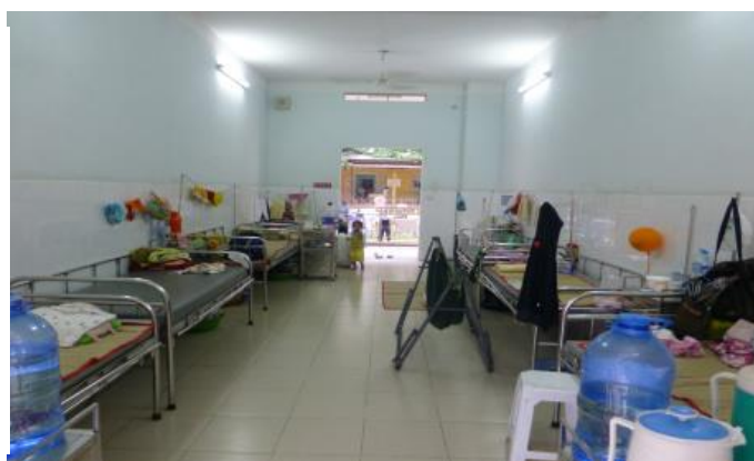
兒童醫院 Children Hospital2 病房