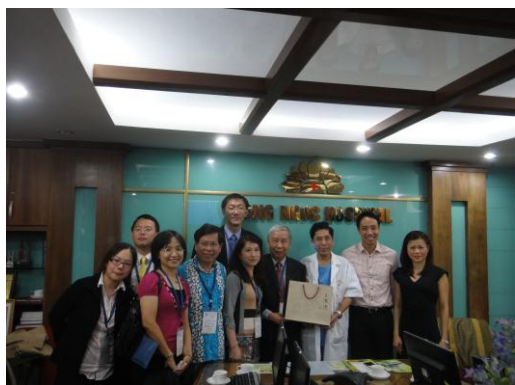
拜會Hong Ngoc Hospital

鴻玉美容院於2013年9月開張，與韓國三家美容院簽定合作契約，並由三名來自韓國的醫生提供客戶服務。鴻玉醫院2年前開始與KOTRA（大韓貿易投資振興公社）合作，因KOTRA組醫療服務訪問團赴越南交流，除有醫師在鴻玉醫院駐診，鴻玉亦將有需求的客戶轉介至韓國，目前鴻玉醫院98%的客人為越南籍，如國外醫師在越南執業，仍需會講外語的護士陪同。