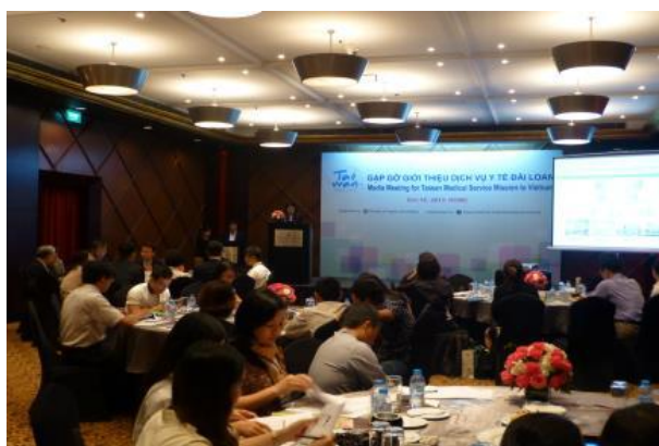
逾30家記者熱烈參與記者會

療服務，較2011年成長60%，在在證明台灣的醫療服務是受到肯定、值得信賴的。政府努力協助建立台灣醫療品牌，提升品牌形象，建構台灣醫療旅遊平台，邀請海外旅行社與醫療單位與台灣醫療機構合作洽談。同時，也陸續分享台灣的愛心給海外罕重症病友，透過本次記者會，讓大家了解台灣所提供的優質醫療服務，造福更多海外的病友。