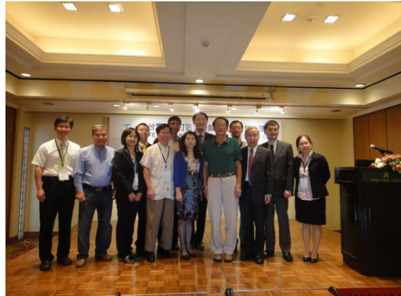
駐越南代表處黃志鵬大使蒞臨指導