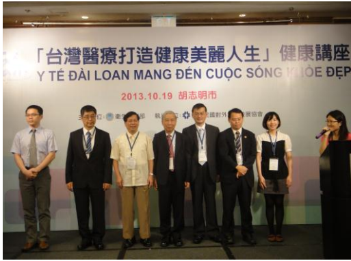
本團醫師專家團隊