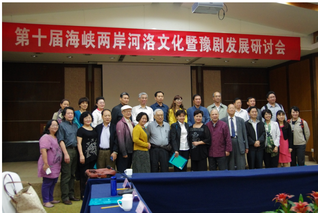
第十屆海峽兩岸河洛文化暨豫劇發展研討會圓滿落幕，與會學者專家合影留念。