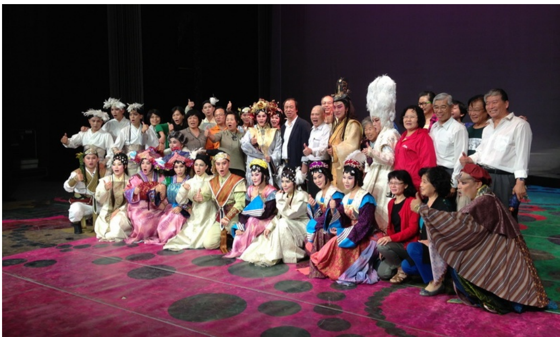
《花嫁巫娘》北京場演出結束後，學者專家、臺商企業等與演職員合影。