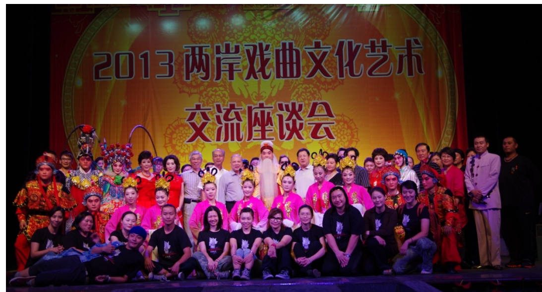
臺灣豫劇團與山東省泰安市山東梆子藝術研究院專業技藝交流後合影。