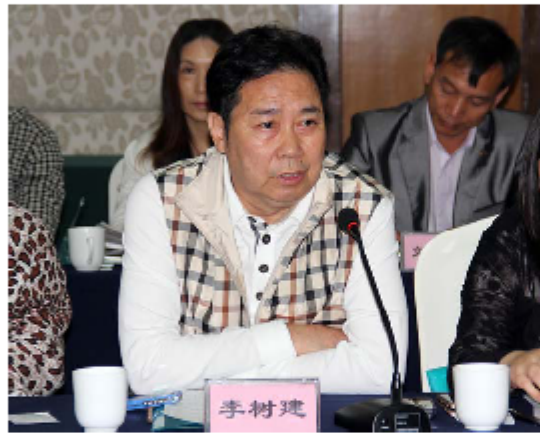
中国剧协副主席、河南豫剧院院长李树建发言

时间: 2013-09-26 作者: 冯冬艳 来源: 河南文化网 字体: 大 中 小 访问次数: null