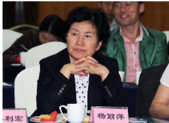
河南省文化廳長楊麗萍出席研討會