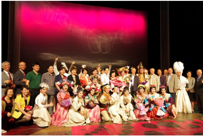
河南省戲劇專家、學者、省府官員、文化廳官員觀賞《花嫁巫娘》後，與演職人員合影。