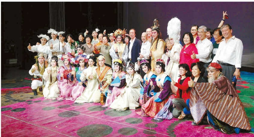
两岸戏曲界人士演出后合影

9月18日、19日,台湾豫剧团在北京戏曲艺术职业学院少儿戏剧场演出两场,获得了专家学者与现场观众的广泛好评。该团随即转往河南郑州、天津继续巡演。 (小 胖)