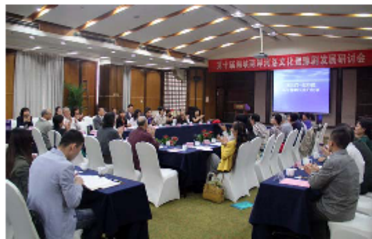
第十屆海峽兩岸河洛文化暨豫劇發展研討會現場