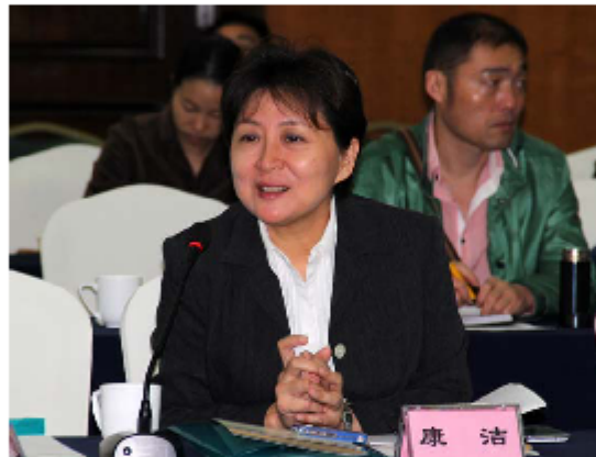
河南省文化廳副廳長康潔致辭

在豫劇進入台灣60周年之際，9月24日，由河南省文化廳主辦、省文化藝術研究院承辦的“第十屆海峽兩岸河洛文化暨豫劇發展研討會”在鄭州舉行。來自海峽兩岸的30多位豫劇界專家、學者、演員會聚一堂，就豫劇在台灣60年的生根發展和壯大進行了深入研討。