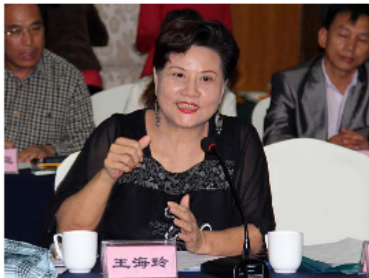
“台灣豫劇皇后”王海玲發言