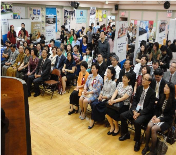
8月24日臺灣教育展開幕式現況