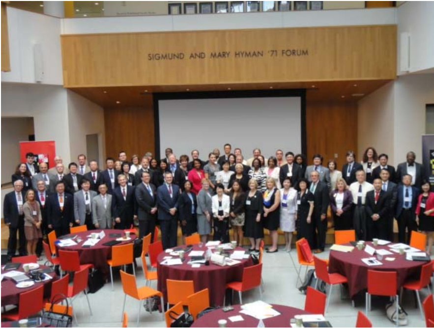
8 月 23 日 第 1 屆臺灣馬里蘭高等教育會議全體合影