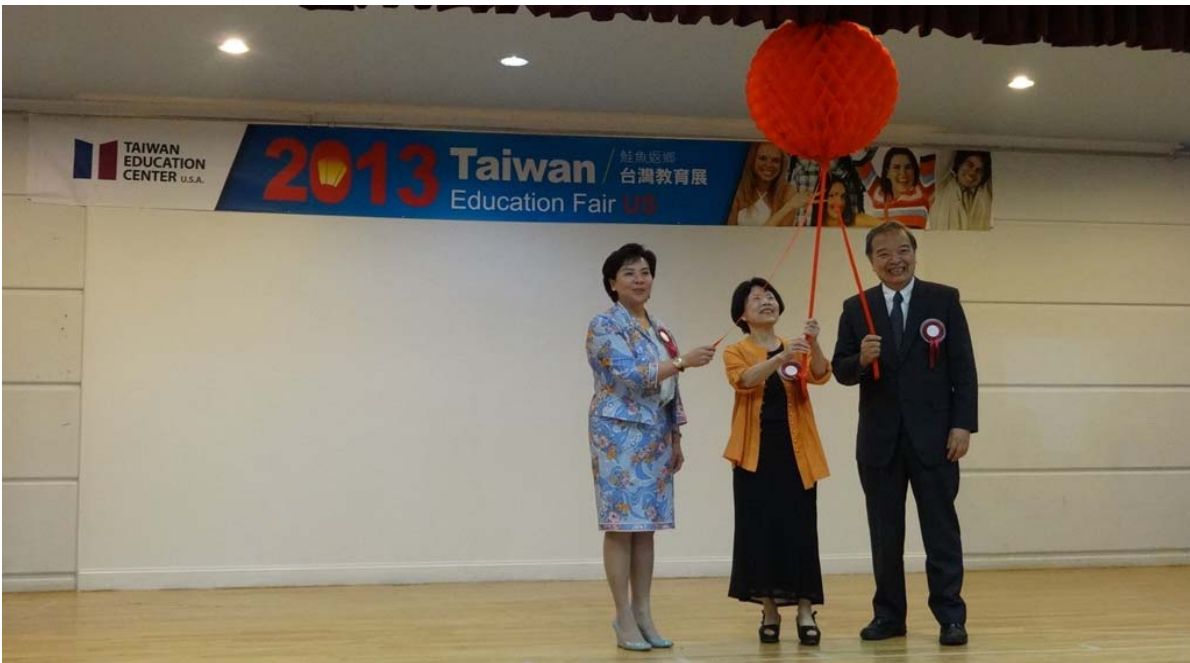
8月24日黃政務次長(中)主持「2013 鮭魚返鄉美國東部臺灣教育展」剪採儀式