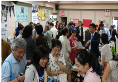
為吸引更多華裔子弟回台攻讀高等教育，19所台灣大專院校聯袂在紐約舉辦鮭魚返鄉教育展，讓更多華裔子弟有機會回故鄉求學，也認識自己的文化、歷史。