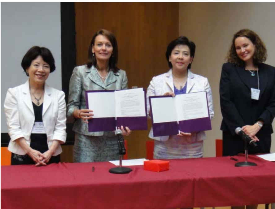
8 月 23 日 財團法人高等教育國際合作基金會與馬州私立大學校院協會(MICUA)簽署合作備忘錄