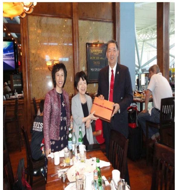
8月25日黃政務次長及邱代理司長與 駐紐約辦事處高振群大使於送機前合影