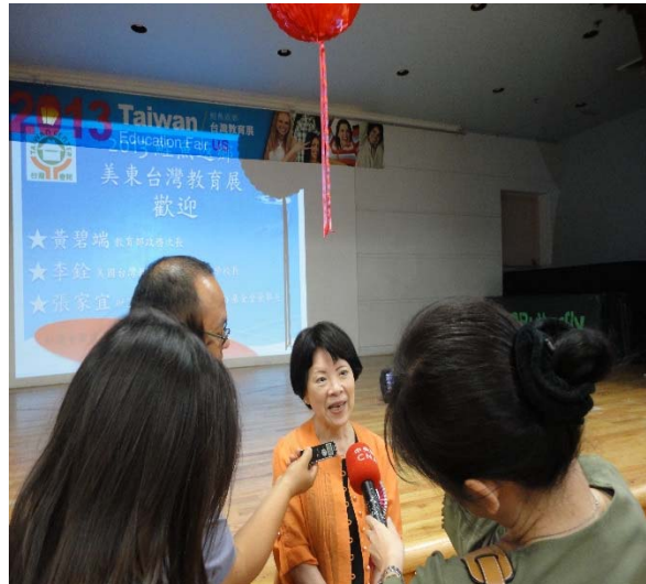
8月24日黃政務次長於開幕式前接受媒體採訪