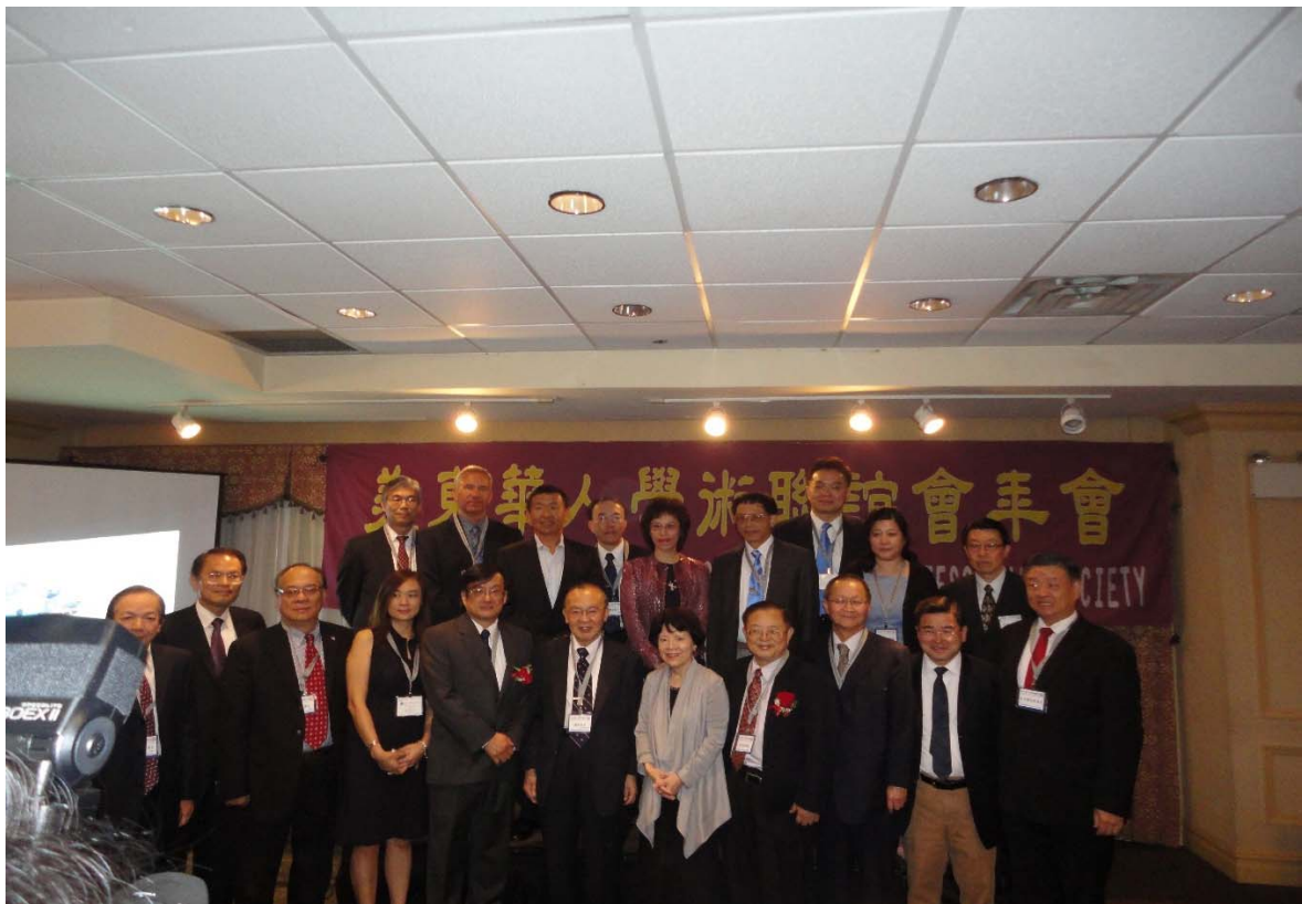
8月25日美東華人學術聯誼會第38屆年會開幕合影