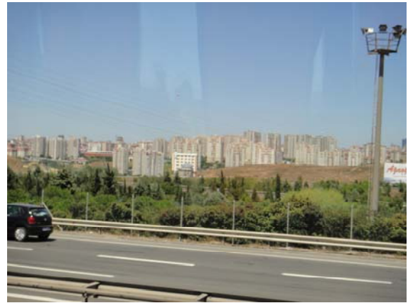
左圖為伊斯坦堡市跨越柏斯普魯士海峽大橋之新興亞洲區；右圖為亞洲區興建中之新市鎮