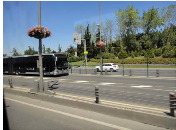
研討會地點之伊斯坦堡都會巴士 (Metrobüs)