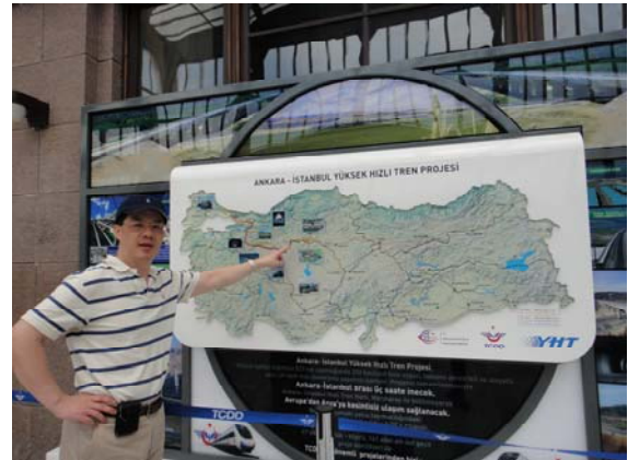
首都安卡拉 (Ankara) 火車站—自伊斯坦堡市搭乘高鐵至此約為三小時