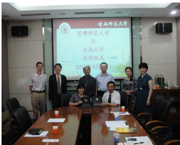
黃校長與官校長簽約及陪同人員合影