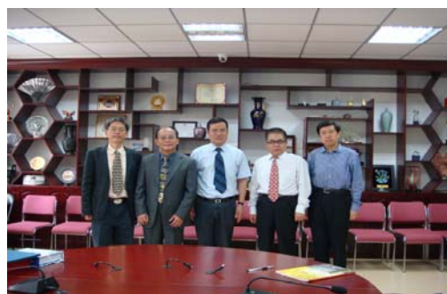
兩校參與院級合作協訂人員合影