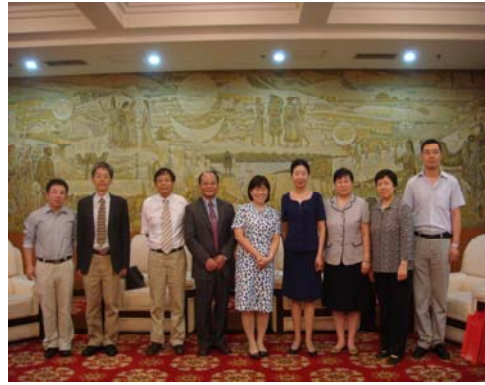
黃校長及宋敏校長及陪同人員合影