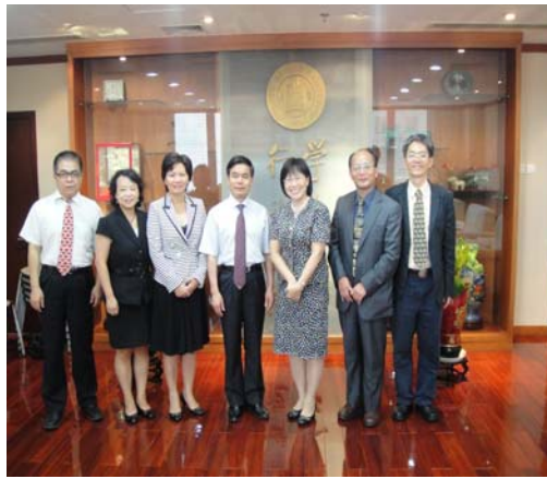
黃校長、董校長及陪同人員合影