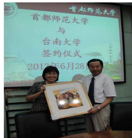
黃校長贈紀念品給官校長