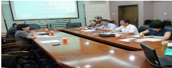
黃校長與北京首都師大官釋力校長及其同仁座談合影

此行的另一件要務即與北京首都師範大學簽訂校級合作交流協議。以下先簡介北京首都師範大學之概況，再說明參訪及簽訂合作交流協議情形：