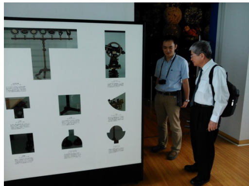
參觀技術史展示場