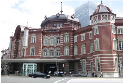
步行參觀東京車站