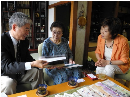
顏副校長致贈學校簡介及個人著作