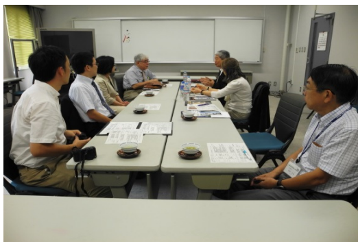
與京都大學總合博物館教授討論