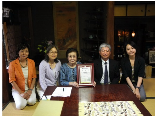
致贈國立成功大學博物館之感謝函 (感謝今年 05 月捐贈大禮服)