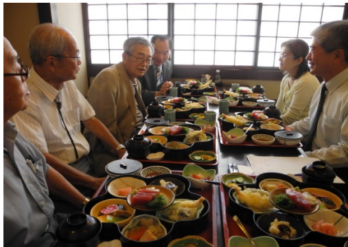
校友憶談學校師長