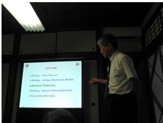
顏副校長演講主題

「Ancient Padlocks from Collection & Research to Science Education in Museums」