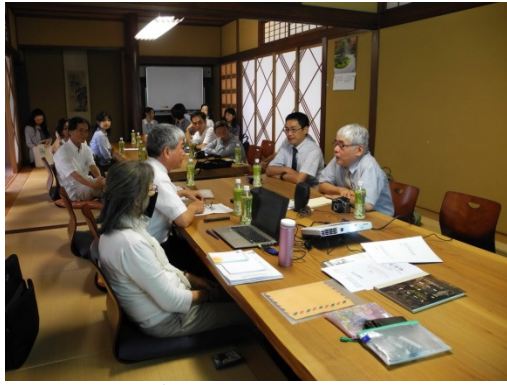
演講會後綜合座談與提問