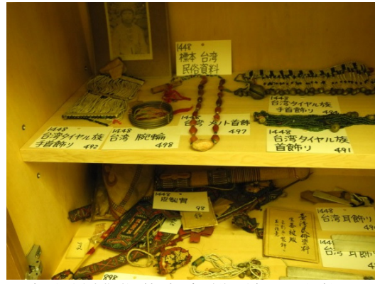
京大總博典藏之台灣原住民文物