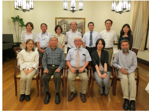
晚宴與總博教職員及外國人研究者合影