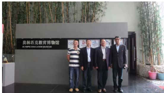
本團成員與斐東光教授合影