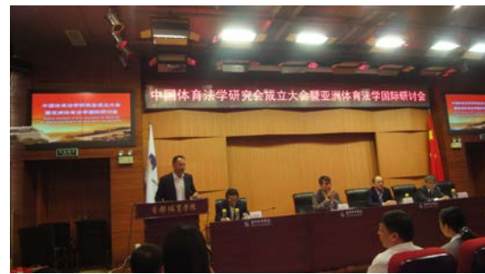
首體校長開幕致詞