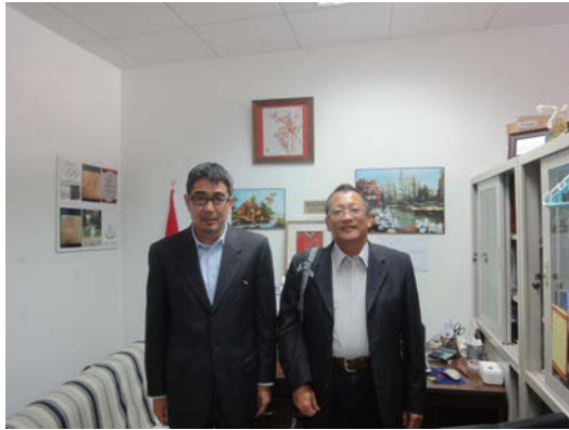
葉公鼎院長與斐東光教授合影