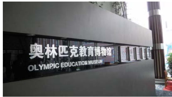
首體的奧林匹克教育博物館外觀