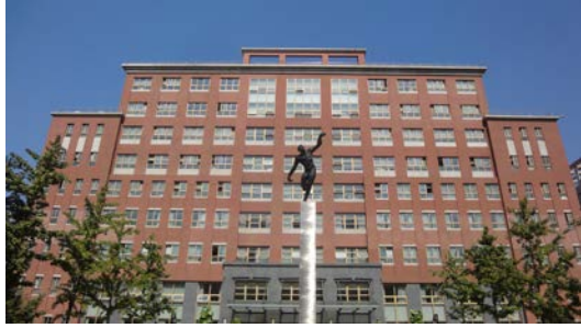
首都體育學院行政大樓