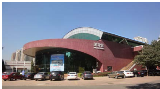
首都體育學院游泳館