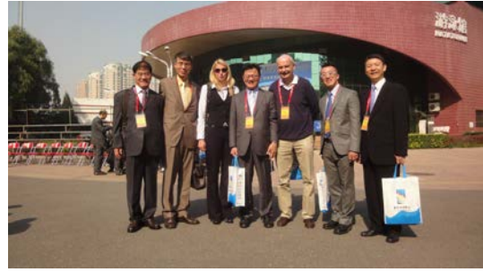
與各國與會人員合影