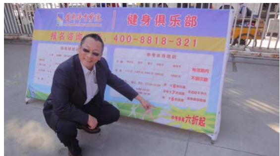
葉公鼎院長特別關心首體的對民眾課程