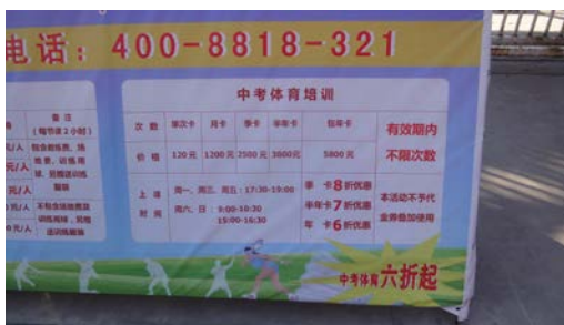
首體針對中學生體育考試有補習課程