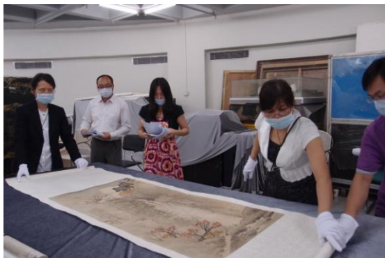
圖 15 雙方檢視文物，並核對文物狀況報告