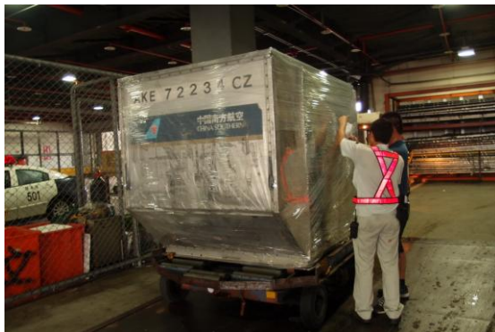
圖 5 裝載借展文物於中國南方航空