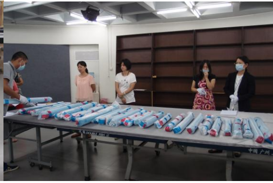
圖 12 世貿運輸包裝公司人員協助點數