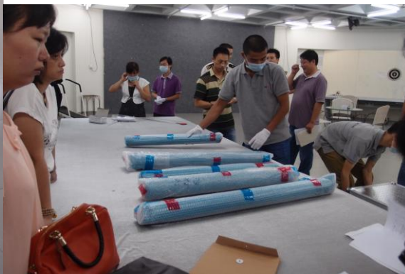
圖 9 世貿運輸包裝公司人員進行開箱 圖 10 世貿運輸包裝公司人員放置 63 件文物於點驗桌