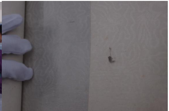
圖 16 二件作品之裱工檢驗時發現細微裂紋