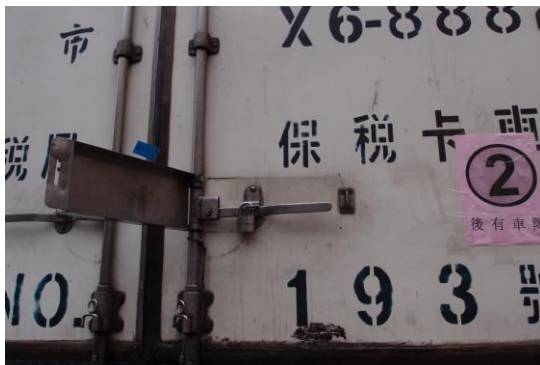
圖 3 裝載封車