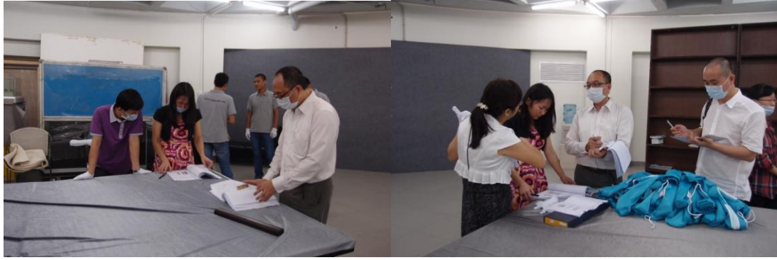
圖 17 雙方詳細記錄於文物狀況報告