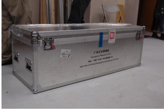
圖 1 借展文物於院內進行封箱作業