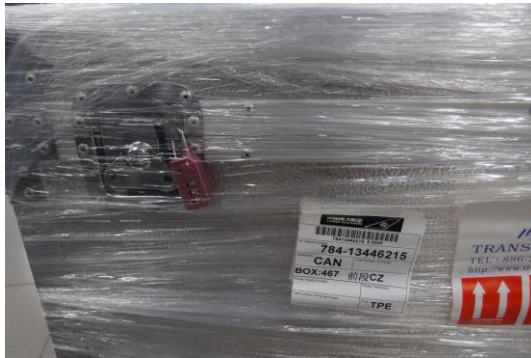
圖 7 拆封前先確認封箱完整性