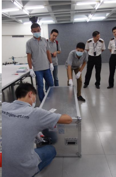
圖 8 世貿運輸包裝公司人員進行拆箱作業