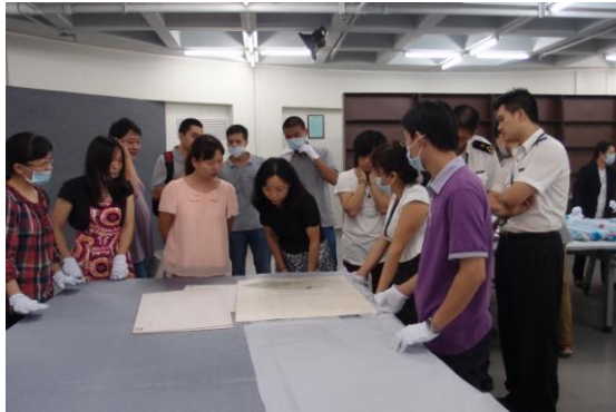
圖 13 廣州藝術博物院安排當地海關抽點