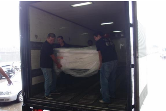
圖 4 在中正機場進行作業