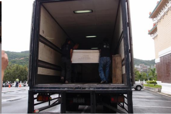
圖 2 借展文物裝載於氣墊車