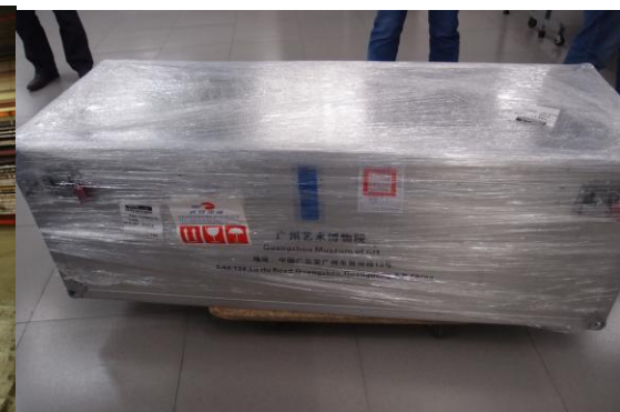
圖 6 文物運抵廣州藝術博物院