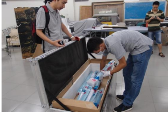
圖 11 世貿運輸包裝公司人員協助拿出文物