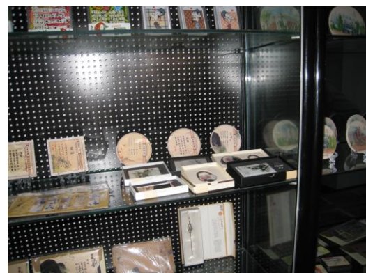
圖 4. 參觀成都職業技術學院成都軟件教育園進駐設計類校企合作作品展示