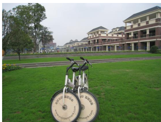
圖 7. 參觀北歐國際管理學院校園