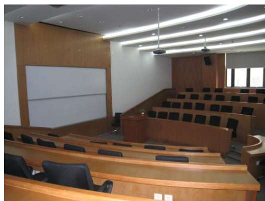
圖 8. 參觀北歐國際管理學院教室