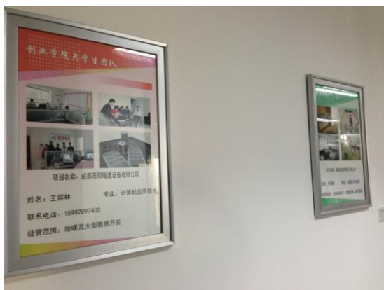
圖 5. 參觀成都職業技術學院創業學院