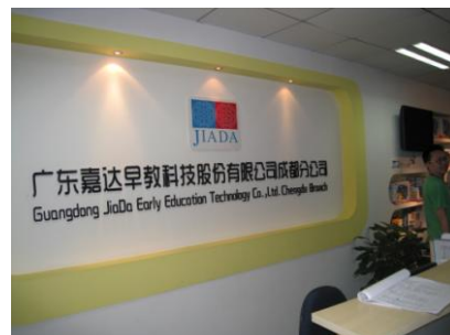
圖 2. 參觀成都職業技術學院成都軟件教育園進駐校企