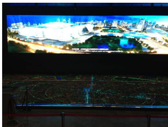
圖 9. 參觀成都城市規劃館(模型與液晶展示牆)