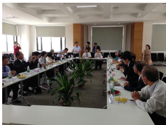
圖 6. 參觀北歐國際管理學院