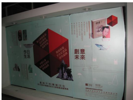
圖 3. 參觀成都職業技術學院成都軟件教育園進駐設計類校企