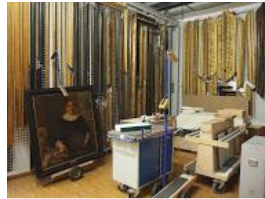
● 卡塞爾博物館庫房