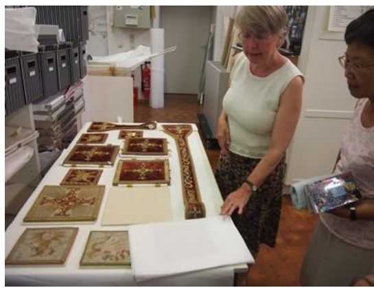
● 參訪巴邦宮殿管理局的織品修復室