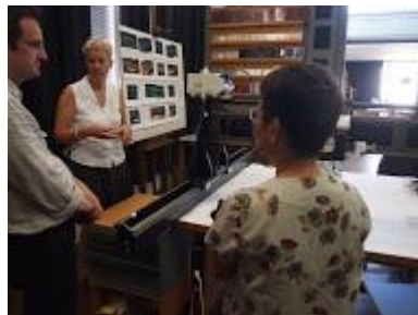
● 卡塞爾博物館群油畫修復工作室