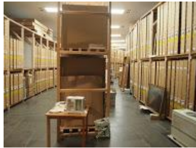
● 卡塞爾博物館庫房

(2) 下午參看庫房，配有微小空間氣候調節設備；可放心出借作品，該畫框裝置可租借。