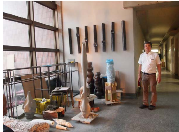
金澤美術工藝大學工作室參觀