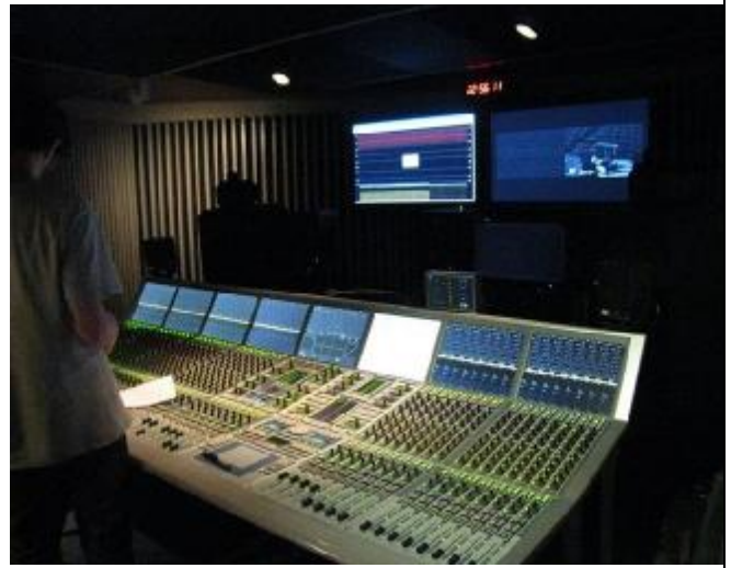
研究生個人作曲小間