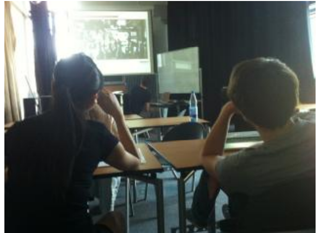
電影所長 Prof. Ulrich Reuter 教學