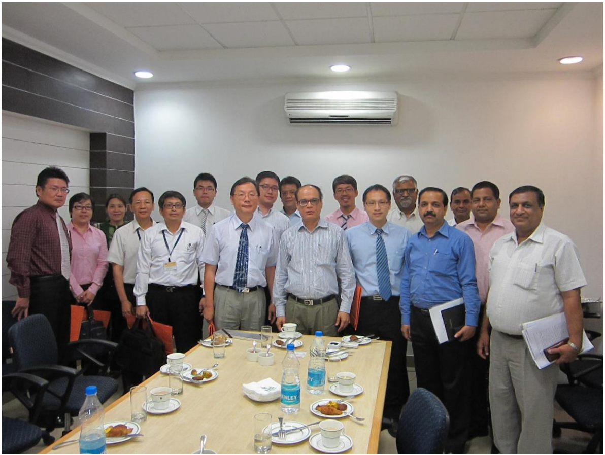
9月3日 拜會 Haryana 州工業暨基礎建設發展公司 (HSI IDC)