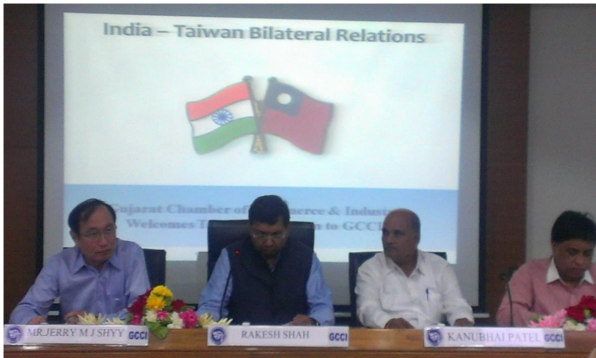
8月31日拜會 Gujarat 省商工會(GCCCI)