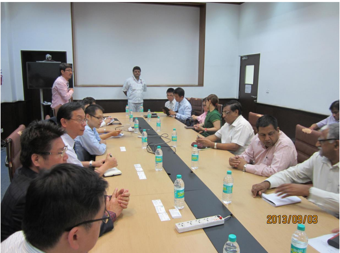
9月3日 參訪 Haryana IMT-Manesar 工業區 Honda 機車廠