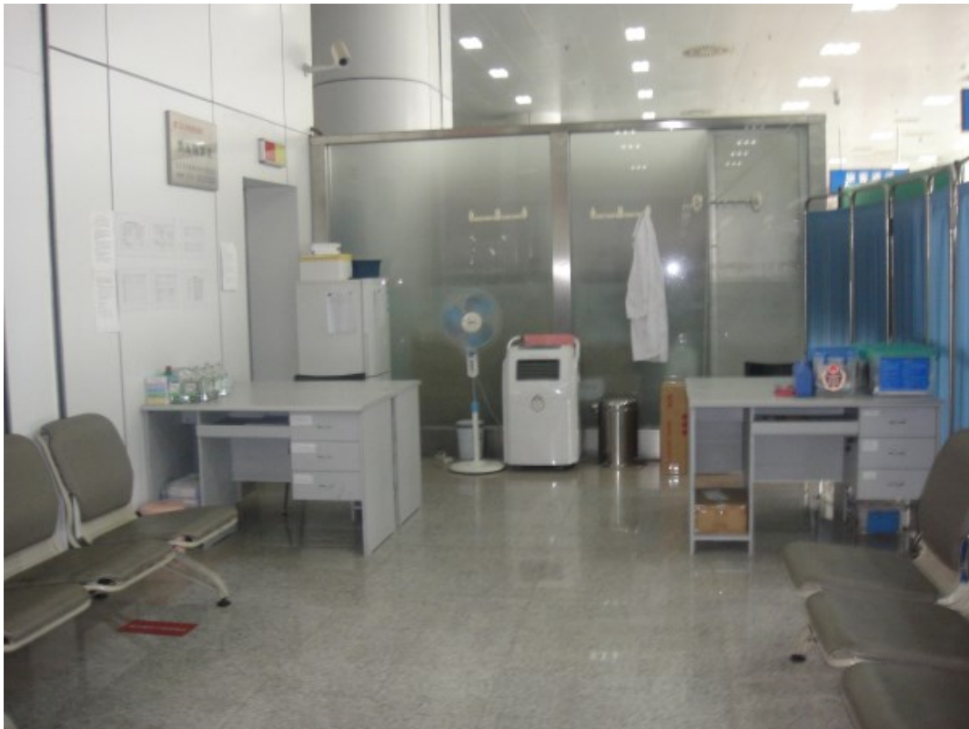
附圖五、廈門國際郵輪中心入(金廈客運碼頭)境體溫異常旅客後送專用通道