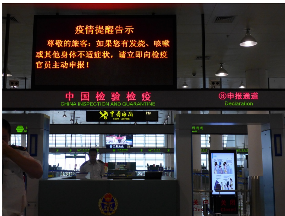
附圖三、廈門國際郵輪中心（金廈客運碼頭）口岸傳染病排查處置流程