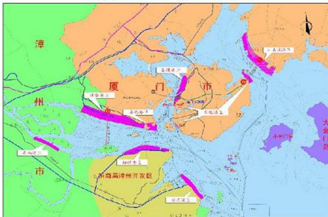
廈門港港區布局示意圖

廈門港是大陸沿海主要港口之一，包括廈門市(東渡、海滄、嵩嶼、劉五店等 5 處貨運港區及和平、東渡、五通等 3 處客運港區)和漳州市(招銀、后石、石碼等 3 處貨運港區)的十大港區，分布在廈門灣和東山灣內，以公路連接福建省全省公路網，全港集裝箱航線共計 183 條，月航班 944 班。現有生產性泊位 139 個，其中萬噸級以上泊位 62 個(含 10 萬噸級以上泊位 14 個)，主航道水深達-15.5~-16.0 米，底寬 410~450 米，可提供 10 萬噸集裝箱船舶雙向通航及 15 萬噸級以上集裝箱船舶乘潮通航。