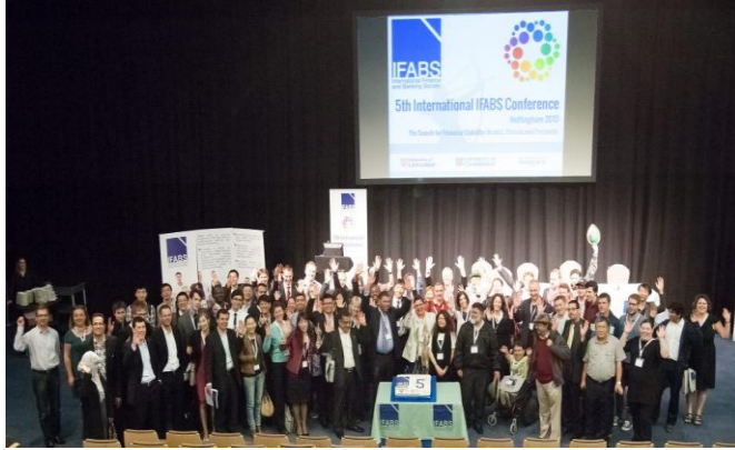
圖一 2013IFABS 閉幕式留影