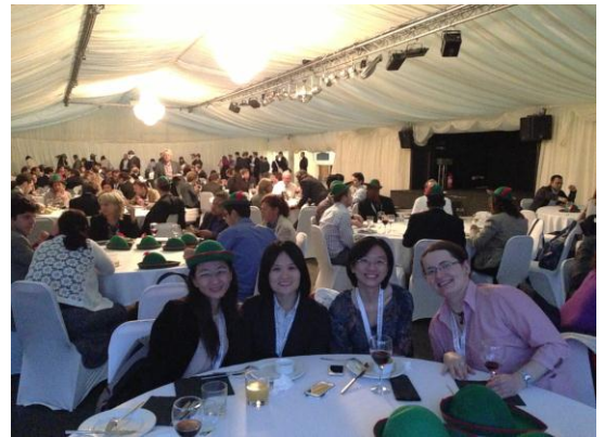
圖四 接待晚宴留影