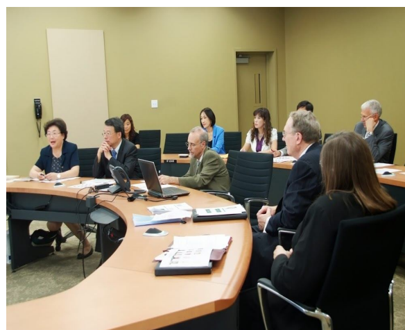
圖五：會議進行會場一隅