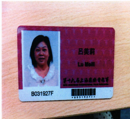
圖：電影市場展註冊中心及識別証