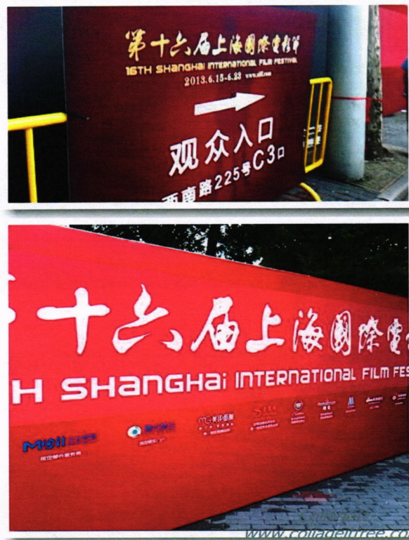
圖：上海電影節開幕式-入場門票&迎賓禮車及圍觀群眾