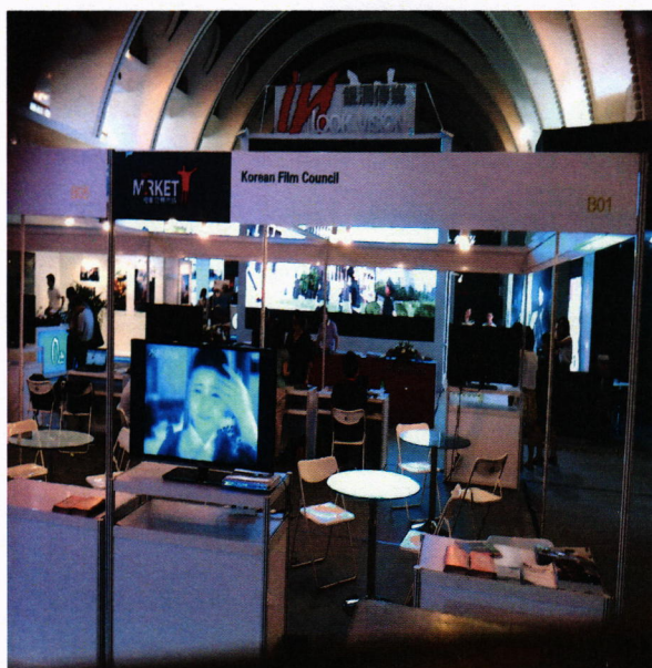
圖：韓國電影委員會市場攤位

本次參觀市場展攤位時，觀察到亞洲國家幾乎都有攤位，並僱請當地工作人員做推展介紹。