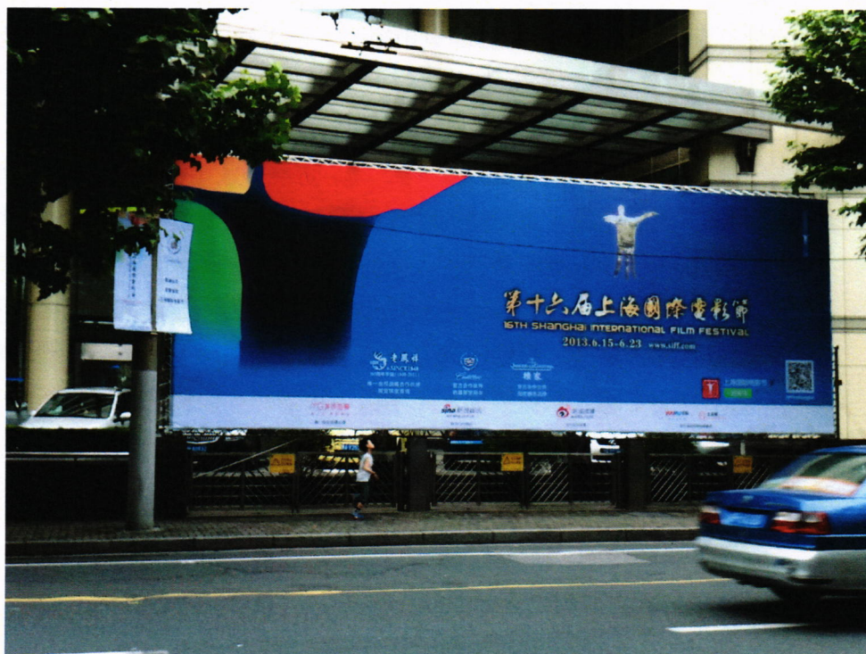
圖：上海電影節大型看板

除了競賽影片之外，該影展亦設立了「向大師致敬」、「官方推薦」、「聚焦中國」、「經典再現」、「多元視角」、「觸摸 3D」、「地球村」、「MIDA 紀錄片」、「電影短片展映」、「IMAX 視野」等多項觀摩影片單元，薈萃中外數百部新片佳作，本次台灣影片「候鳥來的季節」亦入圍「多元視角」單元。