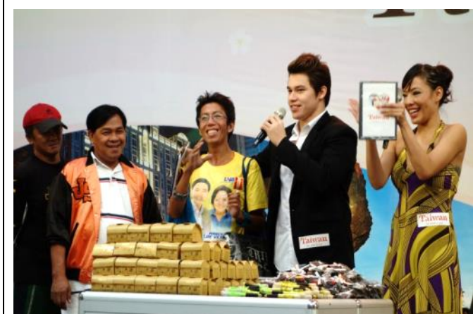
當地藝人擔任推廣嘉賓推介臺灣觀光