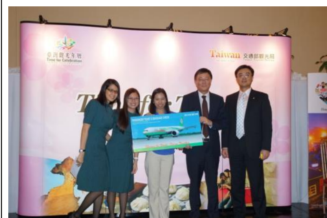
長榮航空提供臺北-馬尼拉-美西來回機票抽獎