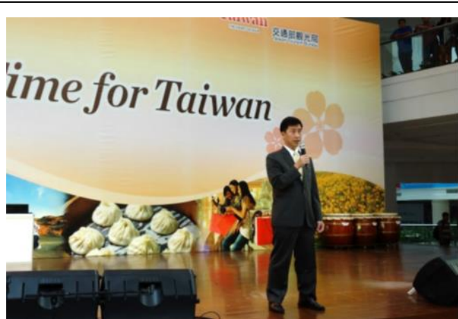
吉隆坡辦事處巫主任開場致詞