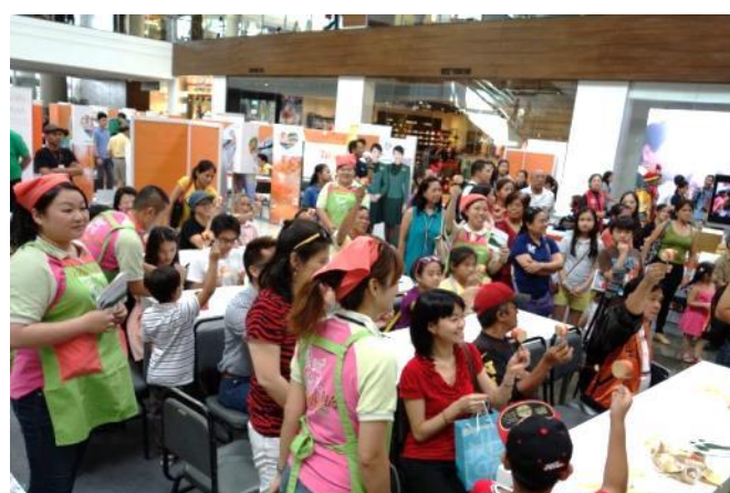
臺灣童玩 DIY 教學體驗，現場反應熱絡