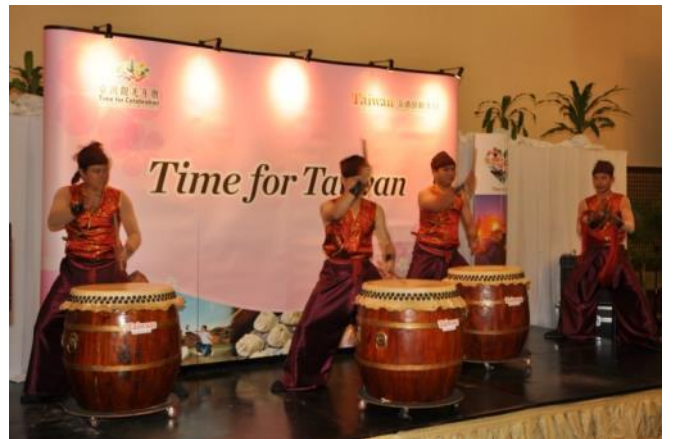
鴻勝醒獅團以磅礴擊鼓氣勢開場