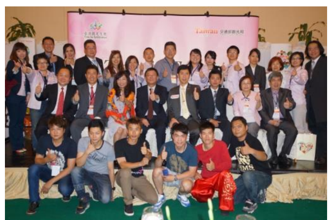
臺灣觀光代表團於推廣會圓滿結束後合影留念