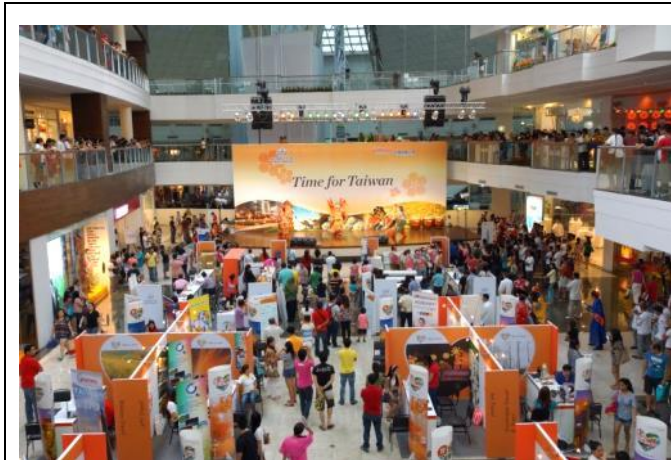
展銷會現場人潮絡繹不絕