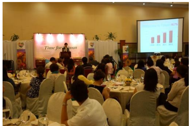
吉隆坡辦事處巫主任簡報臺灣觀光資源