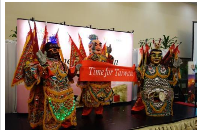
電音三太子 show 「Time for Taiwan」