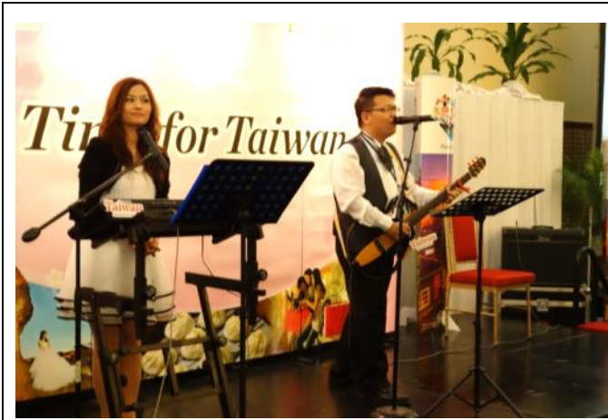
奇蹟樂團-MJ 二重唱精彩演唱