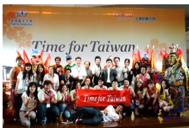
展銷會圓滿落幕，所有參展人員合影留念