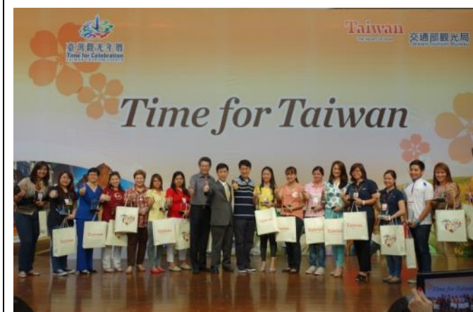
巫主任與菲律賓主力送客旅行社業者合影