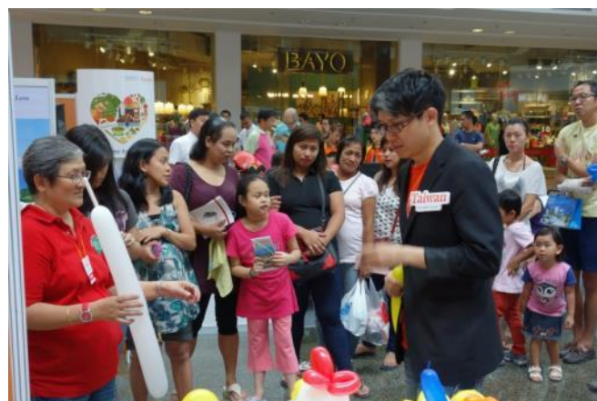
參展工作人員與現場親子家庭互動