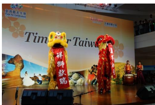
精彩舞獅表演為展銷現場增添活力熱鬧氣氛