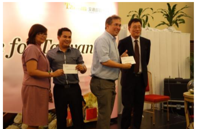
中華航空提供臺北-馬尼拉來回機票抽獎