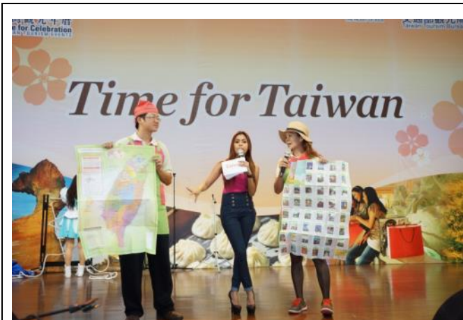
台灣休閒農業發展協會代表與展銷會主持人 共同推廣臺灣農場旅遊