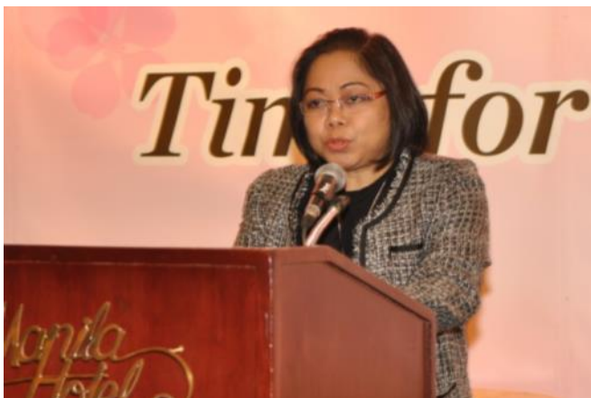
菲律賓觀光部北美及亞太司長致詞