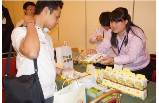
業者介紹臺灣農場環境並致贈伴手禮