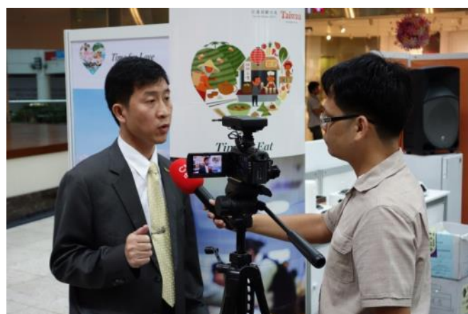
巫主任接受中央社媒體採訪