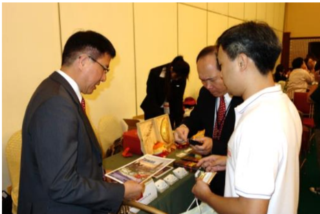
臺菲雙方旅行社業者互動交流