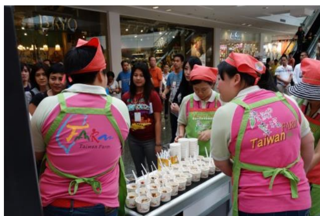
用餐時段提供臺灣美食-小魚乾辣拌米粉 與現場民眾分享，美味程度廣受好評