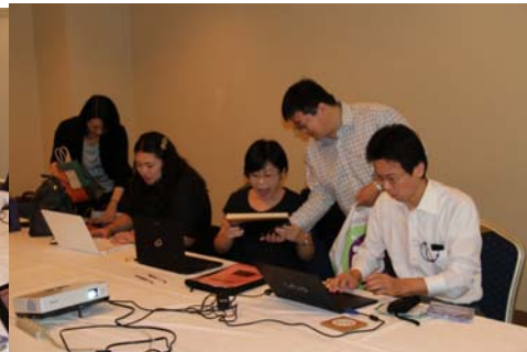
會議簡報與會教授照片(4)-會議討論情況