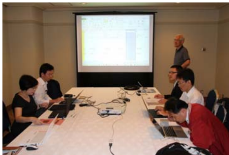
會議簡報與會教授照片(1)