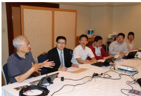
會議簡報與會教授照片(3)-會議討論情況