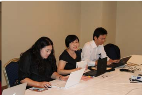
會議簡報與會教授照片(2)