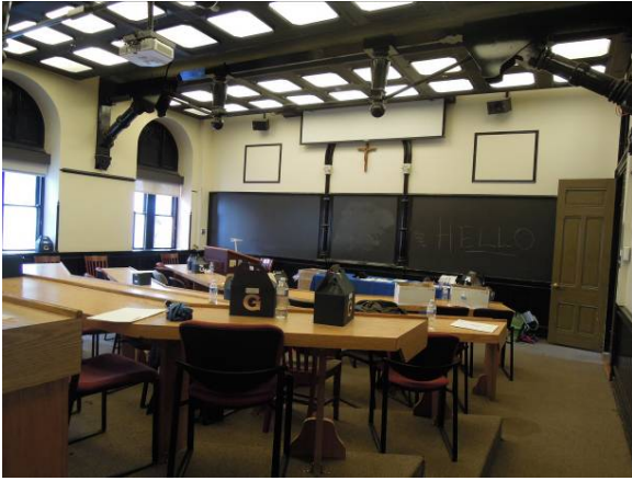
圖 33 喬治城大學希利堂 (Healy Hall) 教室內部