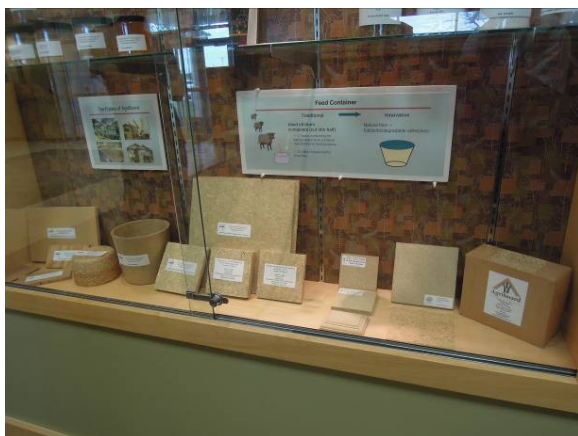
圖 19 生物膠應用於合板 Plywood 產品