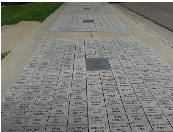
圖 9 將捐款人資料製成地磚，鋪設於走道上