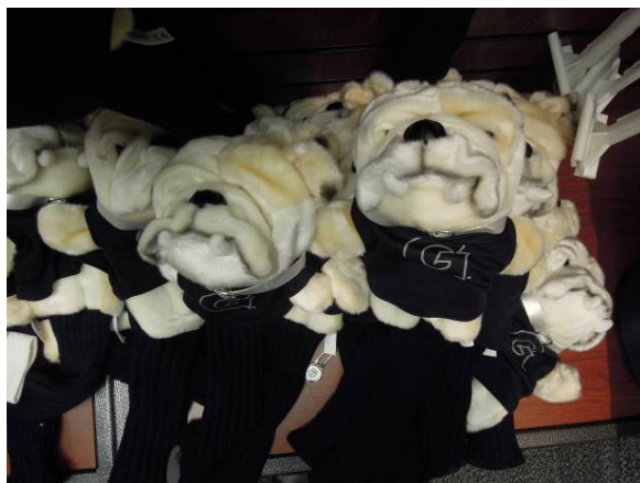
圖 39 喬治城大學吉祥物 HOYA 玩偶