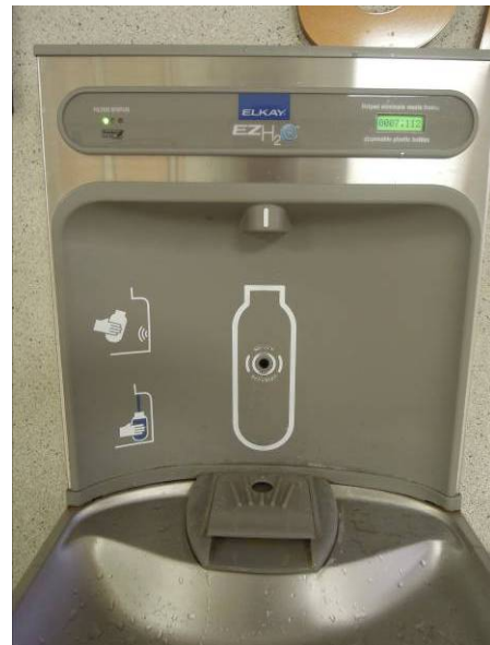
圖 26 感應式自動充水站 (二)