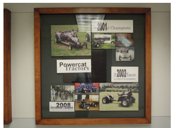
圖 4 BAE 系大學部學生歷年來參加曳引車比賽，獲獎無數