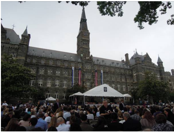
圖 35 喬治城大學法學院畢業典禮(一)