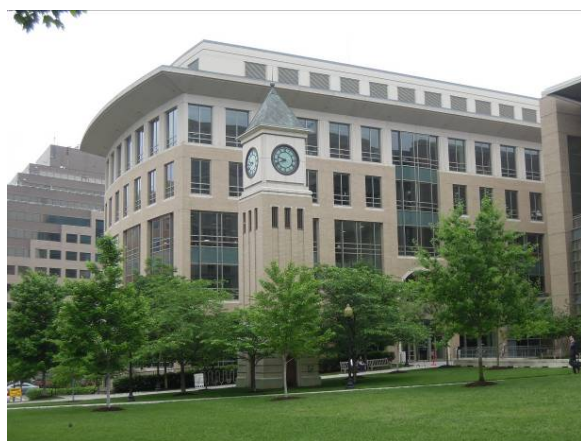
圖 41 喬治城大學法學院(Law Center) 位於華盛頓特區市中心校園