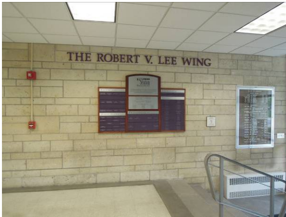
圖 5 系館入口處將重要捐款人之名字列出，以表彰其貢獻