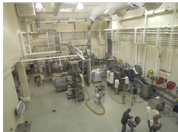
圖 20 穀類擠壓 (Grain Extrusion) 工廠