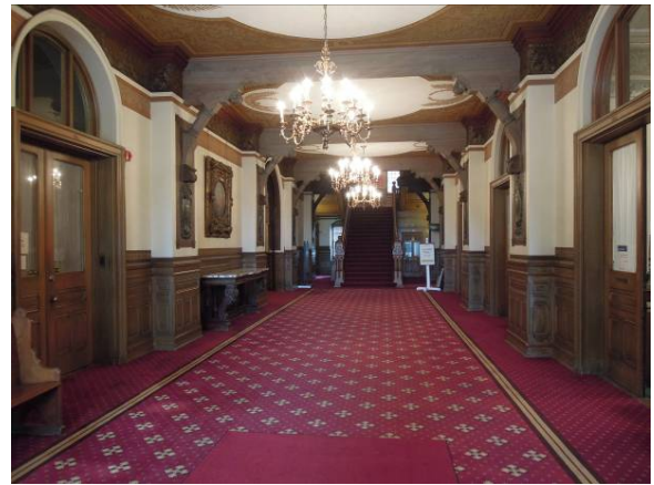
圖 30 希利堂 (Healy Hall) 室內裝潢古色古香