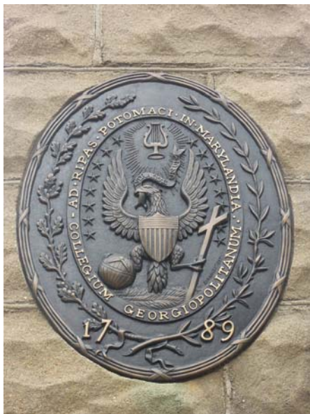
圖 31 喬治城大學校徽 (創立於 1789 年)