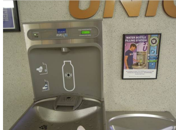
圖 24 感應式自動充水站 (Water Bottle Filling Station)