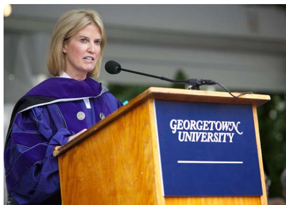
圖 40 福斯電視新聞評論員 Van Susteren 校友專題演講