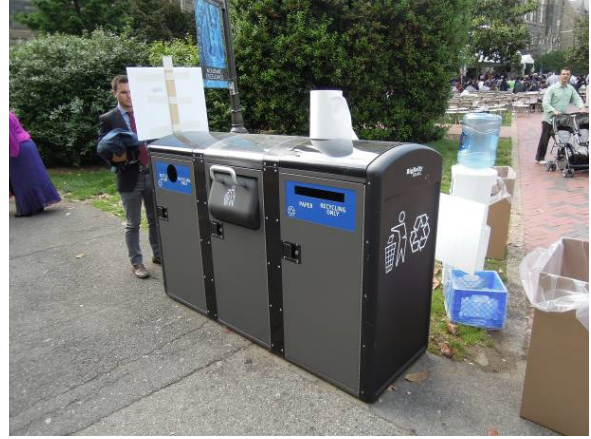
圖 34 喬治城大學校園內有太陽能自動壓縮垃圾桶