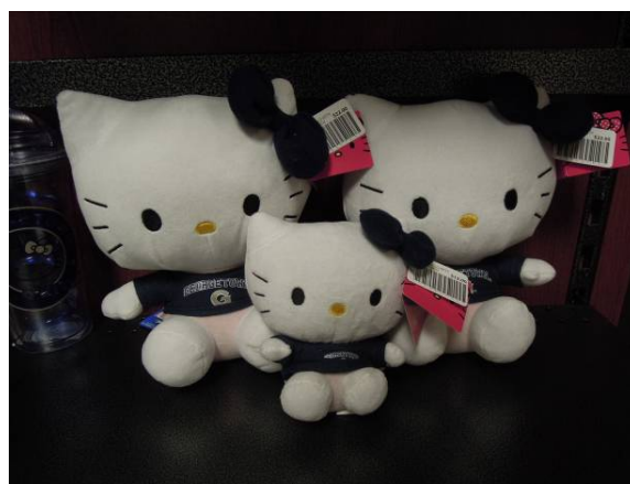
圖 40 喬治城大學 Hello Kitty 玩偶