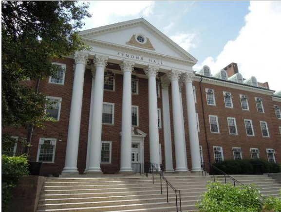
圖 27 馬里蘭大學農業與自然資源學院 (Symons Hall)