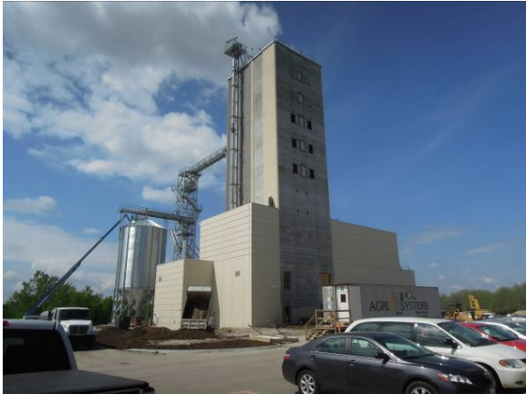
圖 21 試量產級穀倉 (Pilot Scale Elevator)