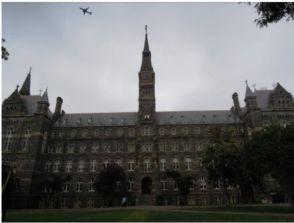
圖 29 喬治城大學希利堂 (Healy Hall) 羅曼式建築風格