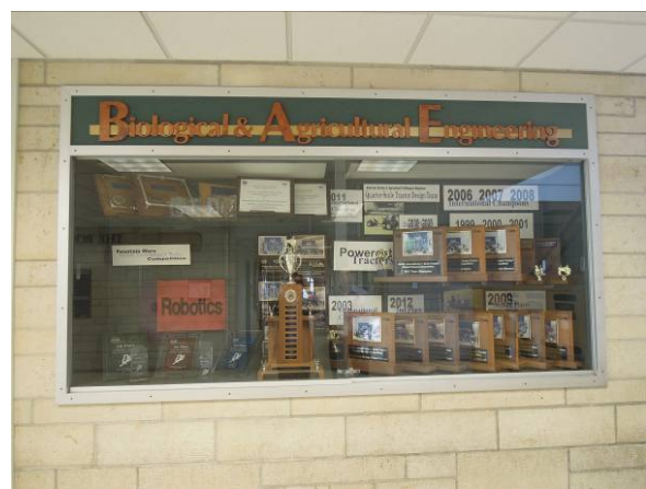
圖 2 BAE 系大學部學生歷年來參加農業機械人比賽，獲獎無數