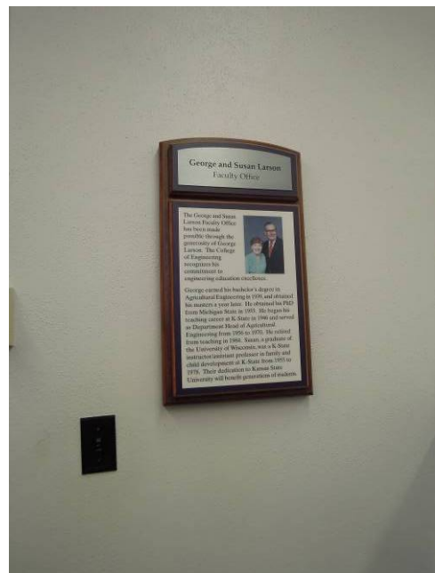
圖 8 室內外製作說明牌表彰其學術貢獻，以茲紀念