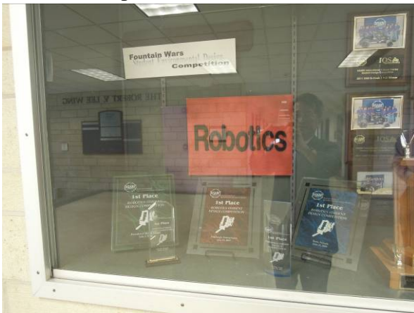
圖 3 BAE 系大學部學生歷年來參加農業機械人比賽，獲獎無數