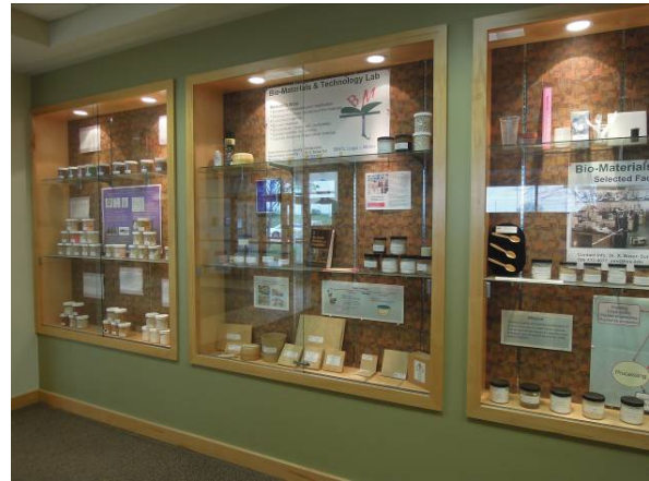
圖 16 BTL 生物材料實驗室研發之生物可分解接著劑產品展示