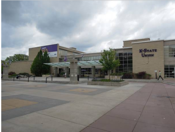
圖 23 堪薩斯州立大學學生活動中心 Student Union