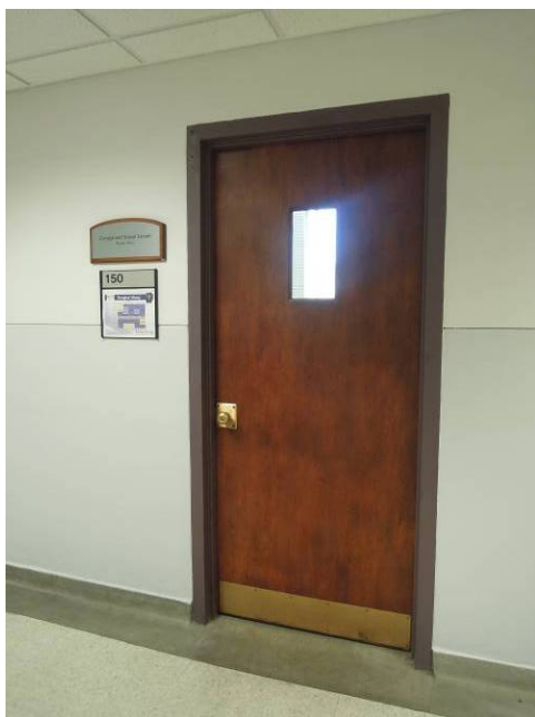
圖 7 退休教授辦公室外製作紀念名牌