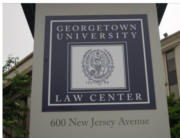
圖 42 喬治城大學法學院(Law Center) 校徽標示