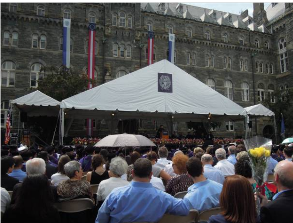
圖 37 喬治城大學法學院畢業典禮(二)