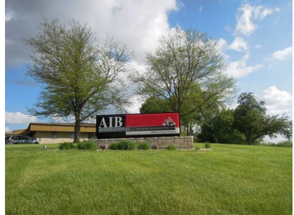
圖 22 AIB International 國際烘焙學院