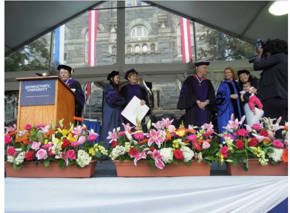
圖 38 喬治城大學法學院畢業典禮(三)