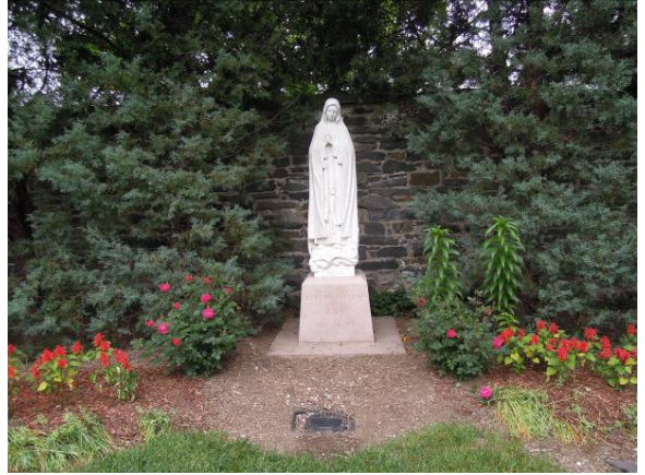
圖 36 喬治城大學校園內常可見聖母像