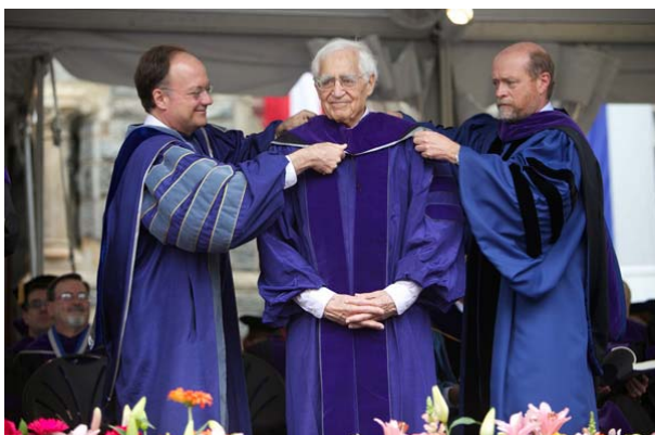
圖 39 頒發名譽法學博士學位給華盛頓 郵報專欄作家 Walter Haskell Pincus 校友