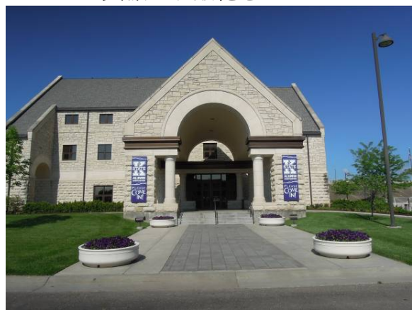
圖 10 美輪美奐的校友會館，顯見其對募款及校友服務工作非常重視