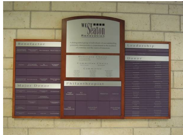
圖 6 系館入口處將重要捐款人之名字列出，以表彰其貢獻