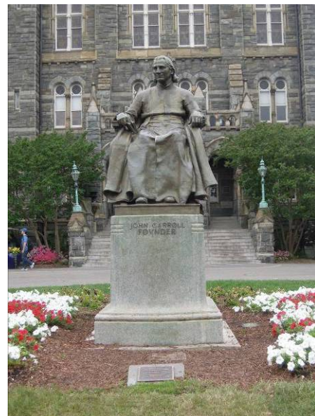
圖 32 喬治城大學創辦人：約翰·卡羅爾主教 (John Carroll)