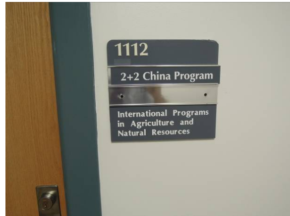
圖 28 馬里蘭大學農業與自然資源學院與中國大陸(中國農業大學...等)積極推動 2+2 program.