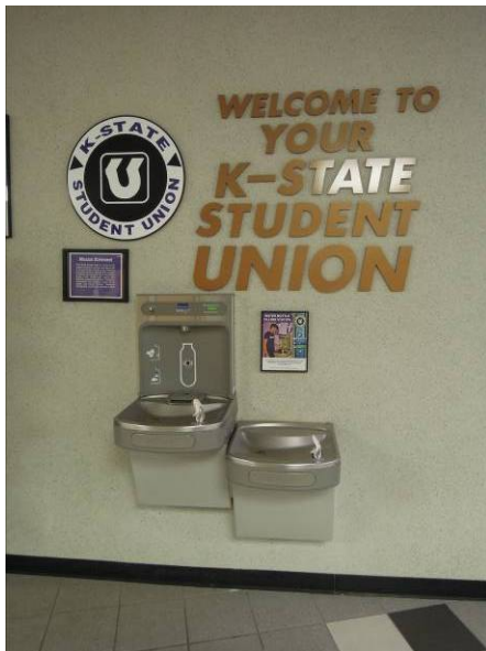
圖 25 感應式自動充水站 (一)