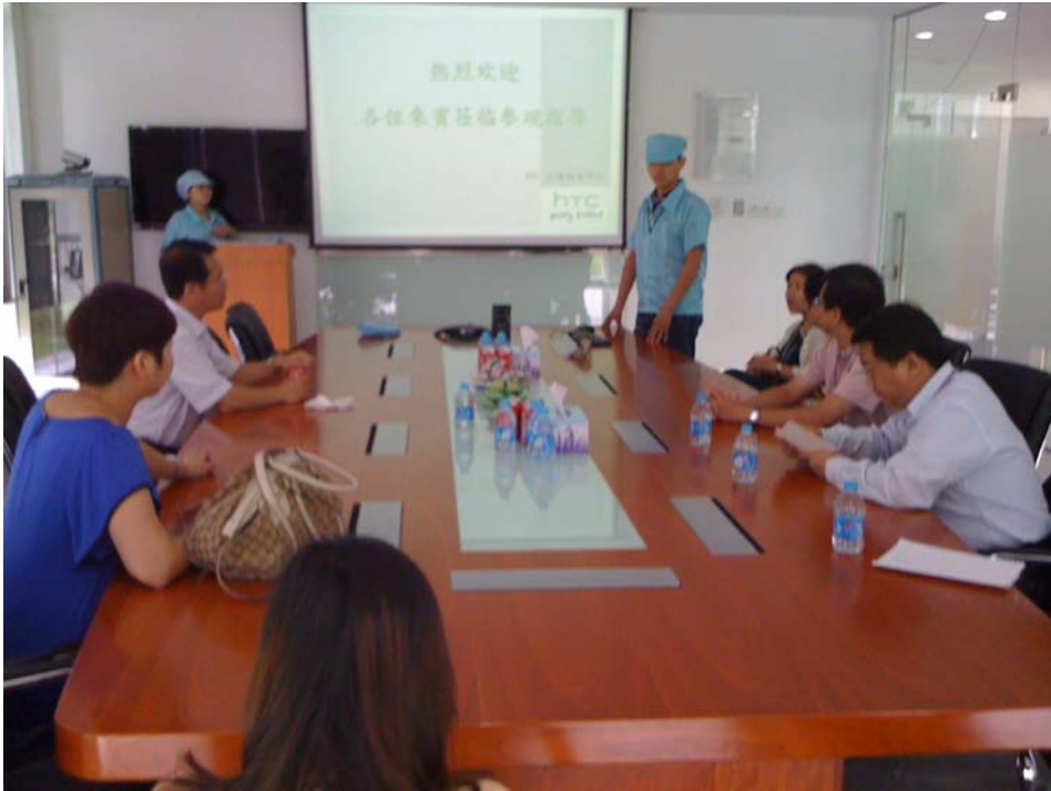
參觀 htc 工廠