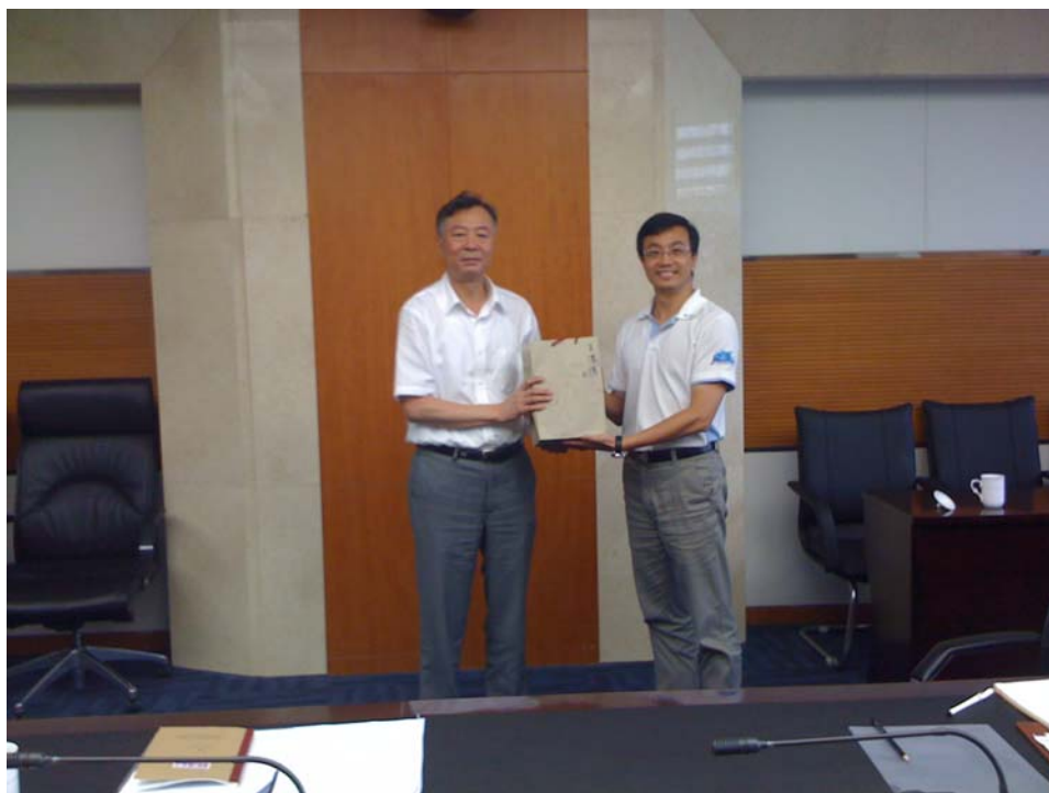
拜訪昆山經濟開發區