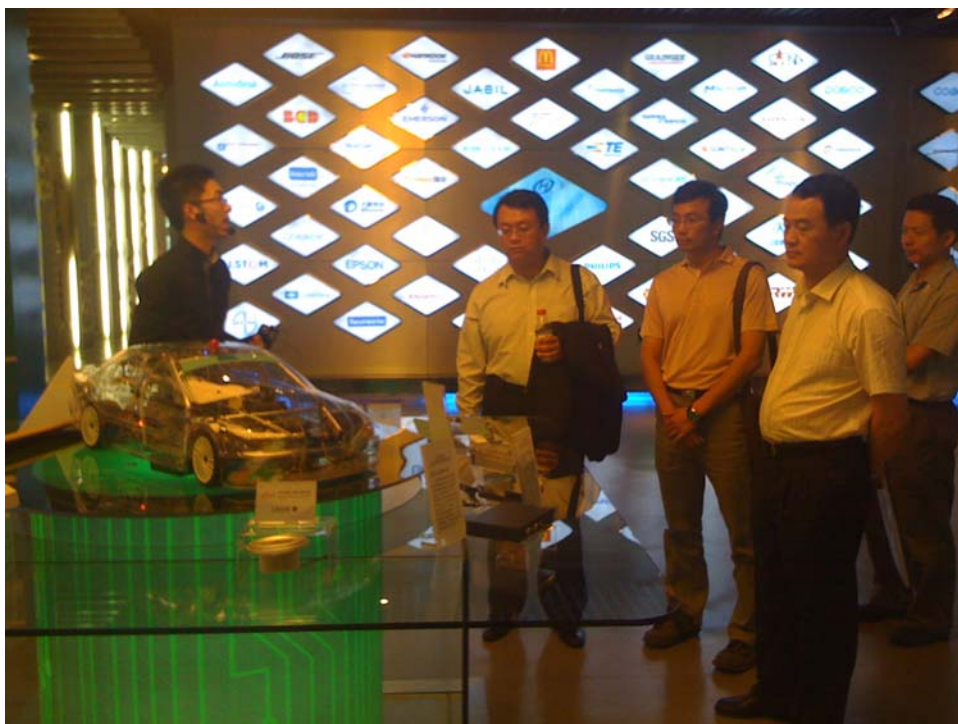
拜訪上海漕河涇新興技術開發區