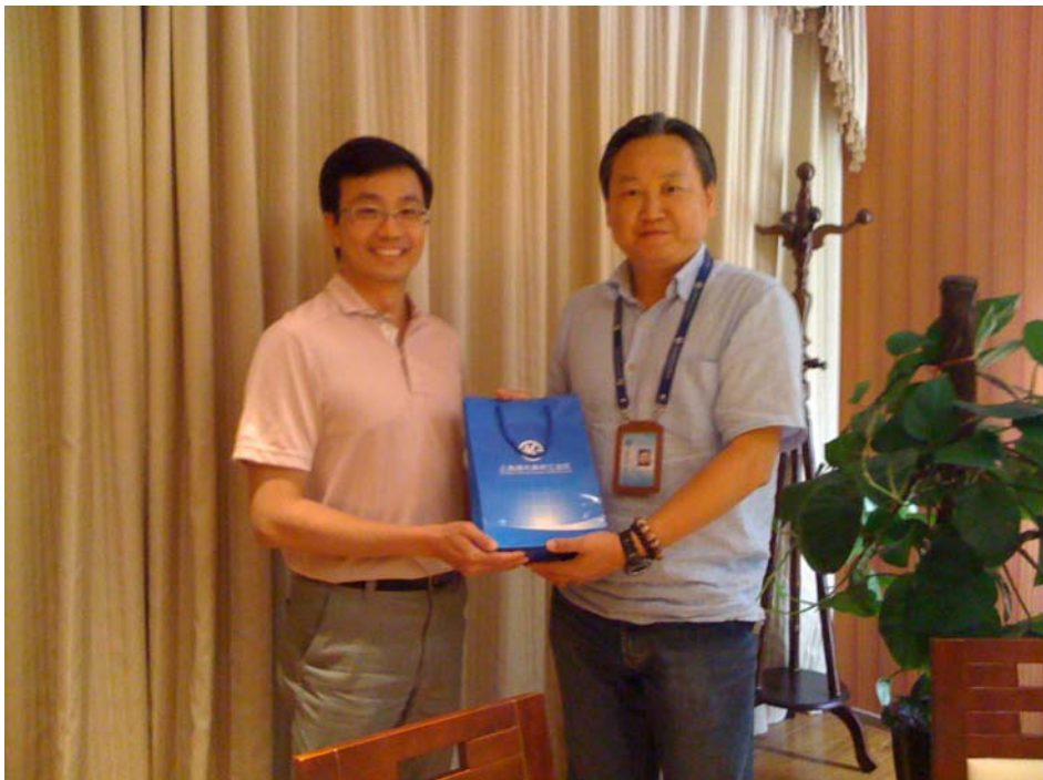
拜訪上海浦東康橋經濟開發區