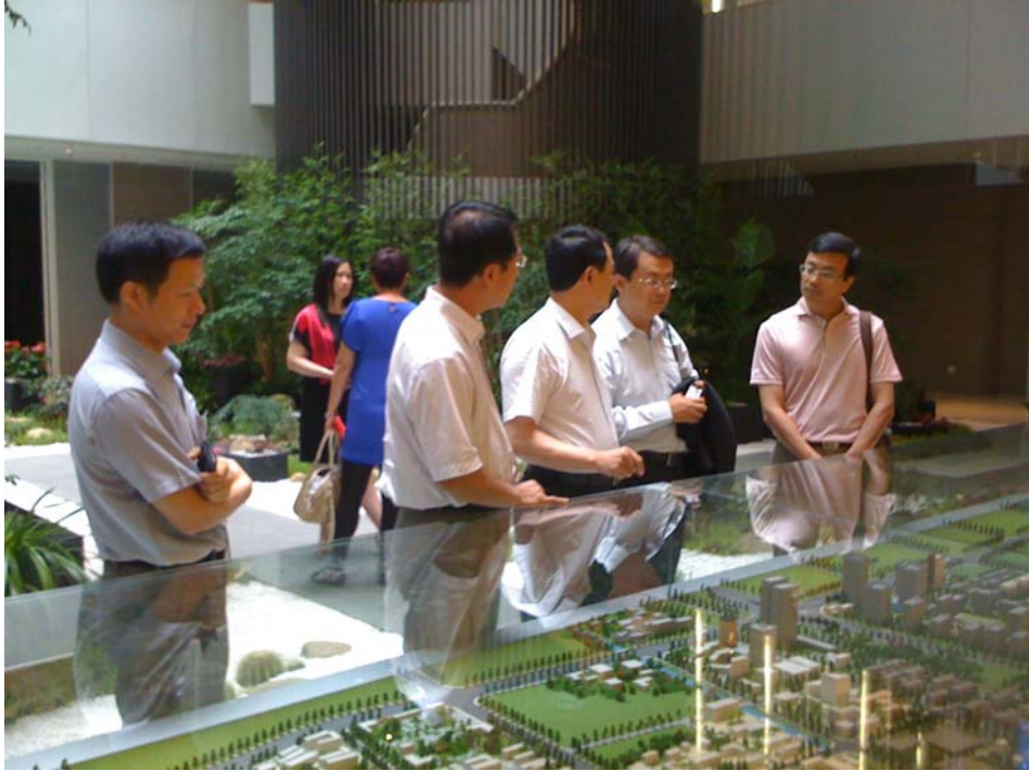
拜訪上海漕河涇新興技術開發區