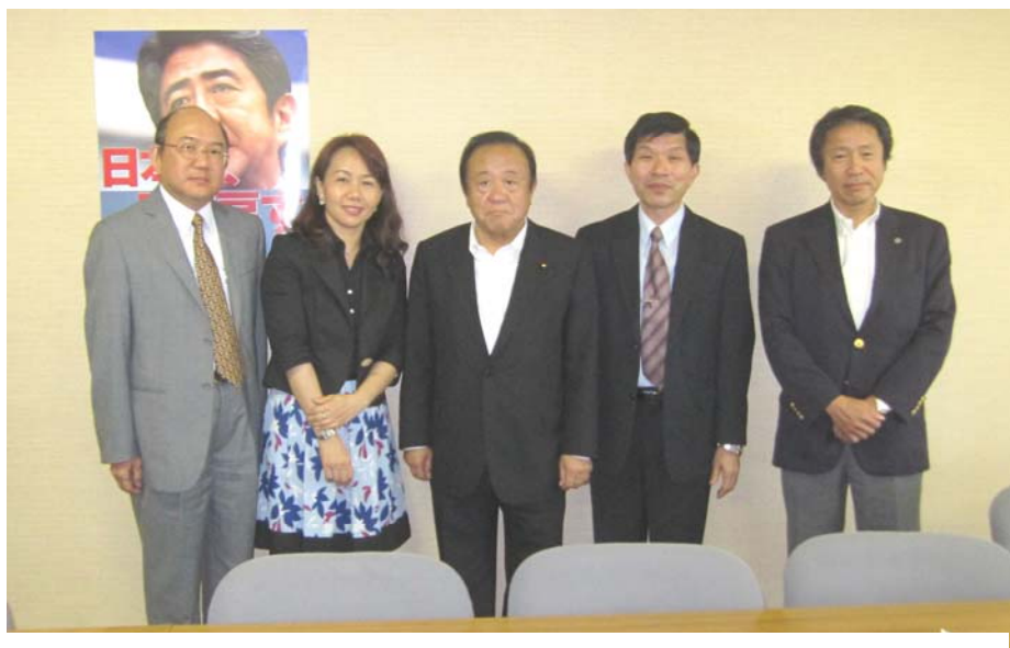
照片 4：與眾議院議員坂本剛二、自由民主黨部政策調查會調查役木村宏等人會談及合影