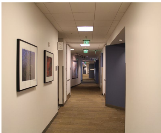
舊金山州立大學（SFSU）MBA 教學空間