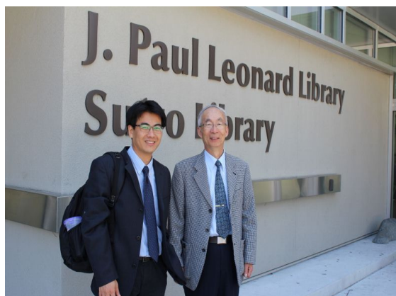
4. SFSU 校園參訪