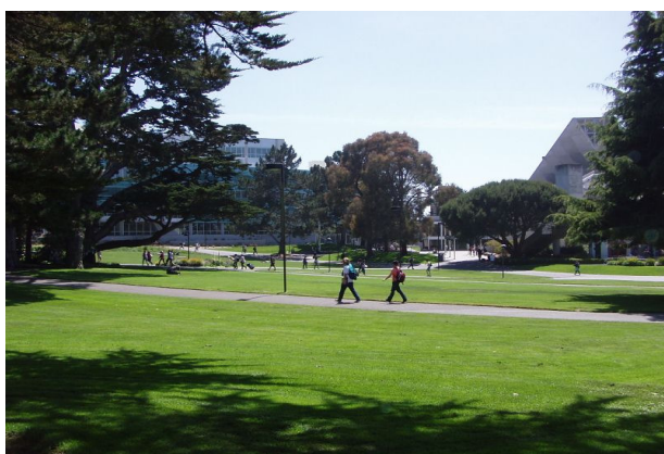
3. SFSU 校園參訪