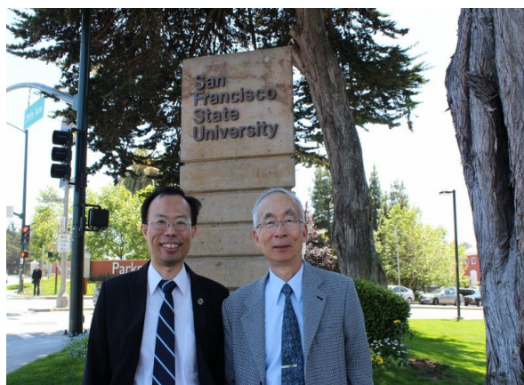
SFSU 校園參訪(圖 2 至圖 4)