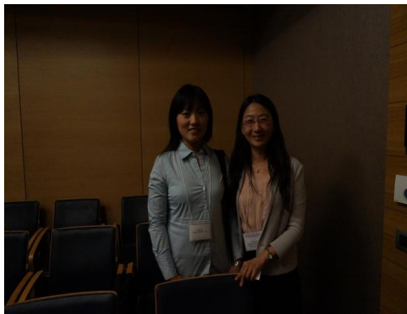
圖三 與會學者留影