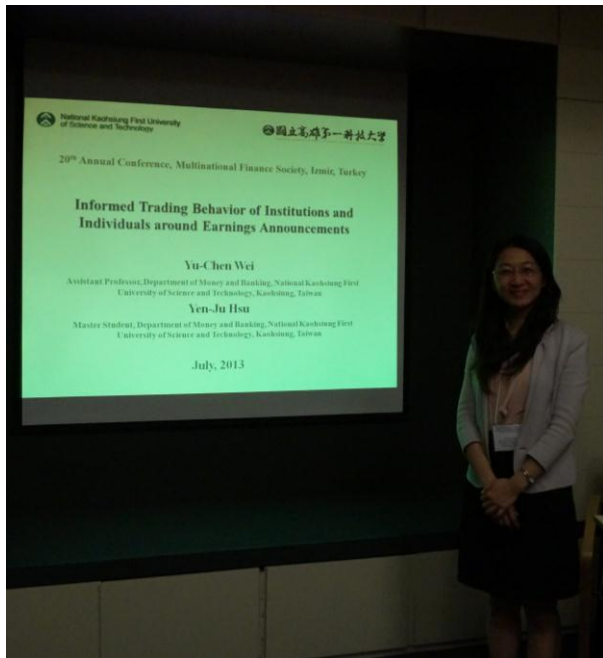
圖一 2013 MFS 研究論文報告