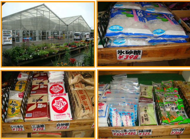
位於埼玉縣的「道の駅花園」，是具有當地特色及農業產品展售的地方觀光事業。圖為花卉市場與其砂糖展售品項。