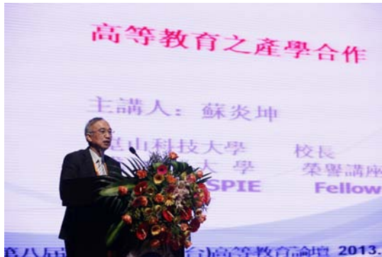
蘇炎坤校長（昆山科技大學校長）發表： 高等教育之產學合作