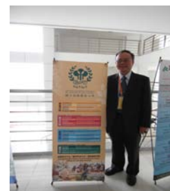
兩岸各高校海報展示