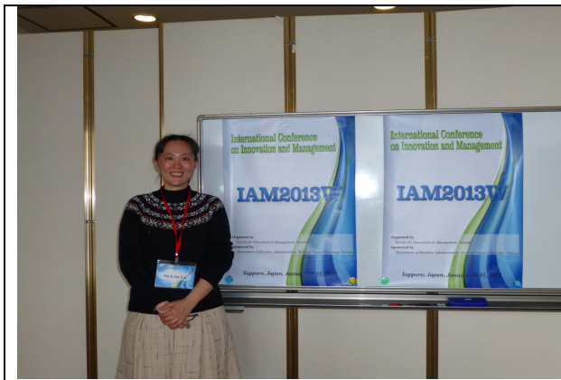
圖 1-1.於會場報到後與相關海報資料之合影。