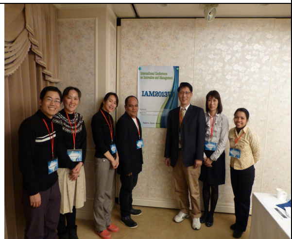
圖 1-6.參於本場次參與者之合影。