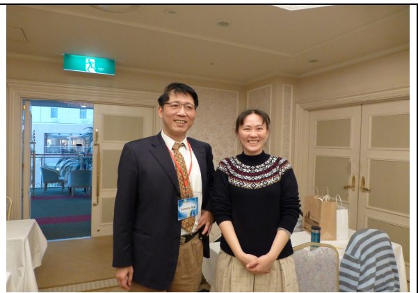
圖 1-2.與相關的與會學者合影，並交換名片，互相交流學術意見。