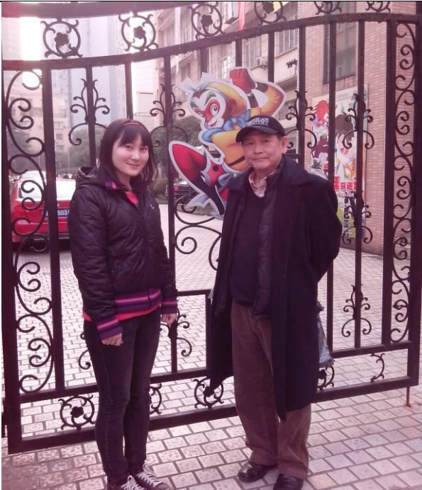
參訪著名的上海美術電影製片廠及附屬培訓中心。