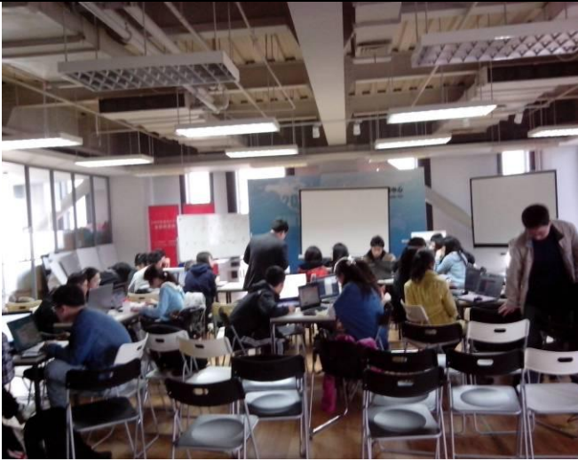
設計學院的教學設施相當完善。