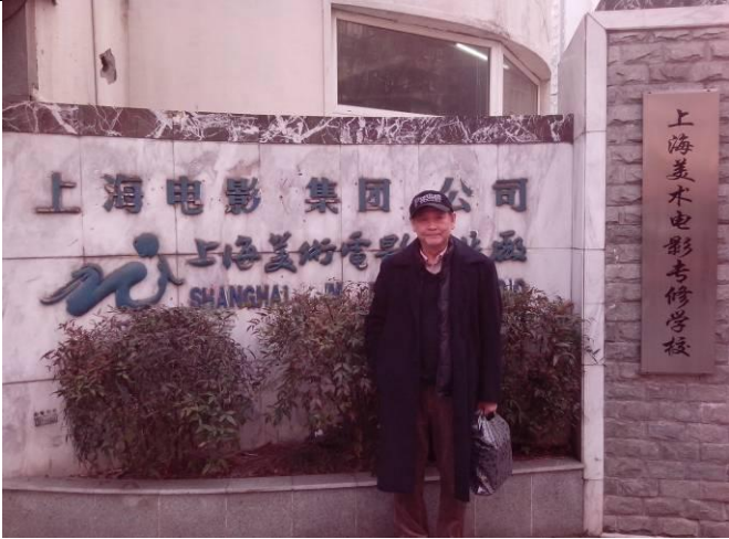
參訪著名的上海美術電影製片廠及附屬培訓中心。