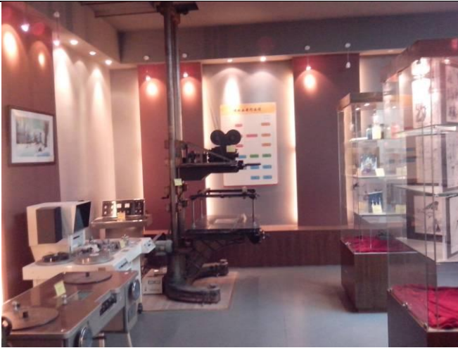
動畫資料文獻及相關設施的展示。