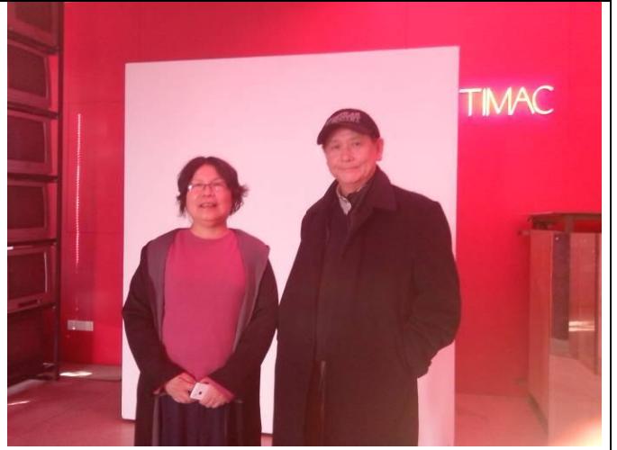
與同濟新媒體中心的主管合影。