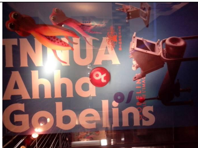
臺南藝術大學動畫藝術與影像(TNNUA)於法國著名的葛伯藍(Gobelin)動畫學院各自代表東西方動畫藝術。