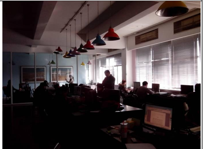
科技中心的電腦動畫教室。