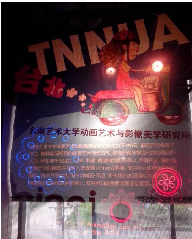
臺南藝術大學動畫藝術與影像美學研究所(TNNUA)於法國著名的葛伯藍(Gobelin)動畫學院各自代表東西方動畫藝術。