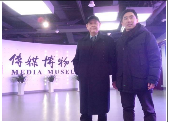
訪中國傳媒大學媒體博物館。