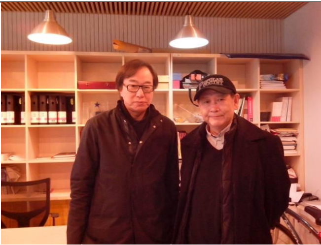
與設計學院副院長合影。