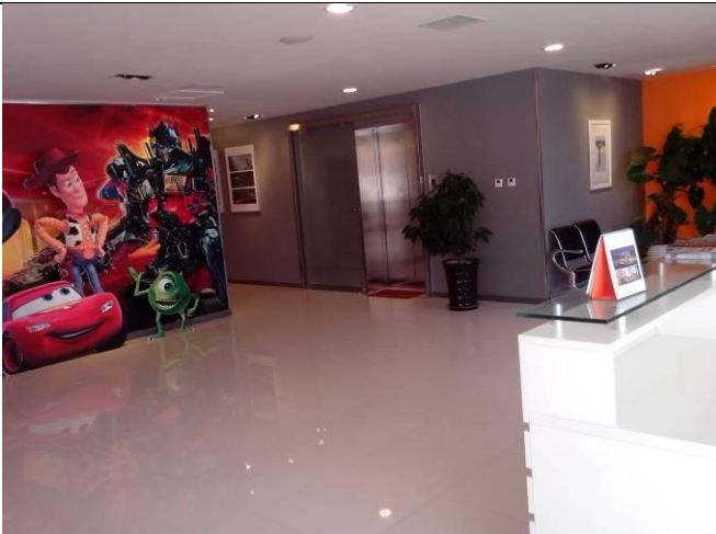
國際培訓是目前電影、動畫教育的趨勢。