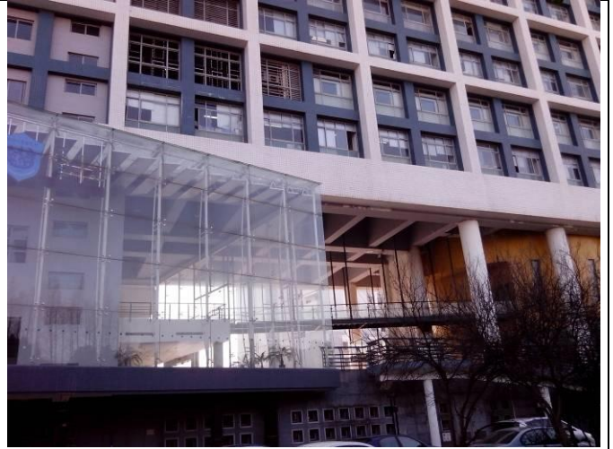
國際色彩濃厚的同濟大學十分現代化。