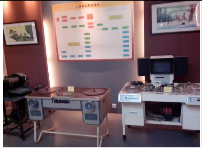
動畫資料文獻及相關設施的展示。