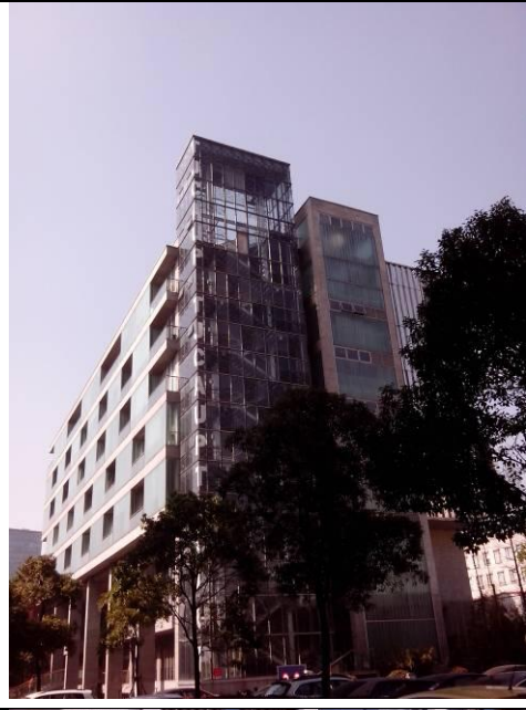
參訪以建築、設計聞名的同濟大學及設計學院。