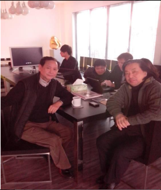
與科技中心的教授們合影。