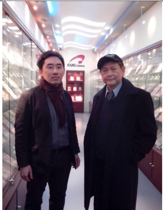
與動畫系教學單位主管合影。