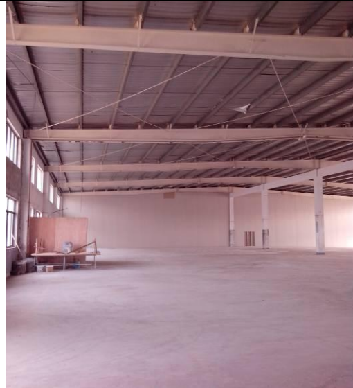
為國際培訓所需而增建的動畫虛擬影棚。