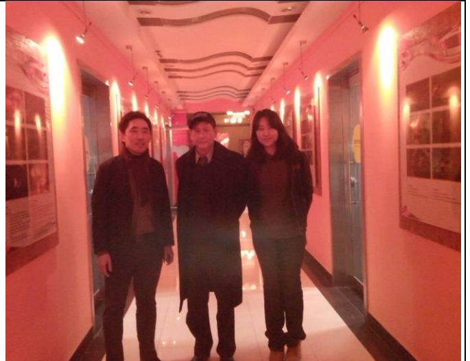
參訪動畫系及與系所人員合影。