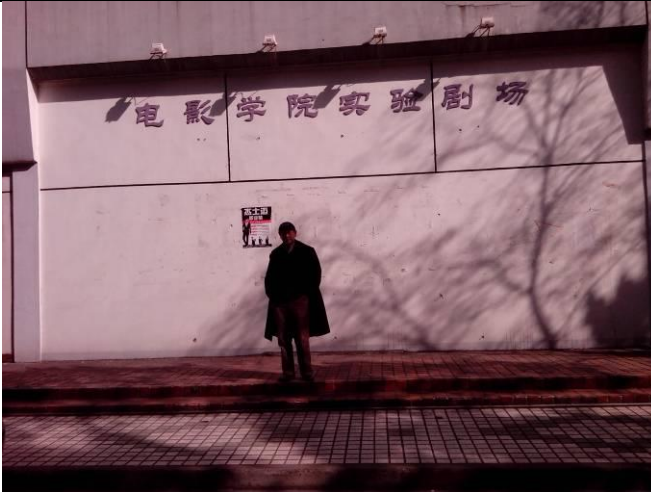
參訪同濟新媒體電影學院，著重實驗影像創作的教學為其特色。