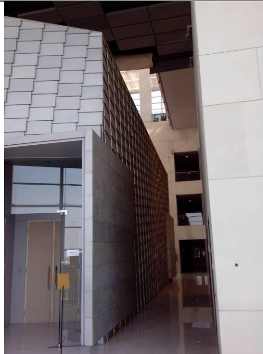
同濟大學設計學院的藝術人文氣息突出。