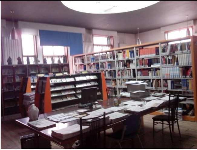
訪動畫系豐富的資料中心提供教學所用。