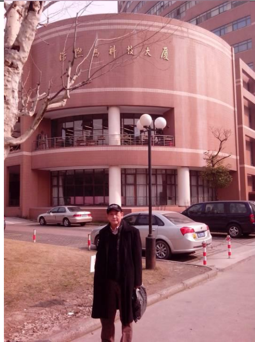
參訪上海市交通大學科技中心。