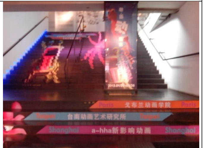
參加於上海琉璃工房 A-HA 國際動畫展，南藝大動畫精選亦是展出重點。