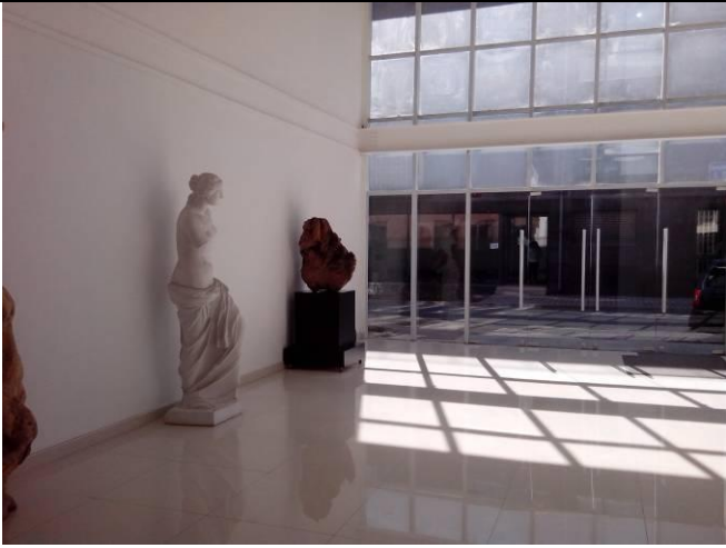
歐美式的創作氣氛是其特色。