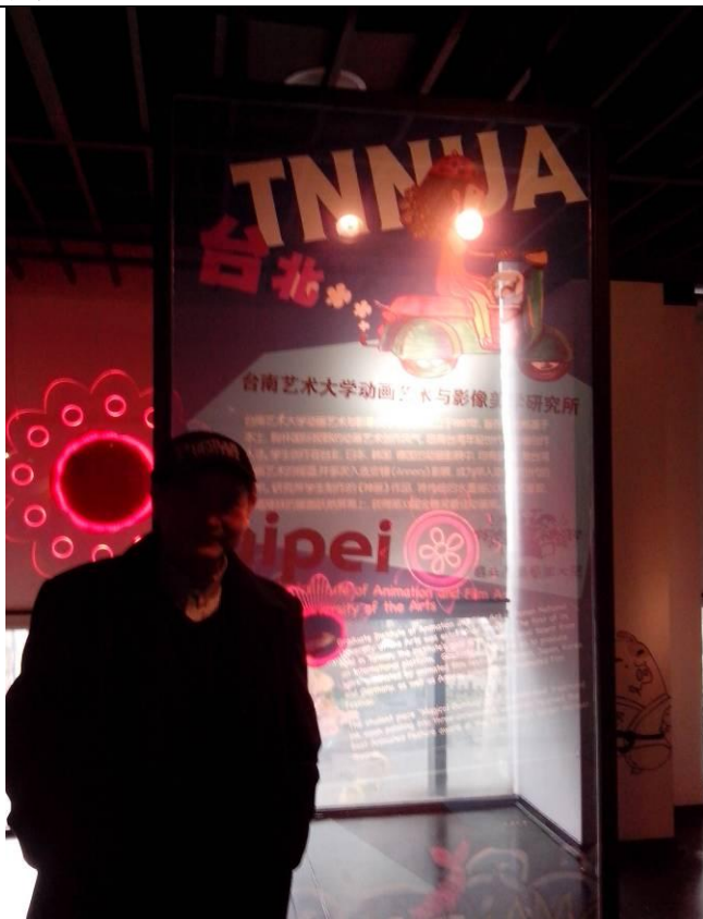
臺南藝術大學動畫藝術與影像(TNNUA)於法國著名的葛伯藍(Gobelin)動畫學院各自代表東西方動畫藝術。