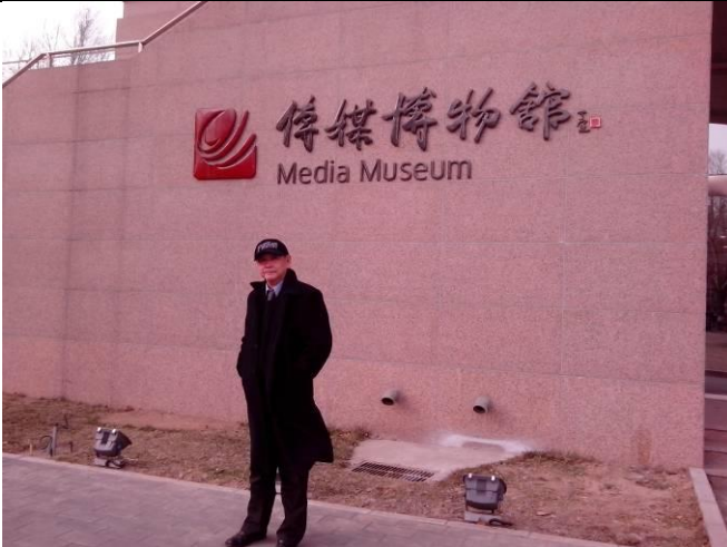
參訪中國傳媒大學媒體博物館。