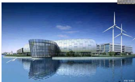
建筑节能研发基地