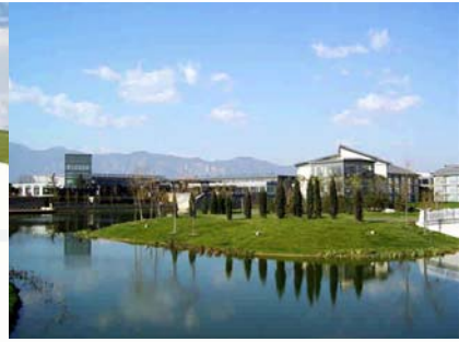
稻香湖景观 际酒店