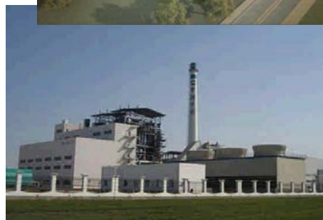
宿迁生物质能直 燃发电项目