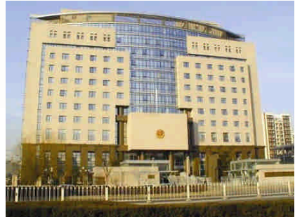
海淀区公安局 办公楼