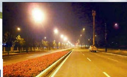
常熟市路灯建设项目