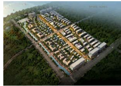
中节能环保江西低碳 环保科技园