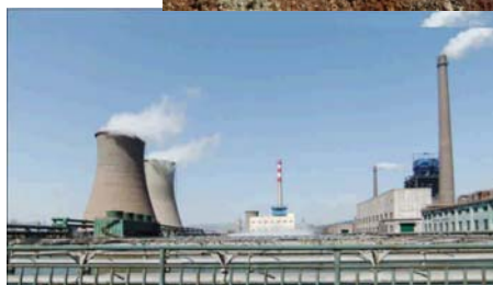
天津铁厂高炉煤气发电项目