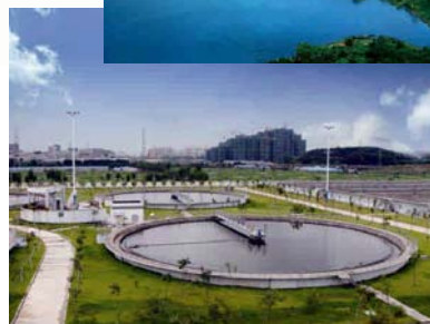
深圳污水处理项目