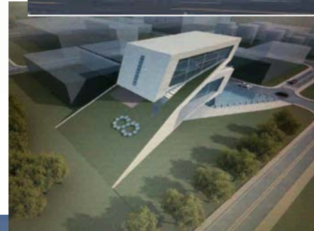
厦门生活垃圾资源 再生示范项目