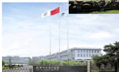
杭州能源与环境产业园