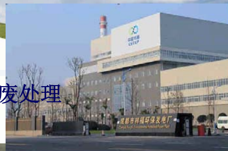
成都生活垃圾焚烧 发电项目