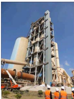
拉法基水泥余 热发电项目