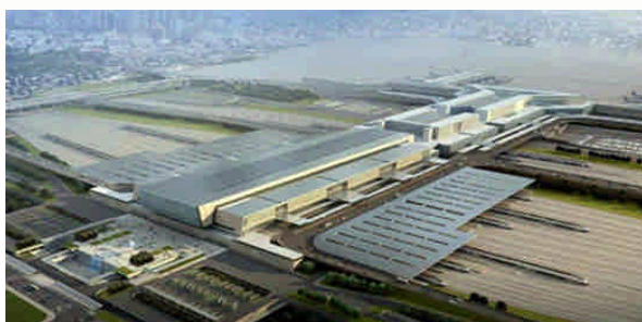
上海虹桥光伏发电项目