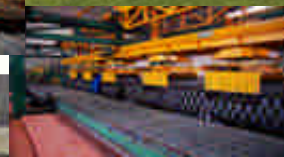
新型节能建材生产线