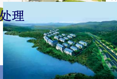
浙江湖州原水项目