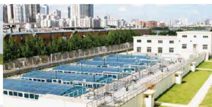
厦门污水处理项目